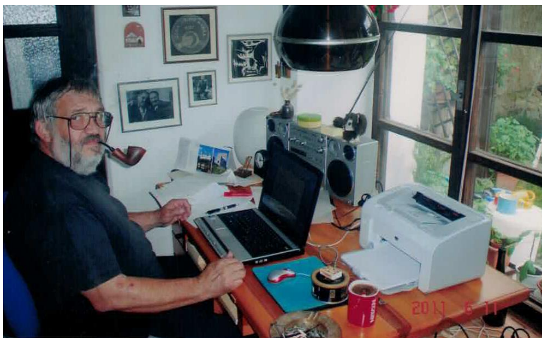
Obr. 2: Spisovatel ve své pracovně, ve které píše povídky