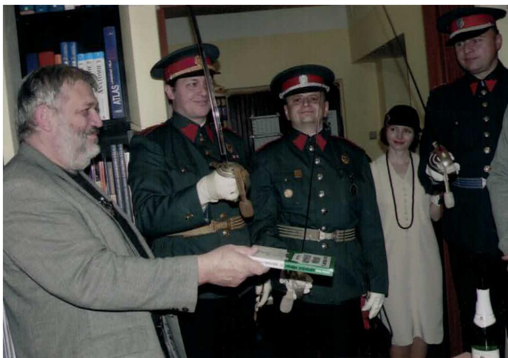
Obr. 6: Četníci křtí knihu četnických povídek šavlemi