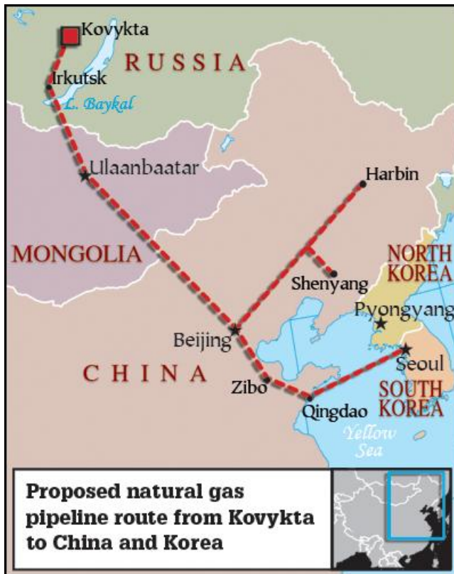
Příloha č. 1: Mapa trasy plynovodu Kovykta