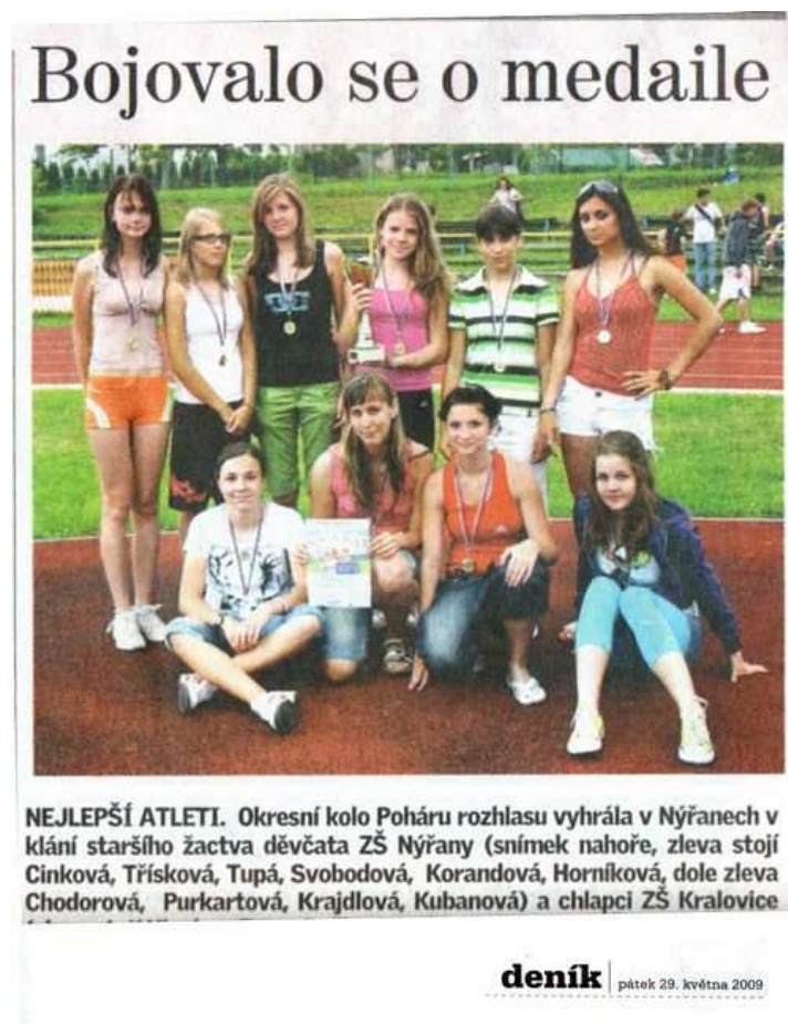
Obrázek č. 16 Článek z Plzeňského deníku

V Poháru rozhlasu zvítězilo družstvo starších žákyní (5 511 bodů) a postoupilo do krajského finále, kde skončilo na místě třetím.