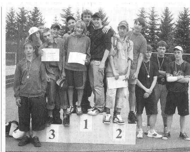
NEJLEPŠÍ ATLETI. Ve čtvrtek proběhlo klání školních atletických týmů. V okresním kole čtyřboje starších žáků zvítězila ZŠ Nýřany (uprostřed) před ZŠ Kralovice (vpravo) a ZŠ Heřmanova Huť.

Starší žáci: 1. ZŠ Nýřany, 2. ZŠ Kralovice, 3. ZŠ Heřmanova Huť. (kpo)