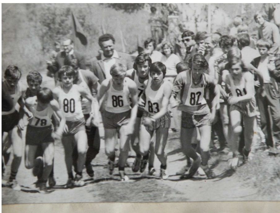
Obrázek č. 21 Start žáků

V polovině měsíce května roku 1978 byl opět uspořádán Běh nýřanské stávky 1890. Tento ročník se vyznačoval hned několika zajímavostmi. Zúčastnilo se ho 347 závodníků a vyhrál jej opět Ivan Ullsperger. Poprvé se zde ale objevil zahraniční účastník. Byl jím veterán z NSR T. Luft. Závod se mohl pochlubit také účastí nejstaršího běhajícího veterána - jihlavského Ing. Hrbka, který v roce 1978 oslavil své osmdesáté narozeniny.