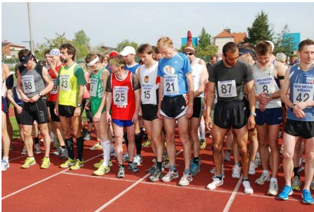
Obrázek č. 24 Strat 40. ročníku Běhu města Nýřany