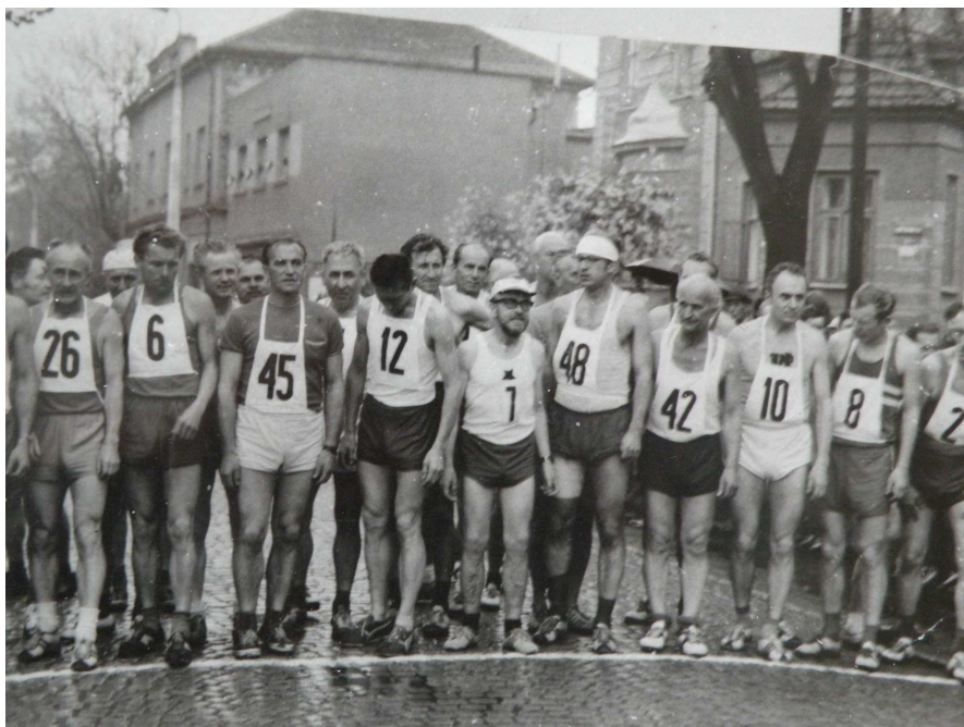
Obrázek č. 20 Start veteránů v roce 1972