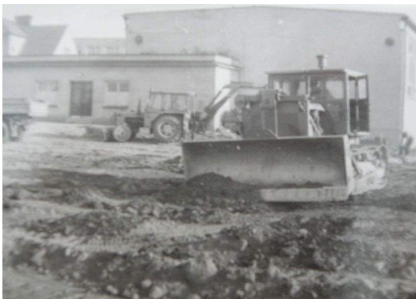
Obrázek č. 2 Budování atletického stadionu u ZDŠ Nýřany

Na podzim tohoto roku byli z řad bývalých atletů vyškoleni další trenéři a rozhodčí.