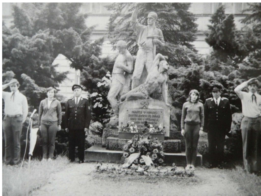
Obrázek č. 22 Pietní akt u pomníku zastřelených horníků