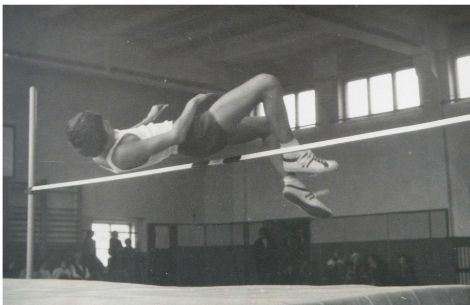
Obrázek č. 4 II. ročník Nýřanské laťky v roce 1975