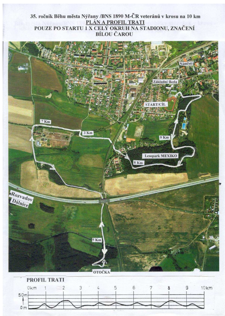
Obrázek č. 23 Současný plán tratě

Ve významném roce 2000 a zároveň jubilejním 30. ročníku Běhu města Nýřany – BNS 1890 zvítězil v hlavním závodě a obhájil tak vítězství z předešlého roku Zdeněk Dubravčík z Baníku Stříbro v čase 0:32.23,0.