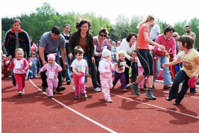
Obrázek č. 26 Start nejmladších ročníků