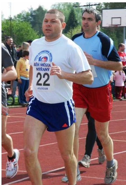
Obrázek č. 25 Nýřanští závodníci na trati