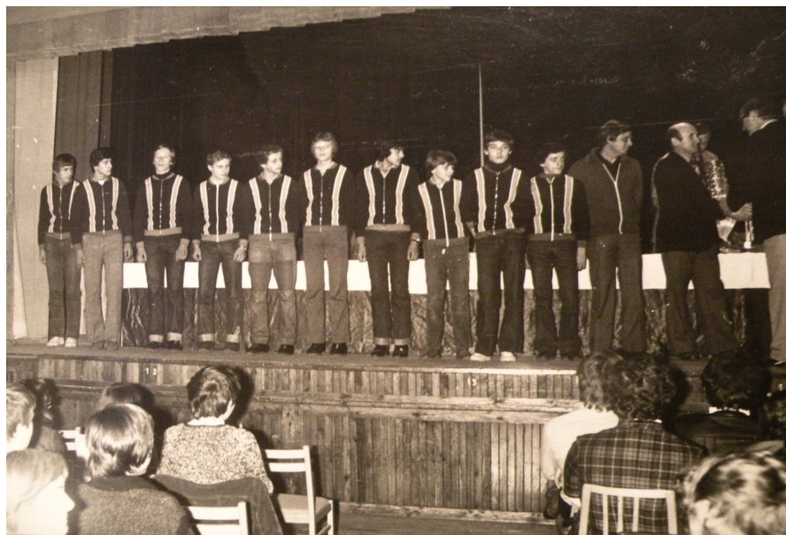
Obrázek č. 10 Vítězné družstvo ZDŠ Nýřany při vyhlášení v kulturním domě