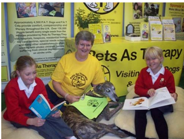
Fotografie 2 - program Read 2 Dogs.