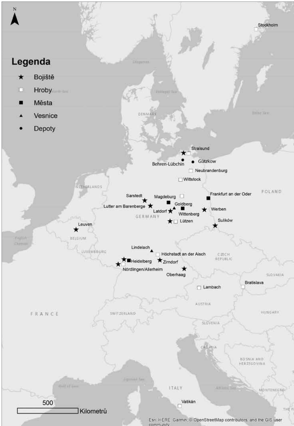
Mapa 1. Mapa zahraničních lokalit z doby třicetileté války. © M. Preusz. Karte 1. Karte ausländischer Fundstellen aus der Zeit des Dreißigjährigen Krieges. © M. Preusz.