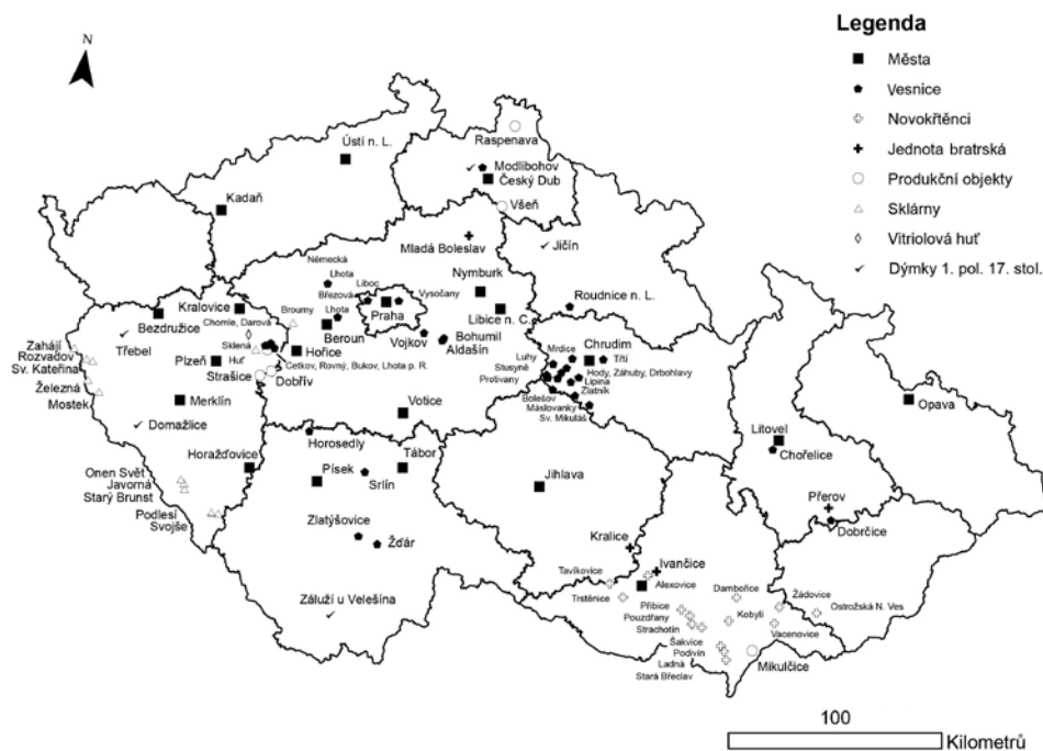
Mapa 3. Mapa městských horizontů, vsí, novokřtěneckých areálů a lokalit spjatých s Jednotou bratrskou, skláren, specifických výrobních zařízení, vitriolových hutí a nálezů dýmek z 1. poloviny 17. století. © M. Preusz. Karte 3. Karte mit den Horizonten von Städten, Dörfern, mit den Böhmischem Brüdern verbundenen Wiedertäuferarealen und Fundstellen, von Glashütten, speziellen Produktionsanlagen, Vitriolhütten und Pfeifenfunden aus der ersten Hälfte des 17. Jahrhunderts. © M. Preusz.

sobě uloženy ostruhy a rapír vyrobený mezi lety 1600 až 1630 (Codreanu-Windauer 1988, 150; 1993/1994, 285). V kontextu pohřbů známých osobností lze upozornit na ještě nevyhodnocený průzkum hrobky Jana Jiřího ze Švamberka v Poběžovicích, který proběhl 26. června 2018. 2