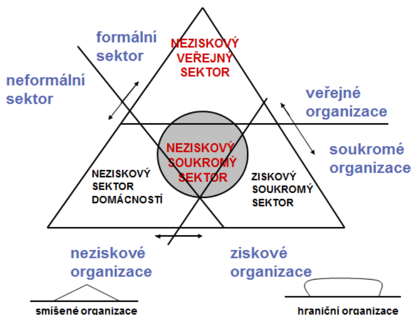
Obrázek č. 1: Pestoffův trojúhelník blahobytu