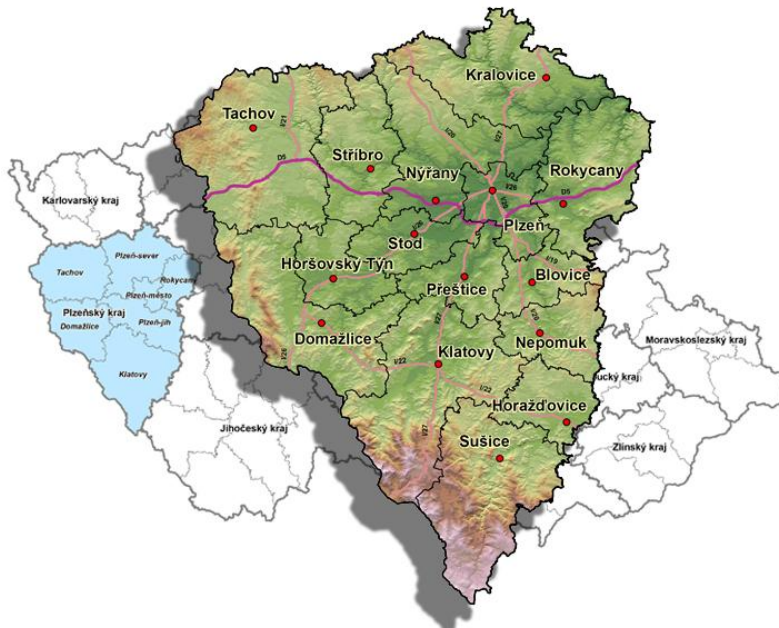
Obr. 1.: Poloha a vnitřní uspořádání Plzeňského kraje (Poloha a vnitřní uspořádání Plzeňského kraje. Plzeňský kraj [online]. 2012 [cit. 2018-11-05]. Dostupné z: https://plzensky-krj.webnode.cz/files/200000013-b7133b80d4/mapa_plz_kraj.jpg )

Přirozeným centrem kraje je metropolitní město Plzeň, kolem nějž se nachází vysoká koncentrace venkovských sídel. Právě jejich velké množství je typickým rysem tohoto území. Více než 4/5 rozlohy tvoří katastrální území obcí do 2 000 obyvatel a žije v nich přes 30% obyvatelstva celkem. Se svým podílem 5,4% na celkovém počtu obyvatel se řadí jako druhý nejřidčeji zalidněný kraj v České republice. Počtem obyvatel je devátý.