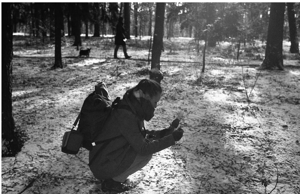
Obrázek 1 - fotografování Bonifáce