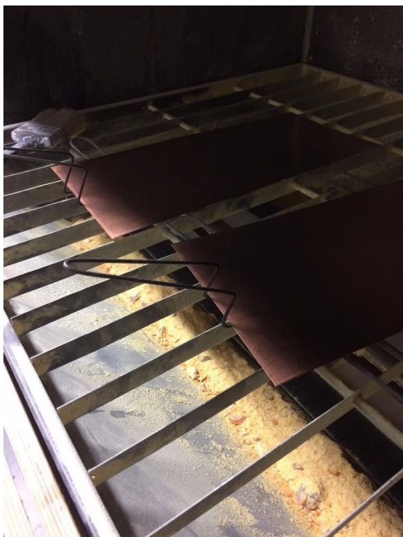
Obrázek 4 - zaprašování měděných desek kalafunou