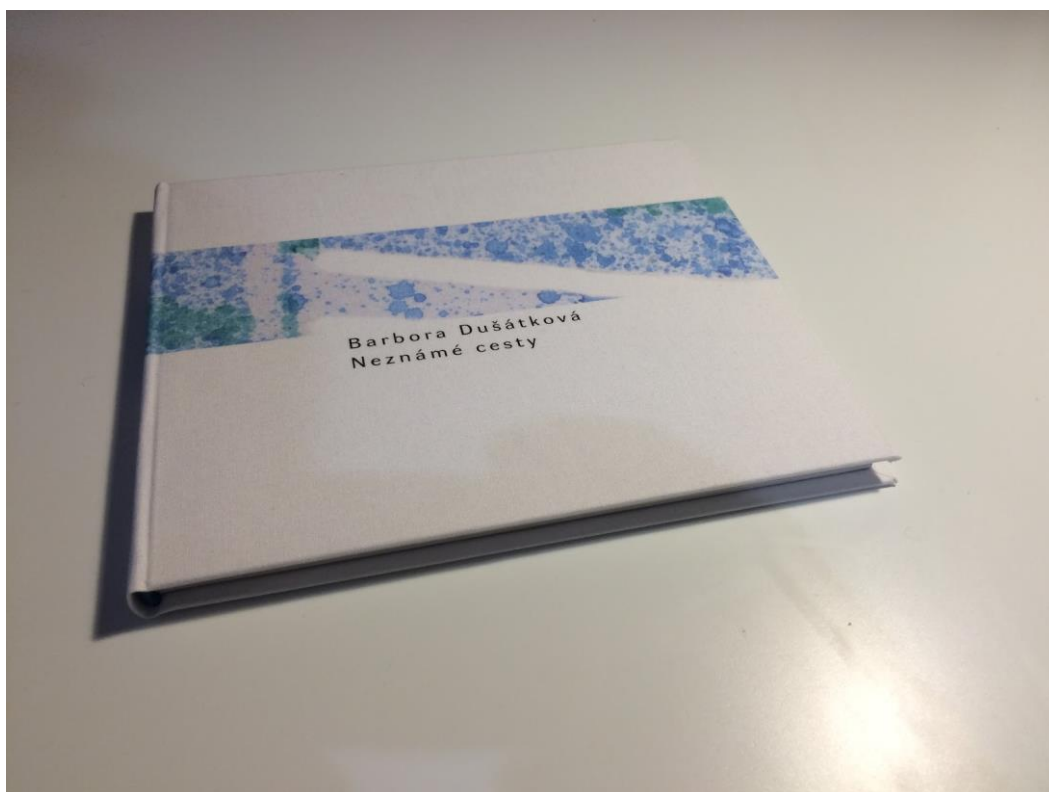
Obrázek 12 – kniha (foto vlastní)