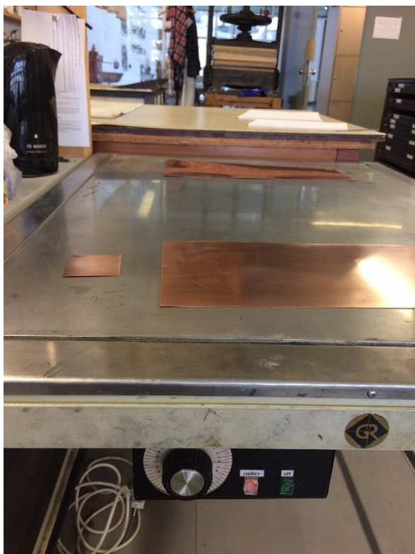
Obrázek 5 - zapékání kalafuny na horké plotně