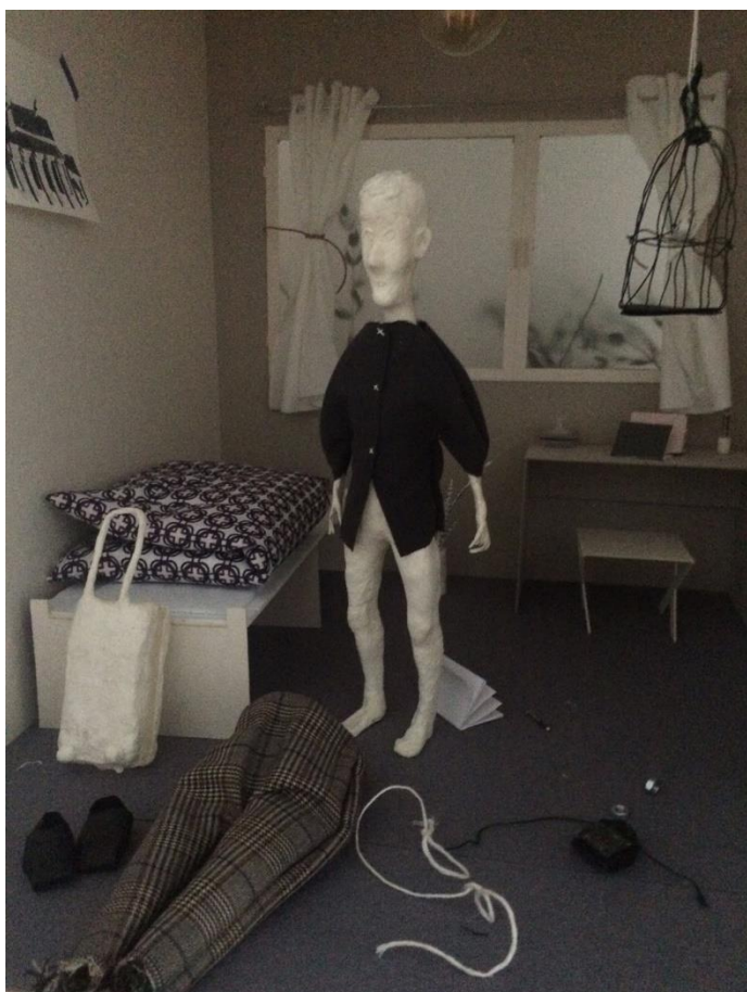
Obrázek 2 - zkouška Bonifácových kalhot