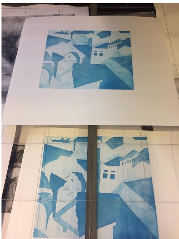
Obrázek 12 - sušení tisků (foto vlastní)