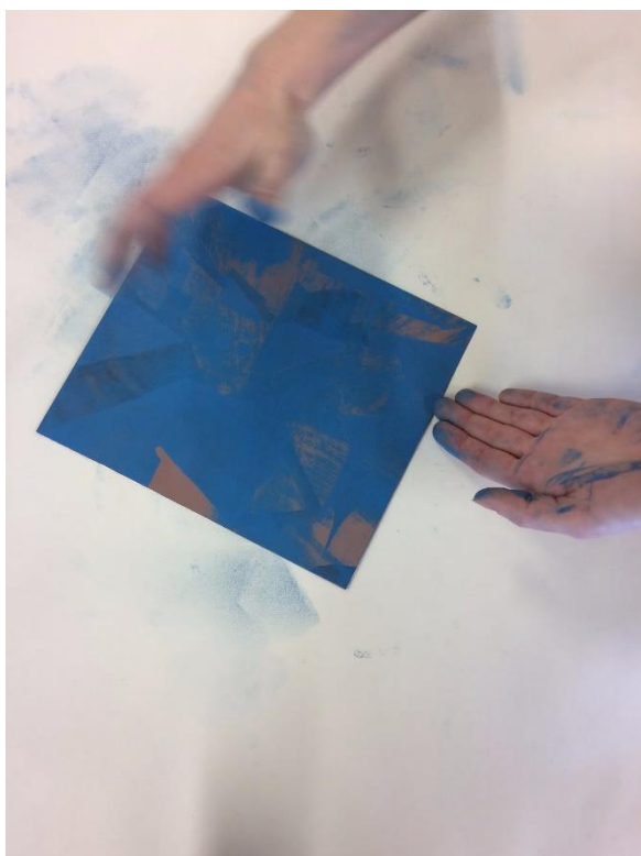
Obrázek 10 - vytírání matrice detail