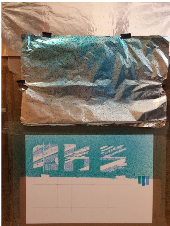
Obrázek 3 - dokončené šablonové tisky