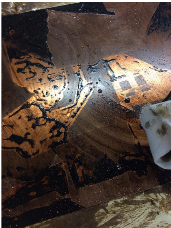
Obrázek 7 - mytí asfaltového laku petrolejí