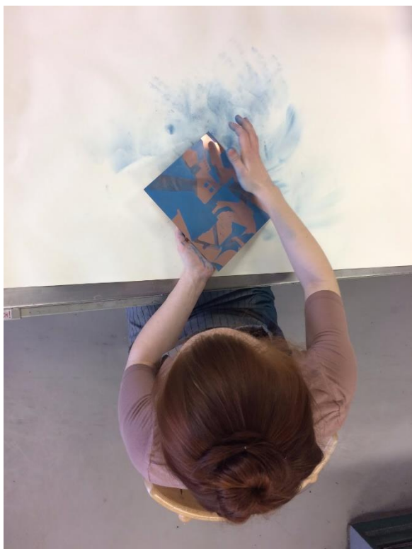
Obrázek 9 - vytírání matrice