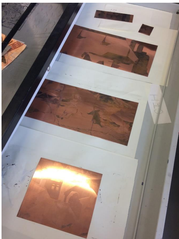
Obrázek 8 - hotové matrice