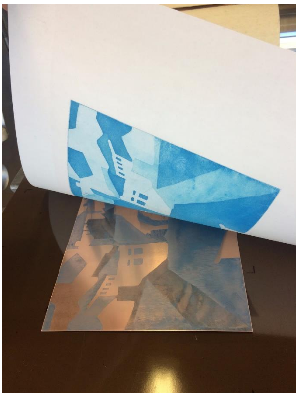
Obrázek 11 - tisk