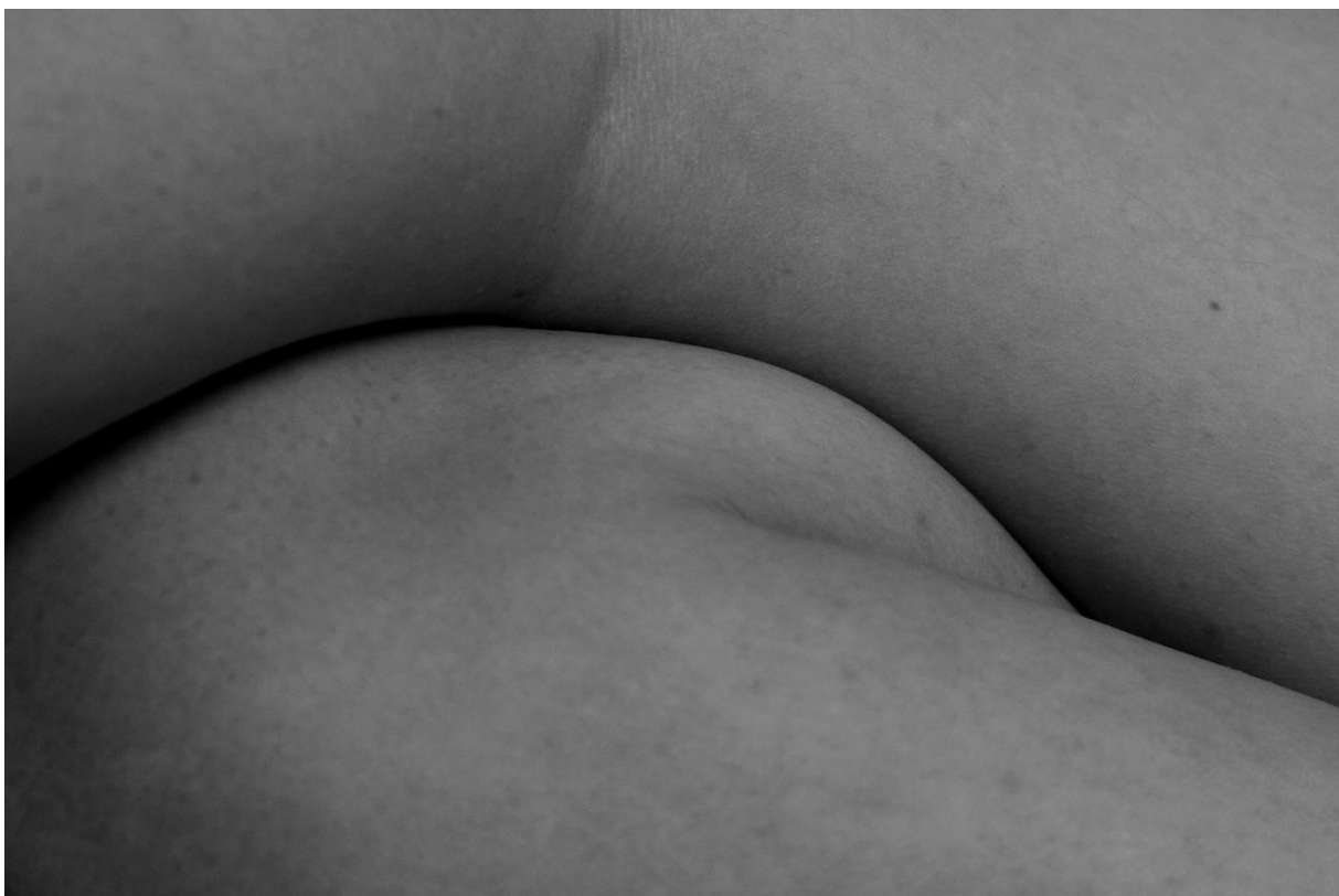
Obrázek č.4, detailní fotografie zavěšená na objektu