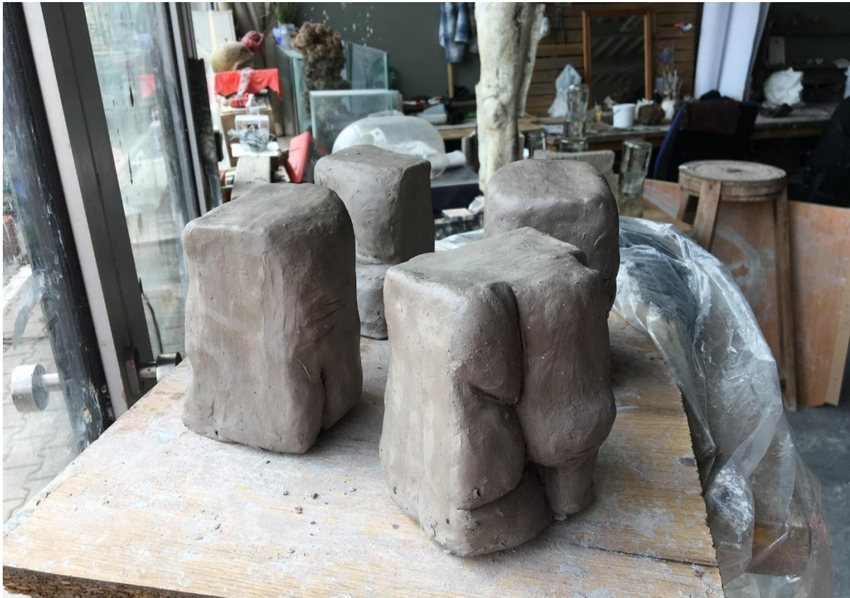
Obr. č.7, modely detailních částí ze sochařské hlíny