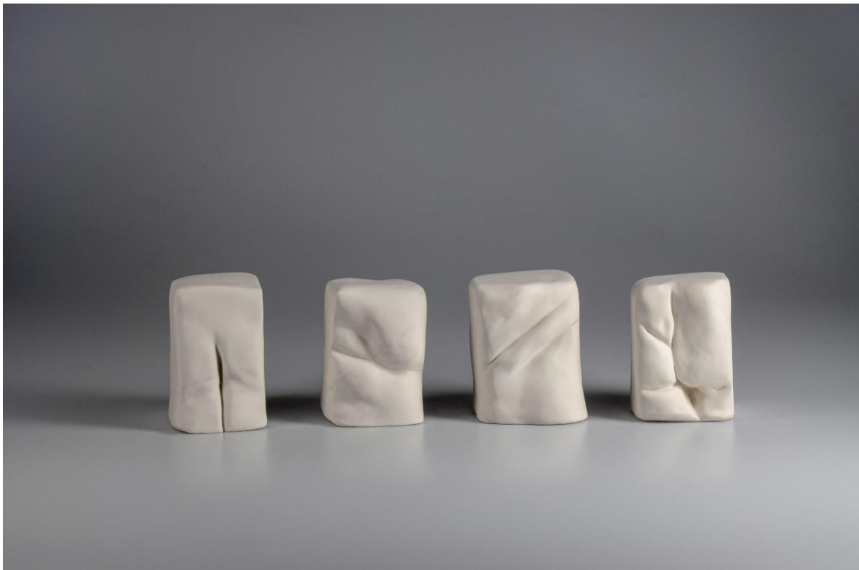
Obrázek č. 13, třetí pohled na plastiky Nemoc těla a duše