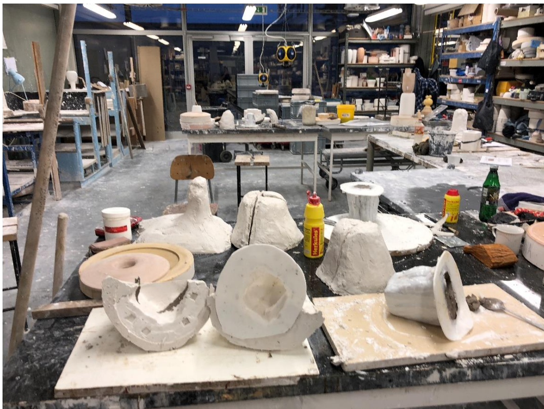
Obr. č.9 silikonové formy zakliněné v kadlubech ze sádry. Drží silikon pevný, aby se následně mohla vylít sádra.