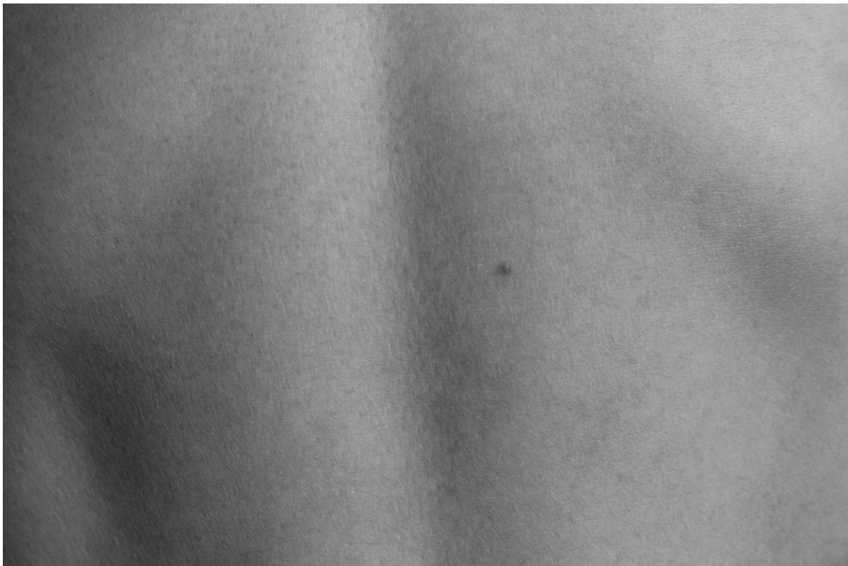
Obrázek č.3, detailní fotografie zavěšená na objektu