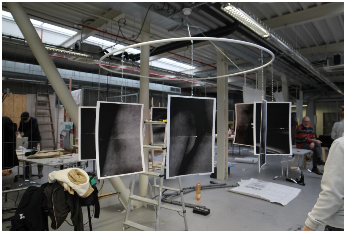
Obrázek č. 1, závěsný kolotoč, objekt, Něco nového