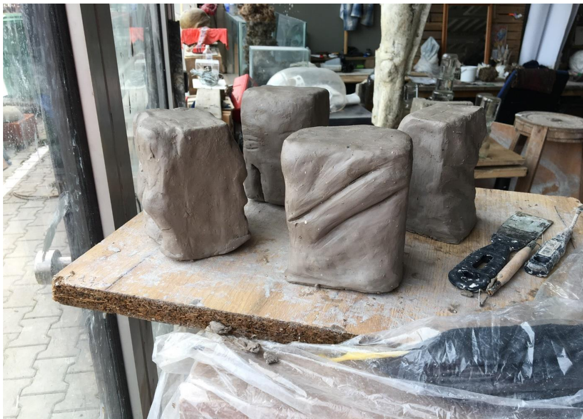
Obr. č.8, další pohled na modely