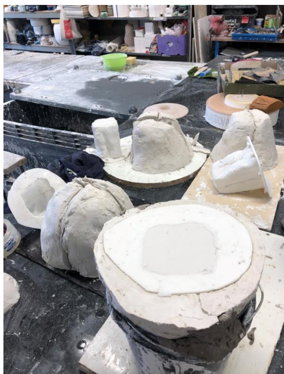
Obr. č. 10. Detail odlévané formy