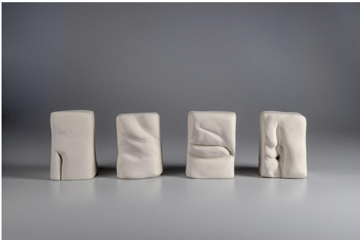
Obr. č. 11 první pohled na plastiky Nemoc těla a duše