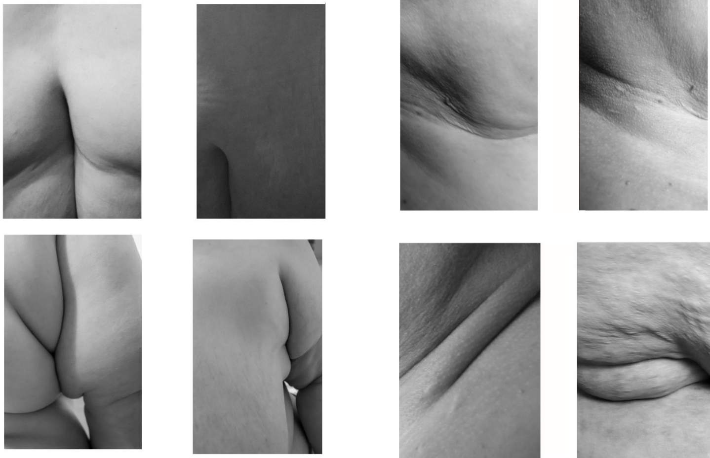
Obr. č. 6, výsledné fotografie detailních částí obézního těla