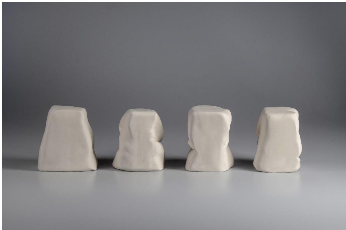
Obr. č. 12 druhý pohled na plastiky Nemoc těla a duše