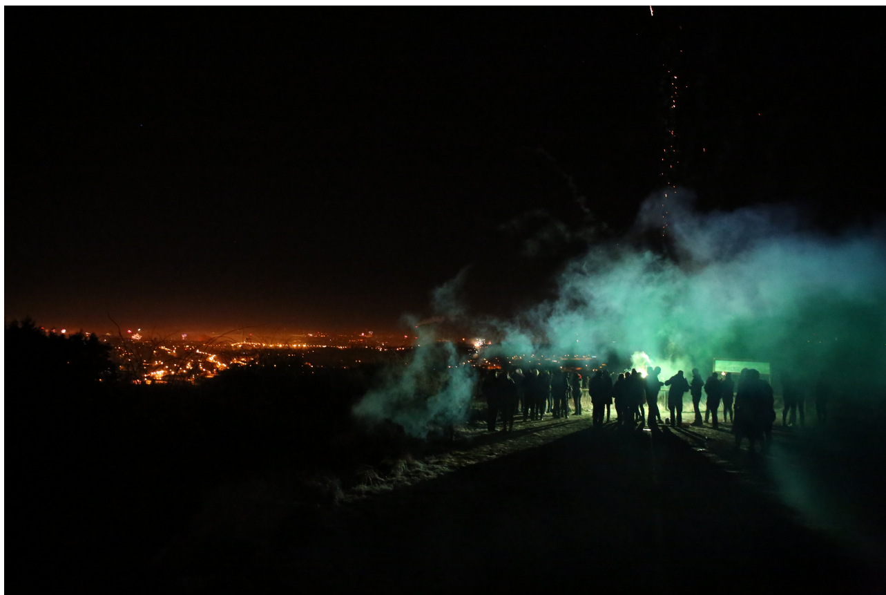
Nepoužitá fotografie