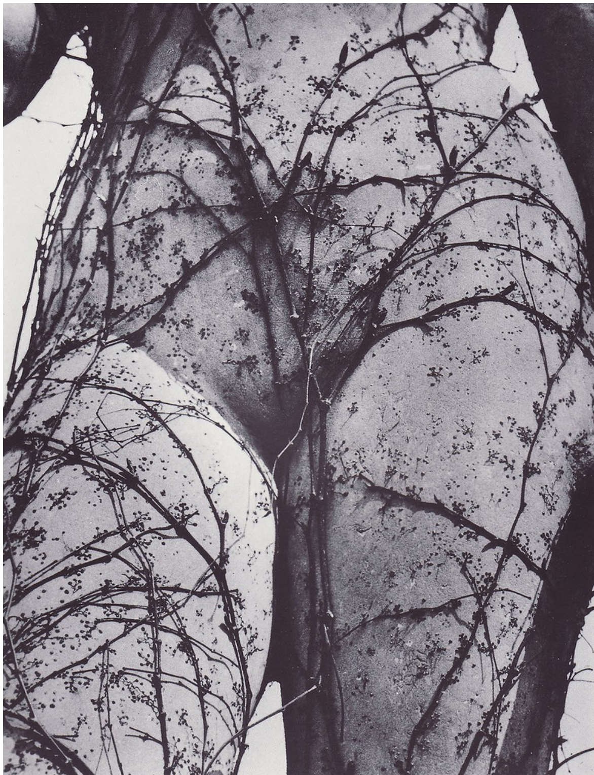
Vilém Reichmann, Osidla, z cyklu Opuštěná inspirace