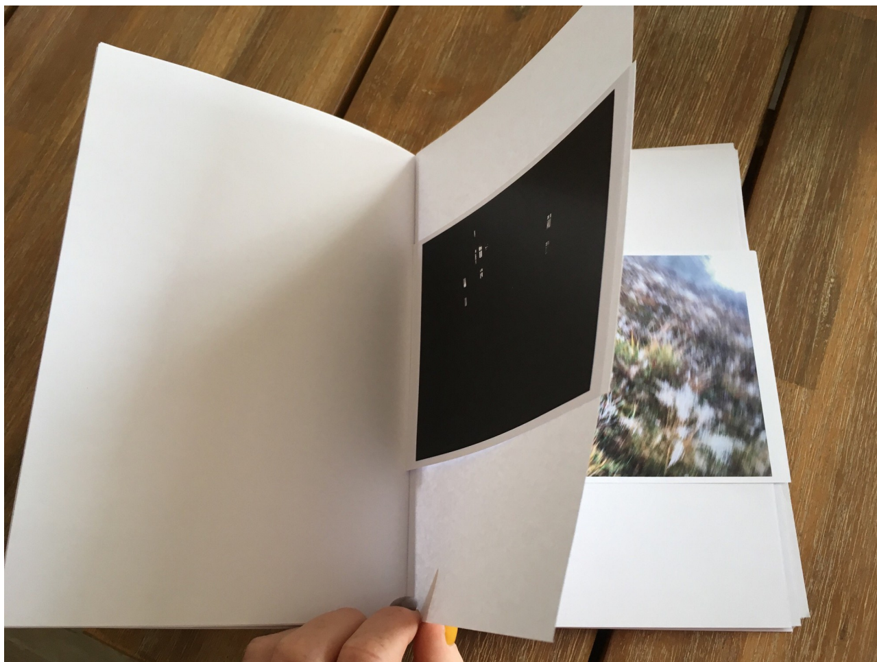
Maketa knihy