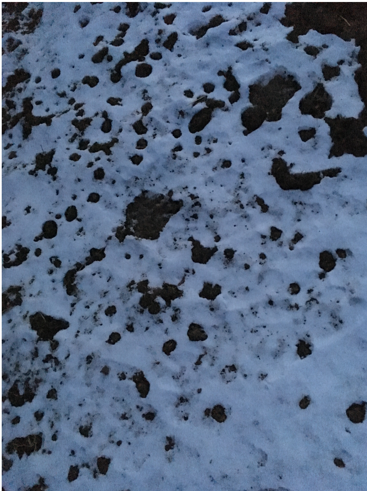
Nepoužitá fotografie