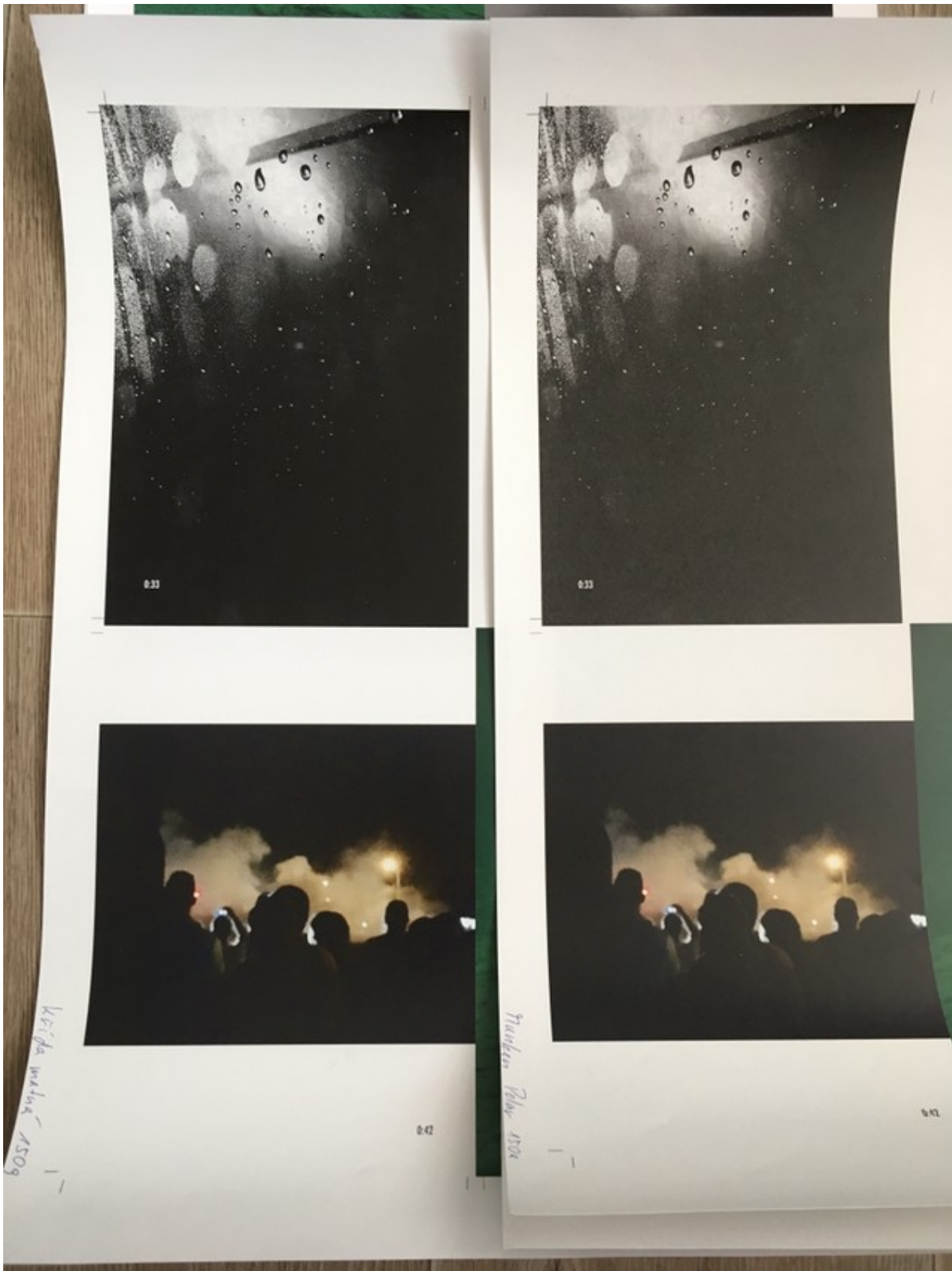
Zkušební tisky a výběr druhu papíru