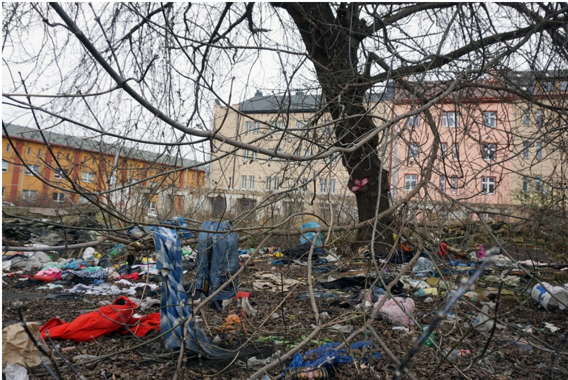
Obrázek 3 – prostory fabriky dnes