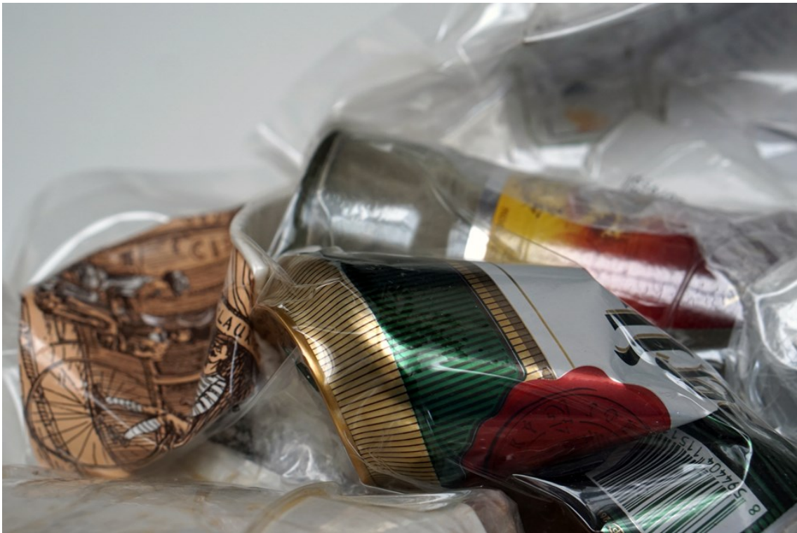
Obrázek 10 - kazety z odpadu