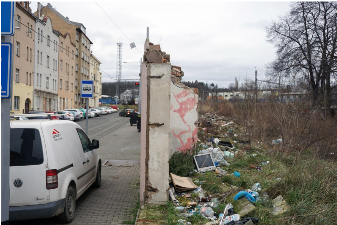
Obrázek 6 - prostory fabriky dnes