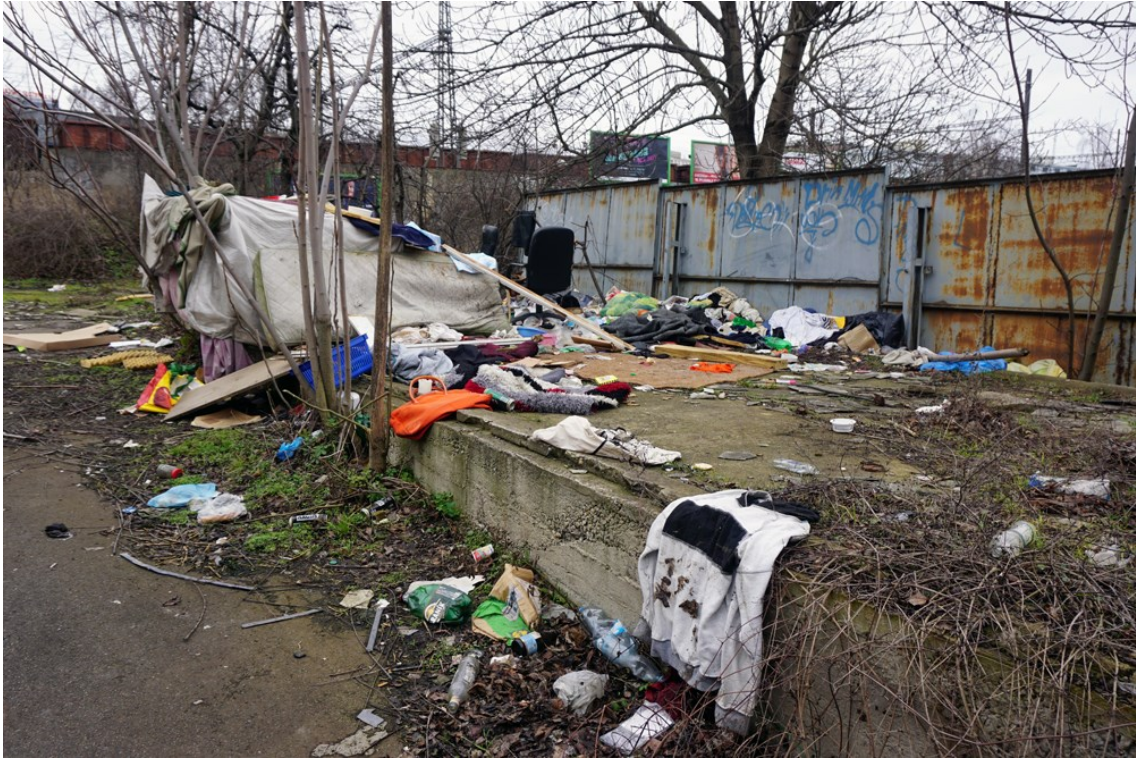
Obrázek 5 - prostory fabriky dnes