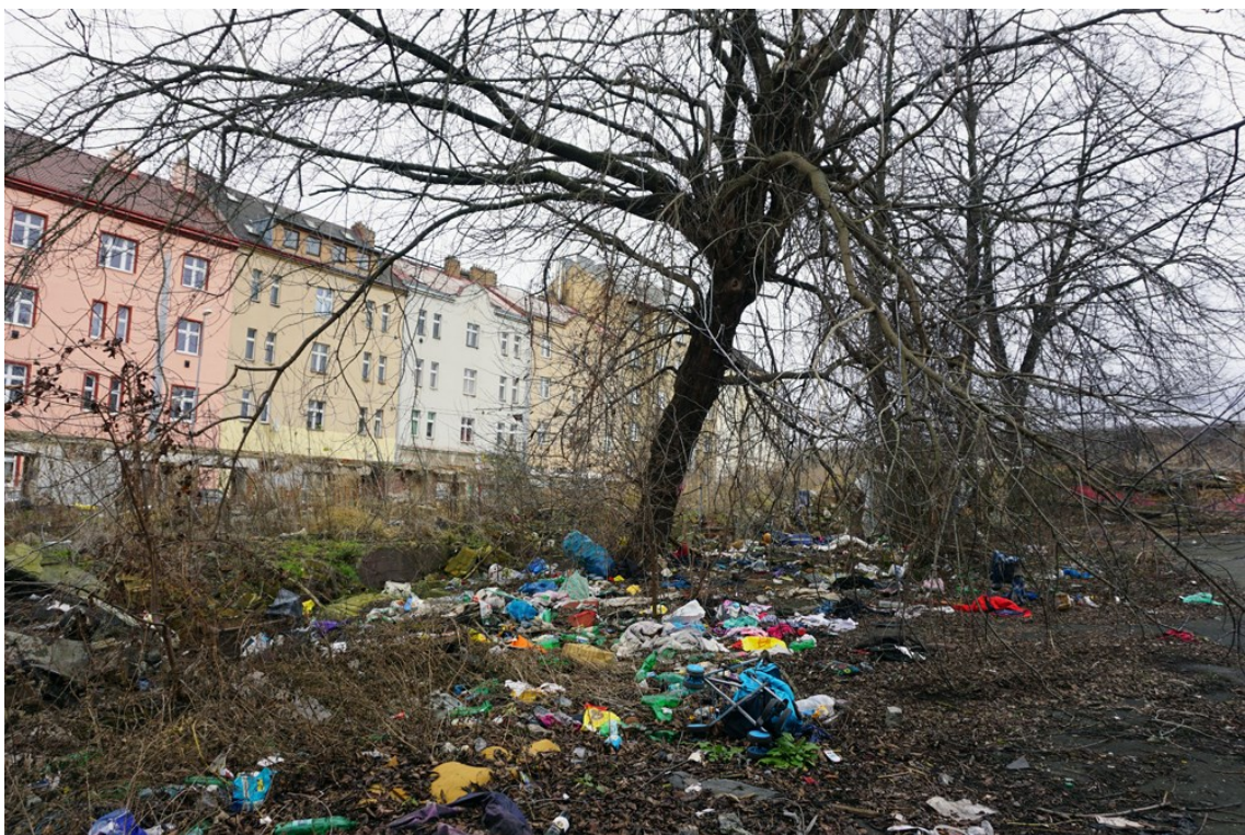
Obrázek 4 - prostory fabriky dnes