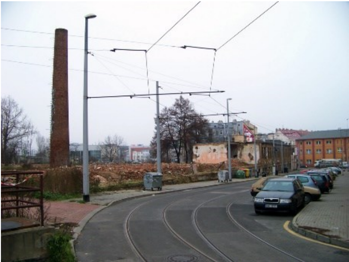
Obrázek 2 – torzo fabriky před demolicí