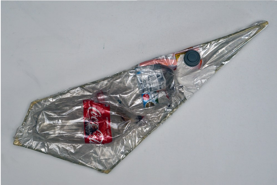
Obrázek 9 - kazety z odpadu