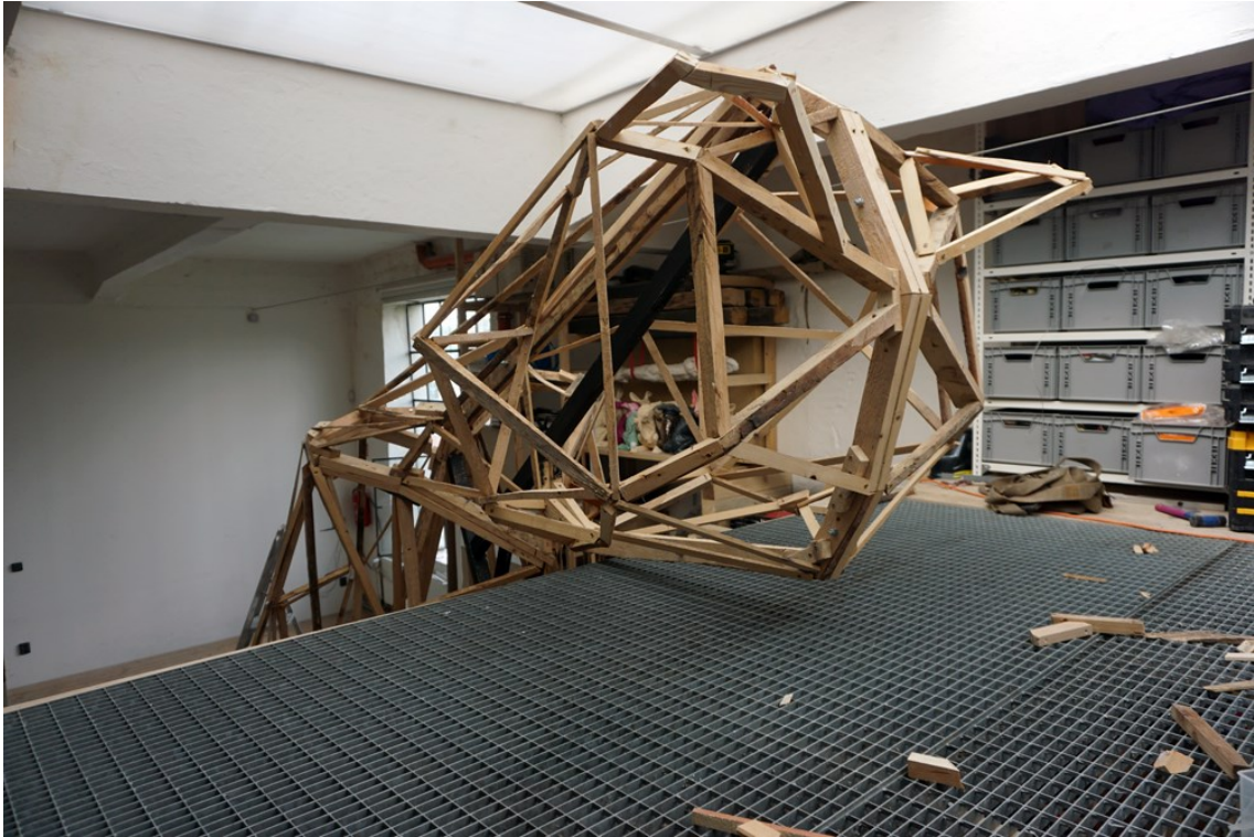
Obrázek 15 - konstrukce hračky