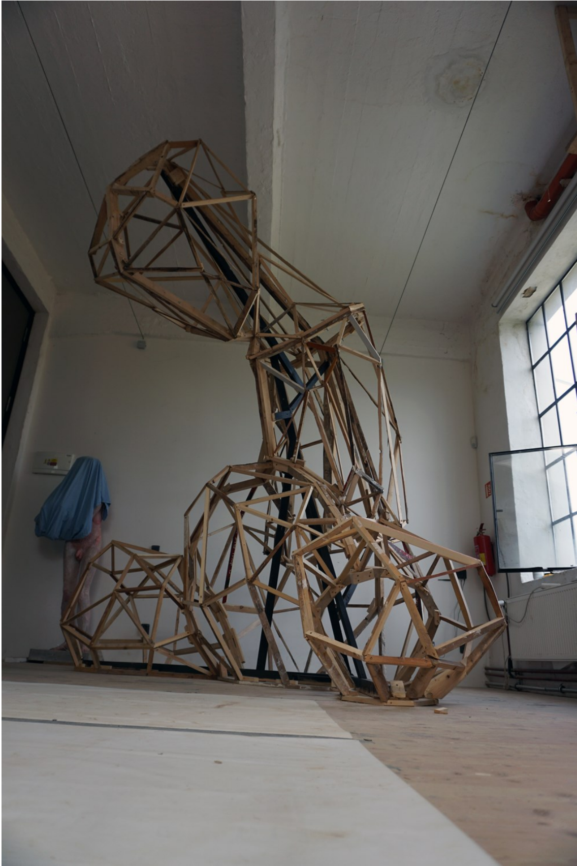
Obrázek 14 - konstrukce hračky