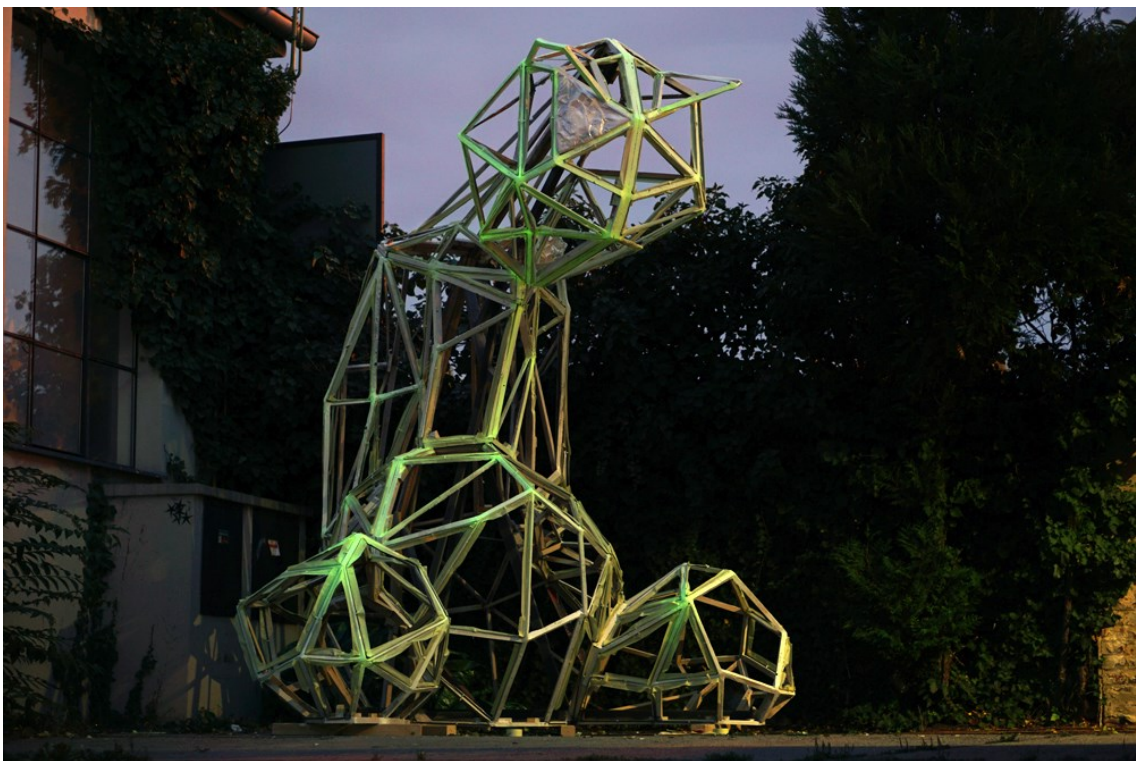
Obrázek 26 – fosforový nátěr