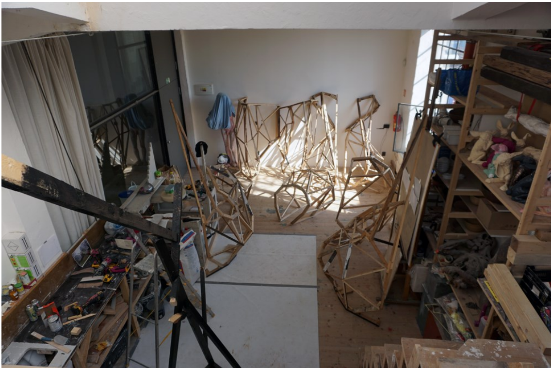
Obrázek 16 - konstrukce hračky