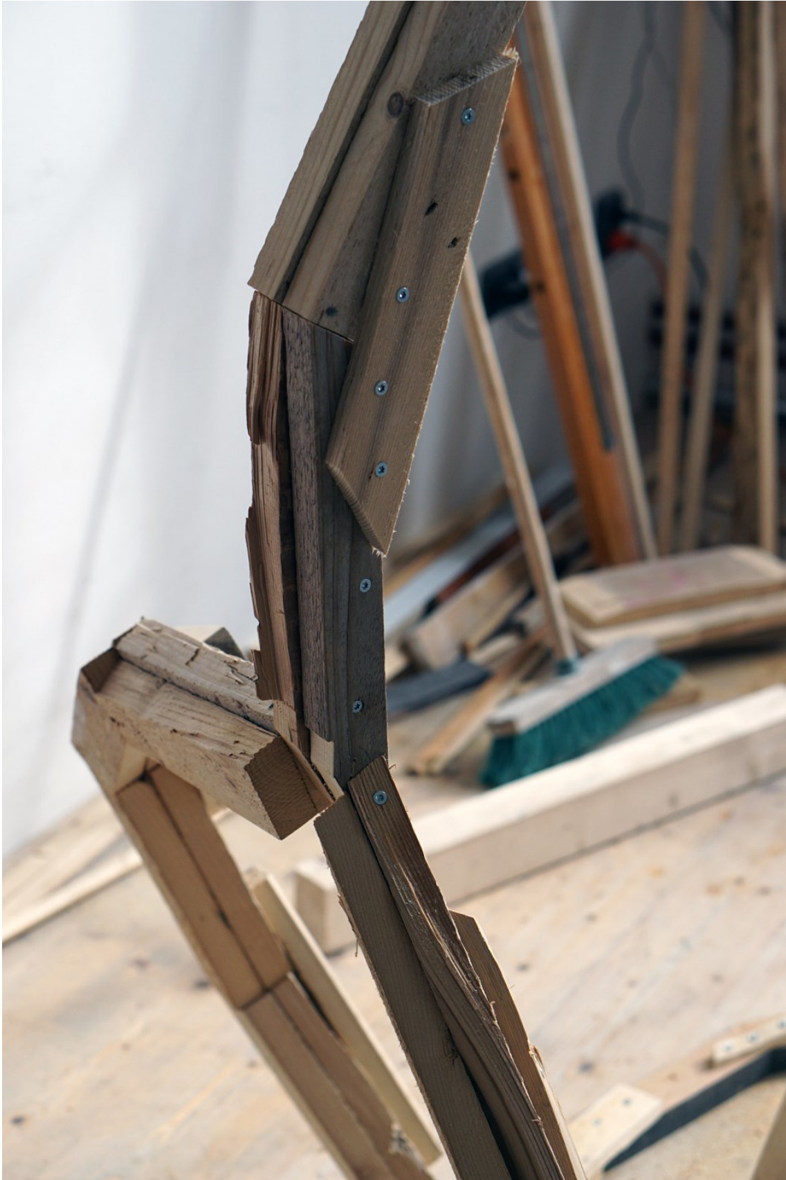
Obrázek 13 - konstrukce hračky