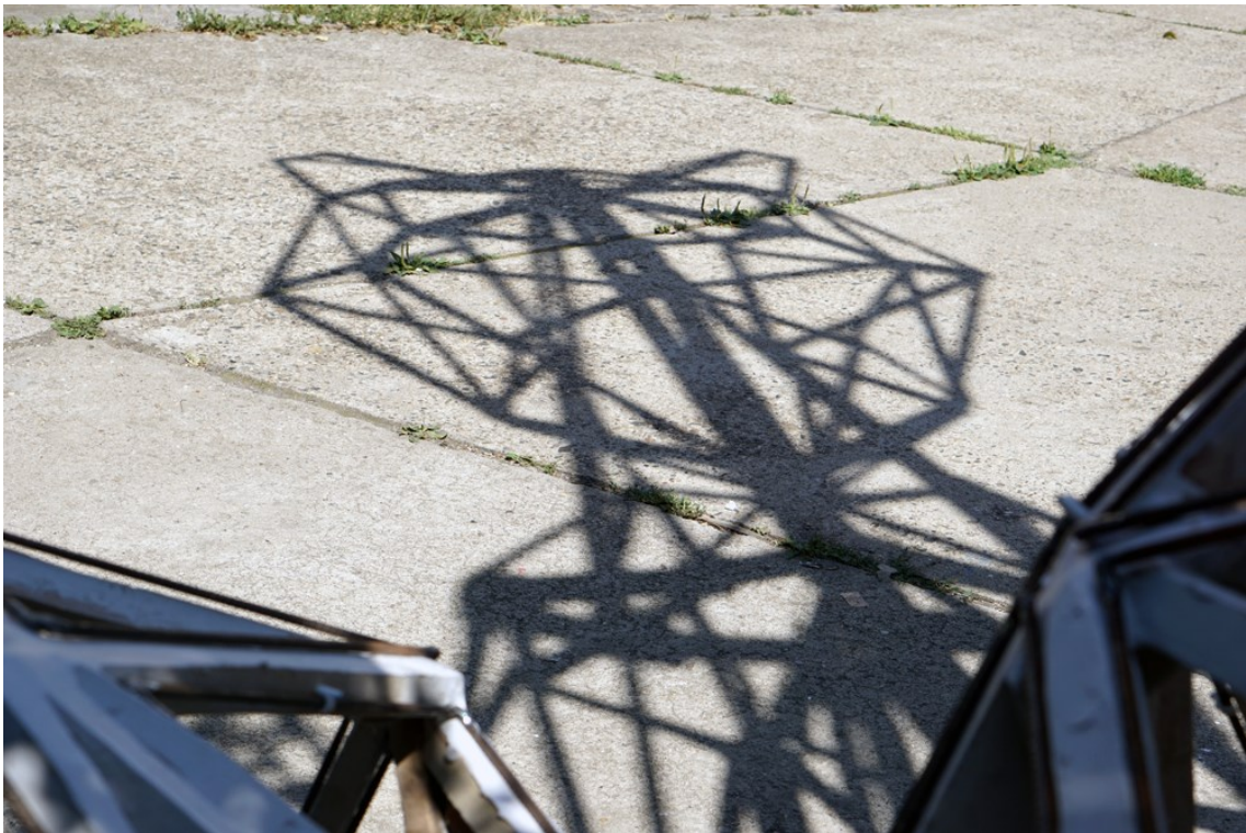
Obrázek 24 – detail, stín