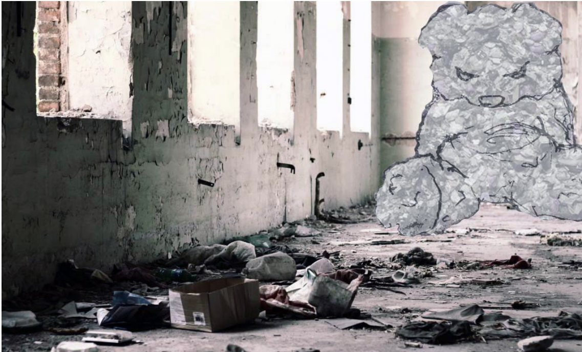
Obrázek 1 – první skica