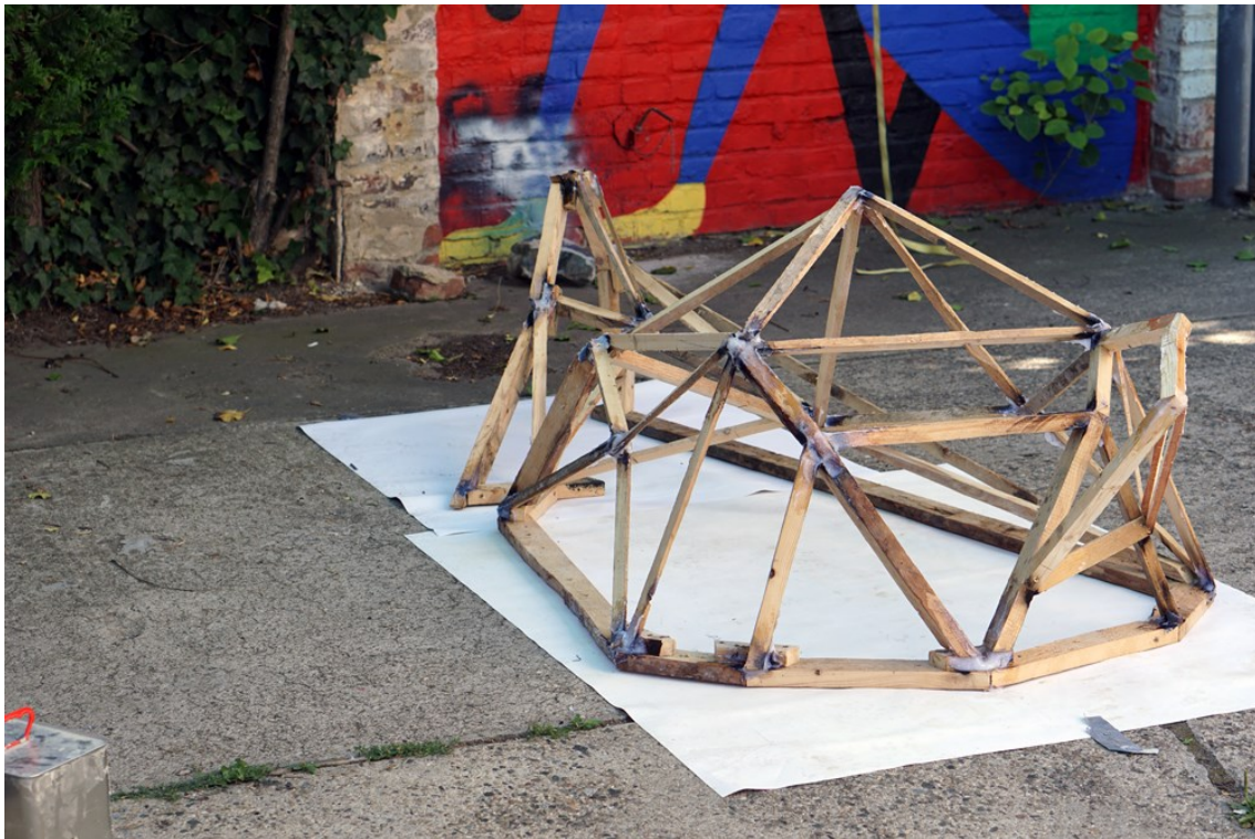
Obrázek 20 – epoxidové spoje