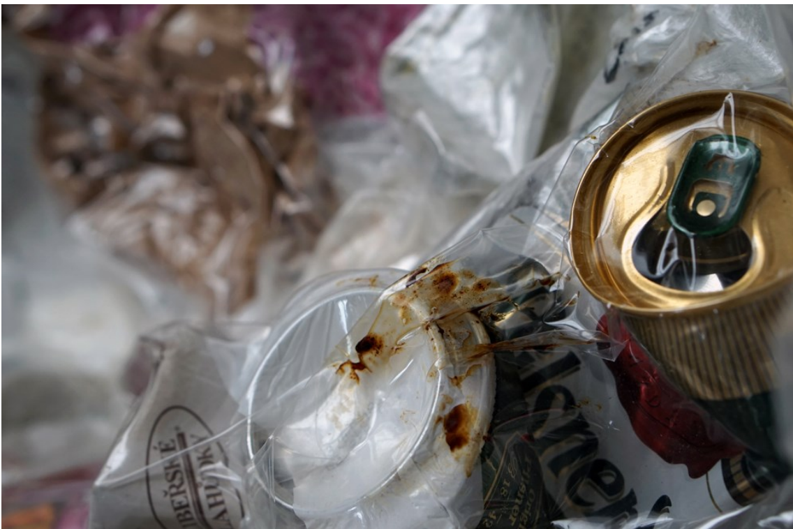
Obrázek 8 – kazety z odpadu