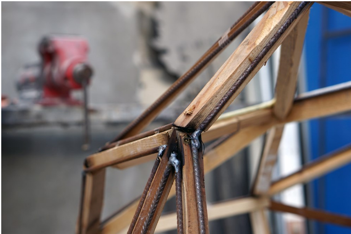
Obrázek 18 - vytváření kazet