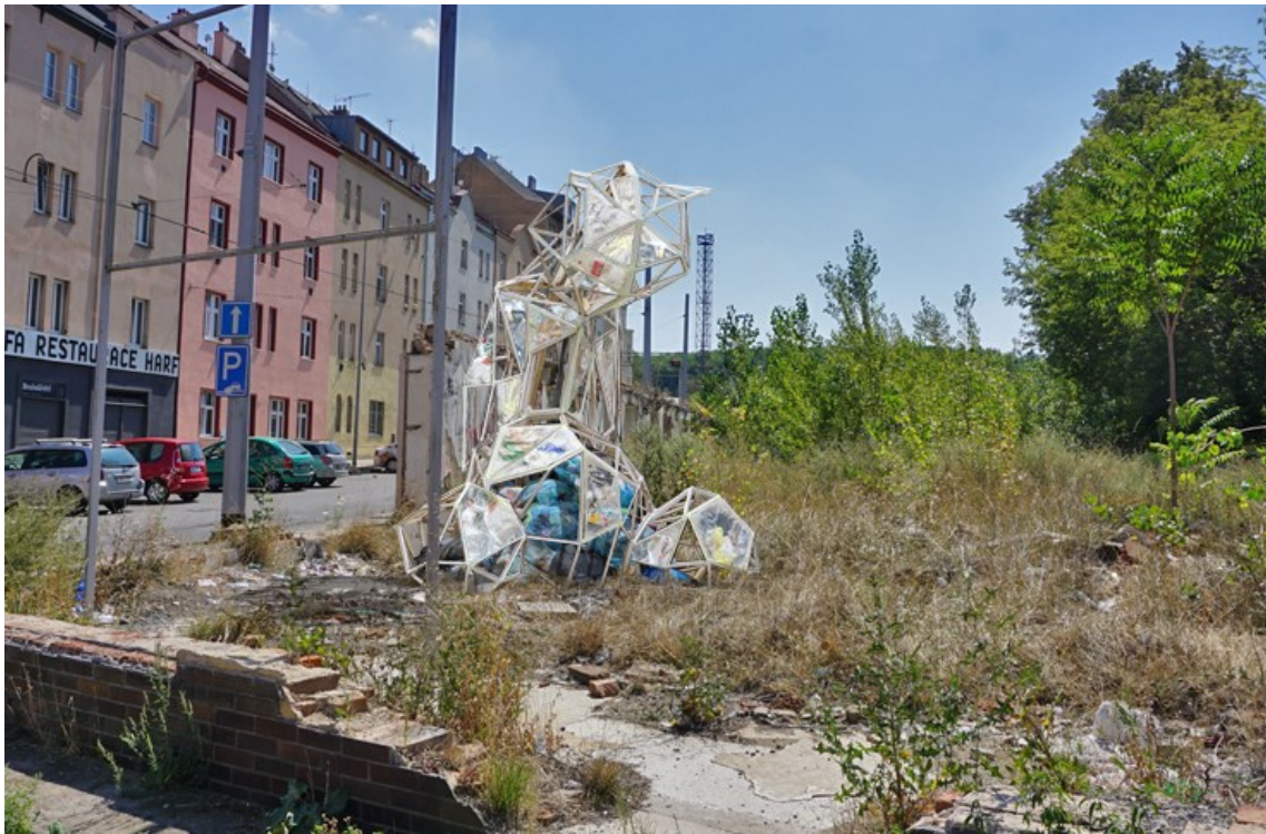
Obrázek 27 - umístění