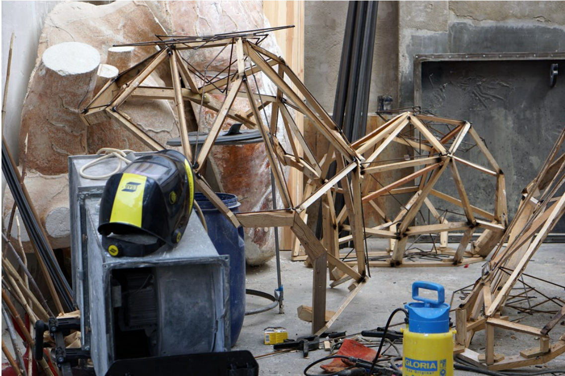
Obrázek 17 – vytváření kazet