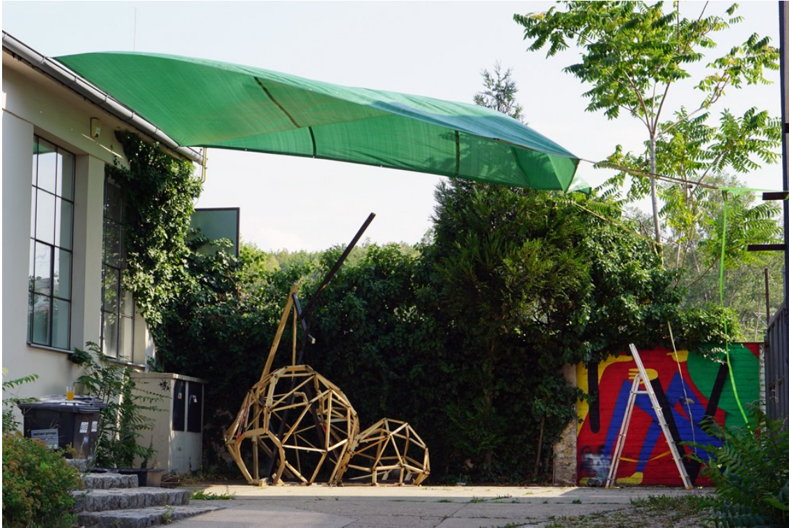
Obrázek 19 - sestavování