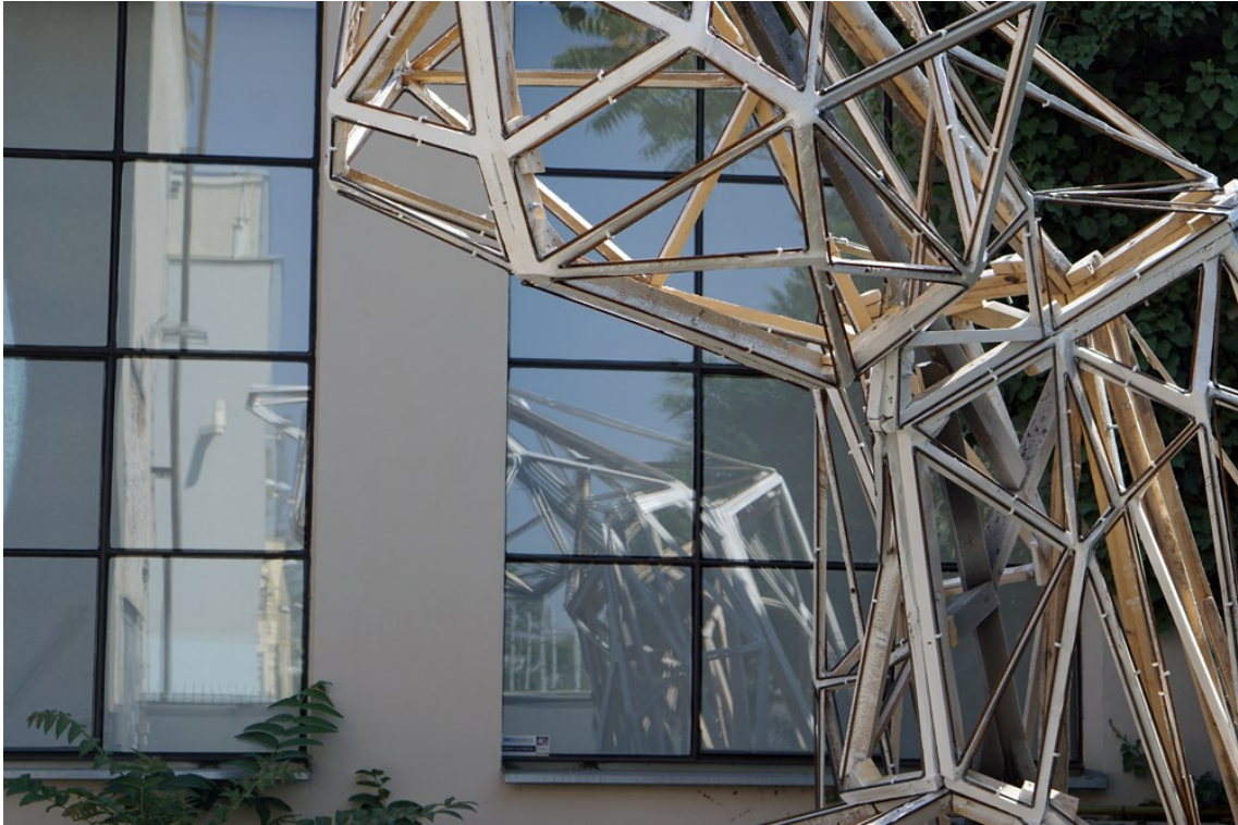
Obrázek 23 - kazetování