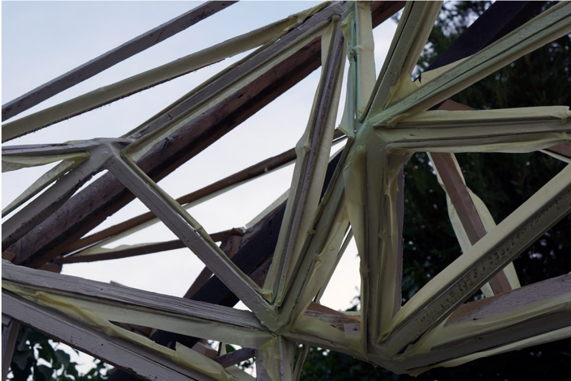
Obrázek 25 – příprava pro fosforový nátěr