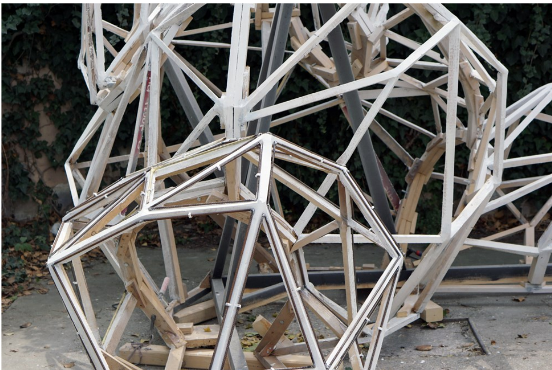
Obrázek 22 - kazetování