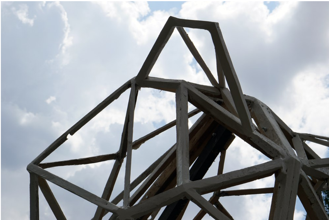
Obrázek 21 – sjednocení barevnosti