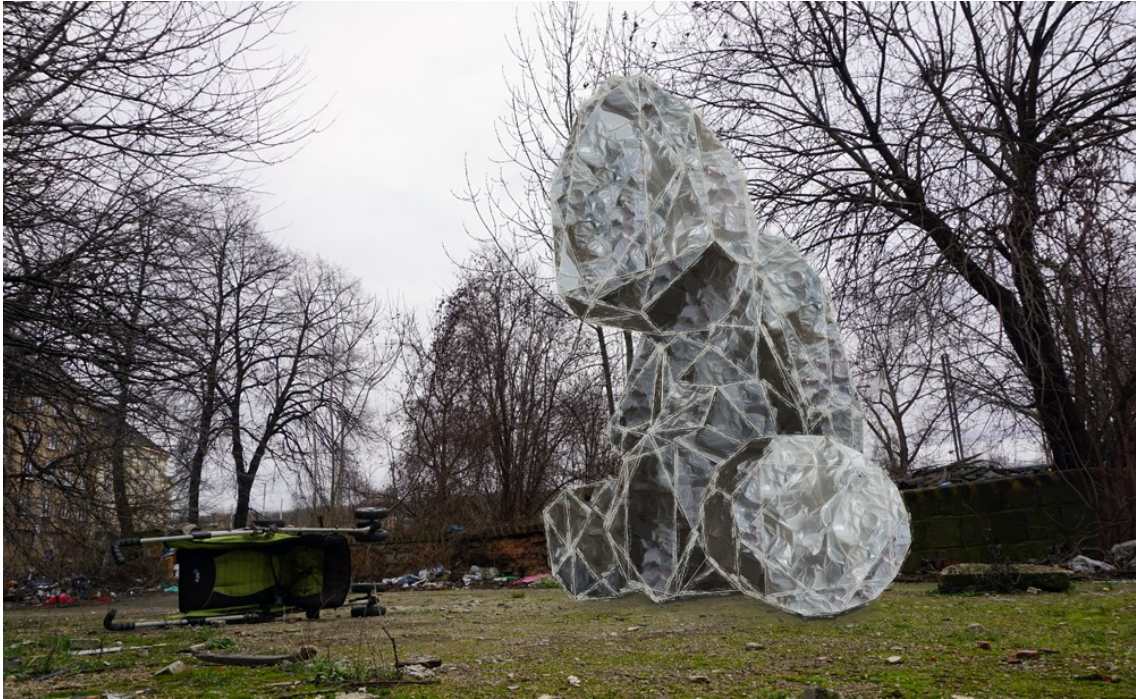
Obrázek 7 – druhá skica