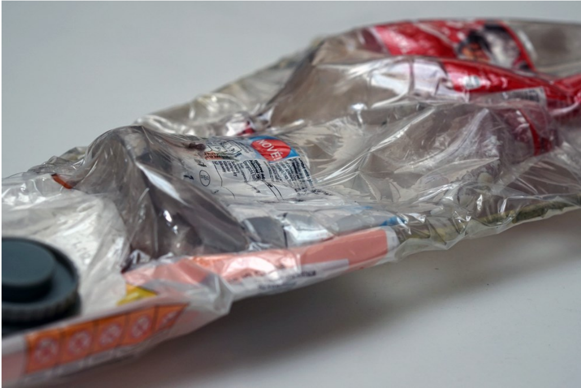
Obrázek 11 - kazety z odpadu