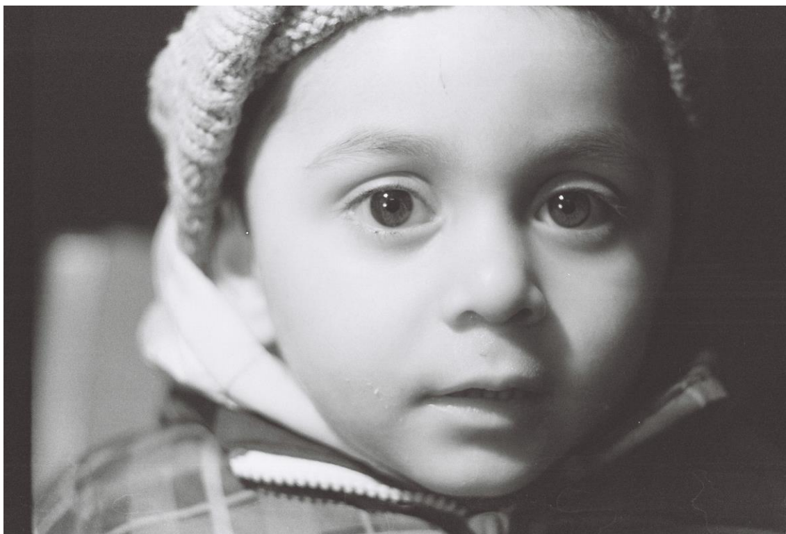
Príloha č.16, tehelná bwportret