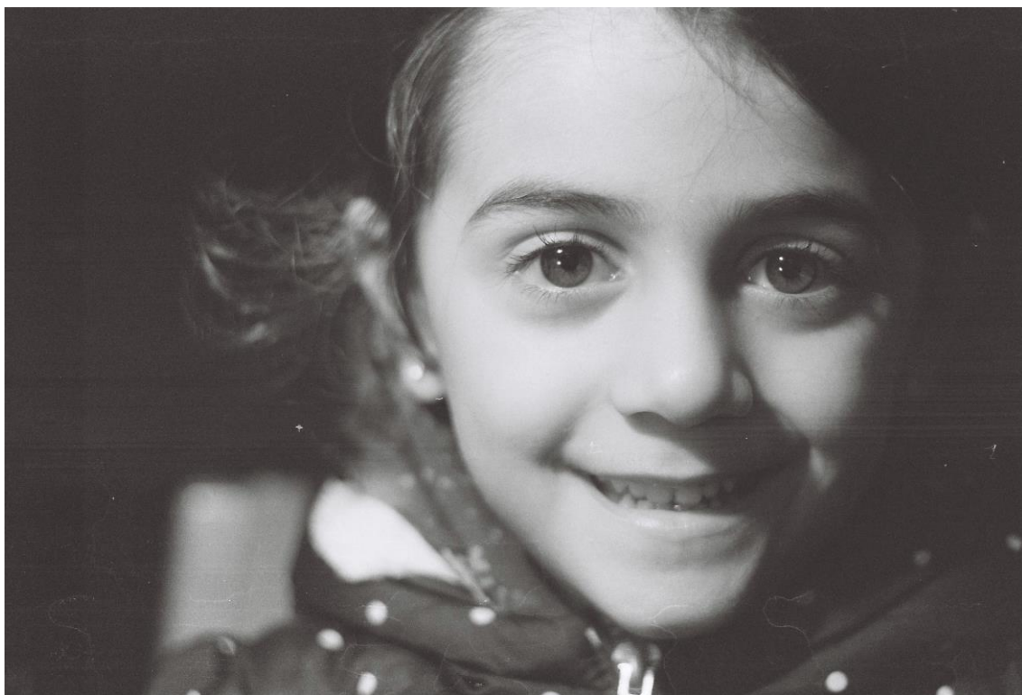
Príloha č.18, tehelňa bwportret