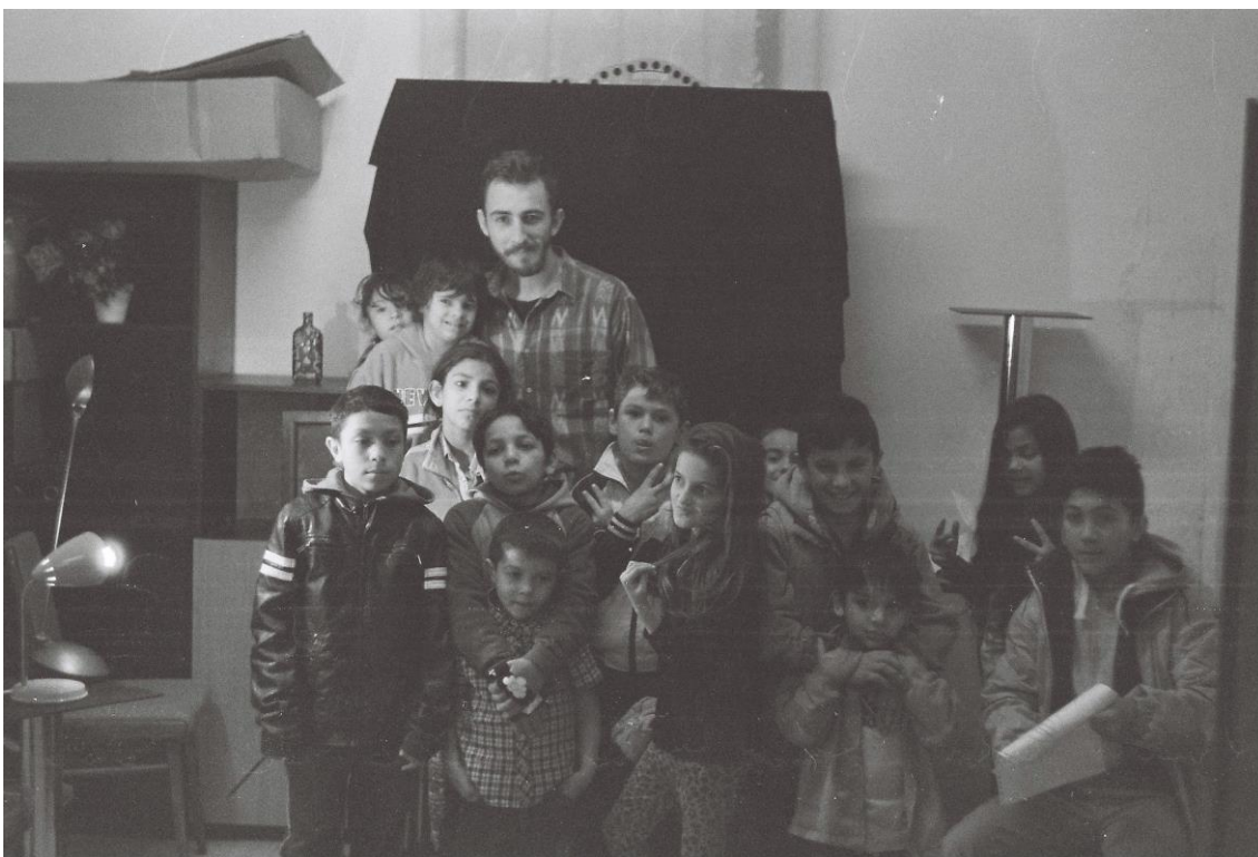
Príloha č.14, tehelná bwportret