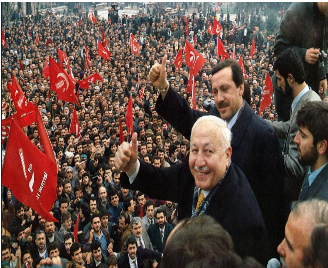
Obrázek 1.: Necmettin Erbakan a Recep Tayyip Erdoğan – předvolební kampaň Refah Partisi