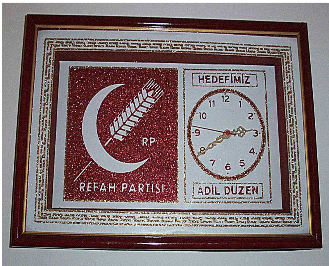
Obrázek 2.: Symbol Refah Partisi spolu se sloganem hlásajícím: “Spravedlivý řád jen naším cílem“.