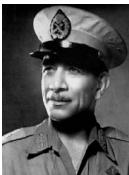
Muhammad Naguib 120