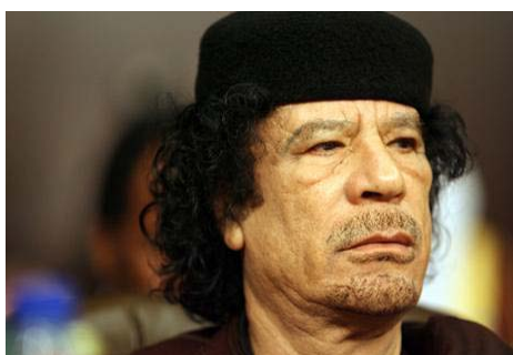
Muammar Gaddafi 137