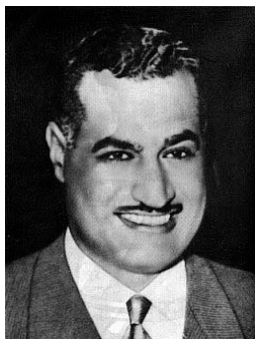
Gamal Abd al-Nasser 117