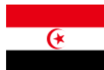
vlajka Arabské islámské republiky 140