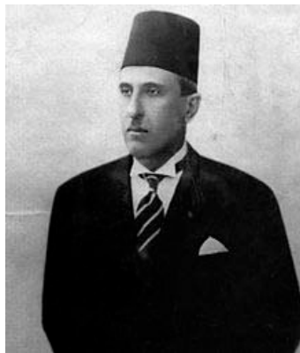
Shukri al-Quwatli 128