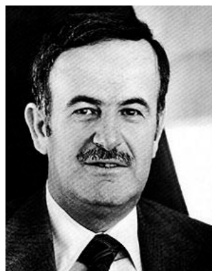
Hafiz al-Asad 138