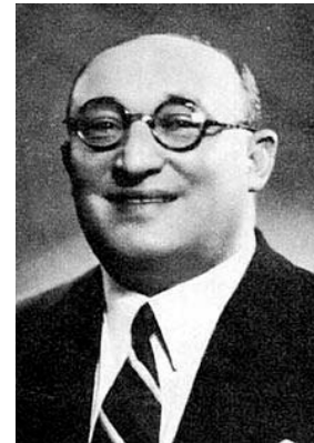
Sabri al-Asali 129