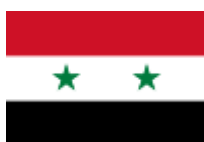
vlajka Sjednocené arabské republiky 126