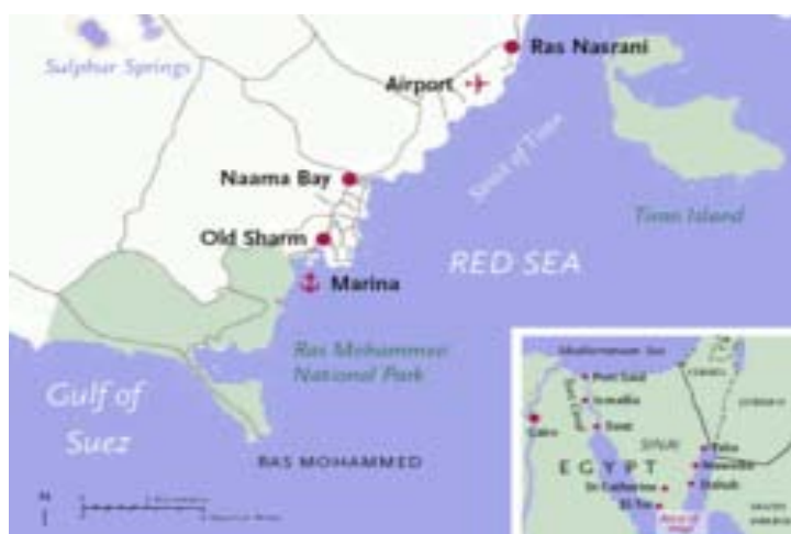
Tiranská úžina 124