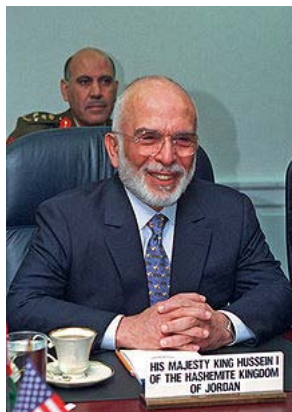
Husain I. 134