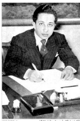
Faisal II. 133