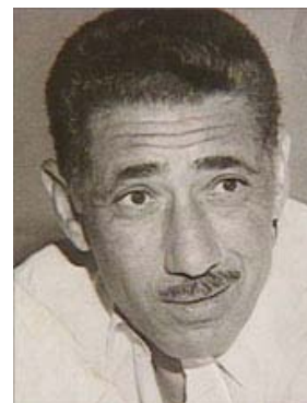
Abd al-Hakim Amr 122