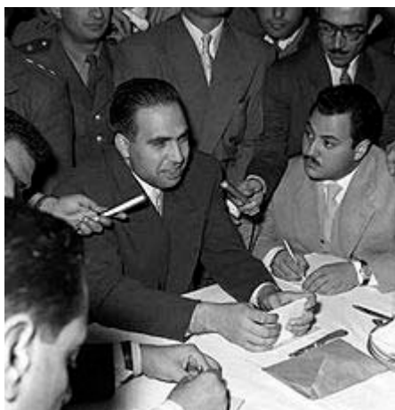
Abd al-Hamid Sarraj 130