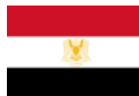
vlajka Federace arabských republik 136