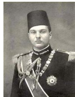
král Farúq 119