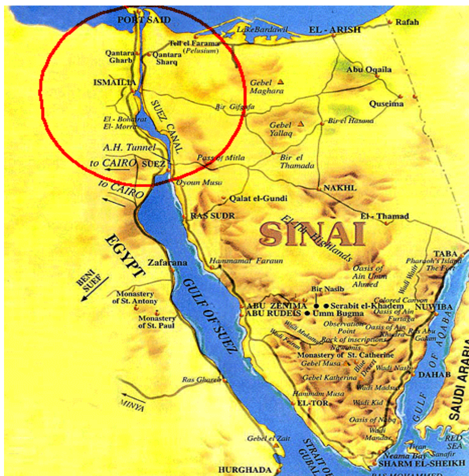
Suezský kanál 123