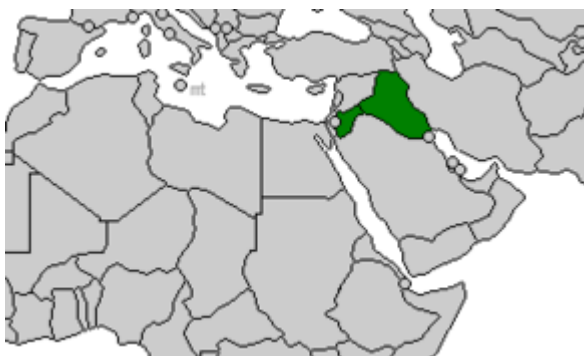
Arabská federace 131