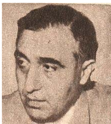
Salah ad-Din Bitar 127