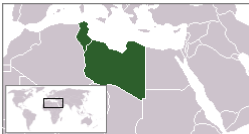
Arabská islámská republika 139