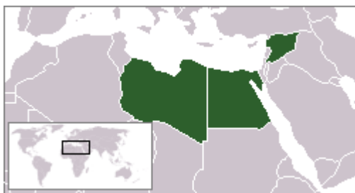
Federace arabských republik 135