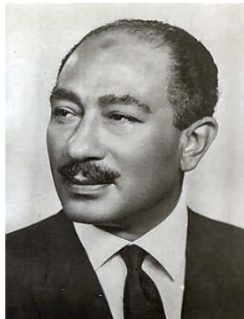
Anwar as-Sadat 121