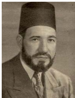
Hasan al-Banna 118