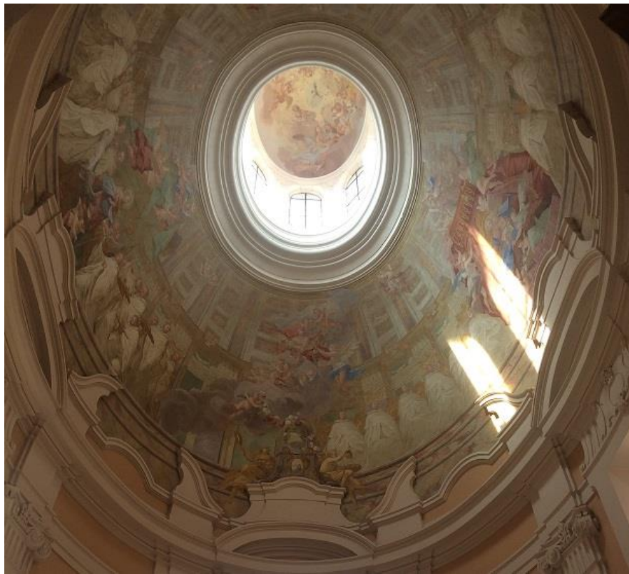
Příloha č. 8. Lucerna kapitulní síně. Foto autorka, 2019.