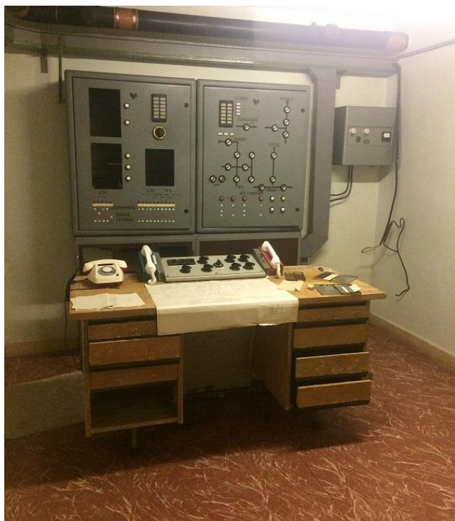
Přílohy č. 5 a 6. Interiér krytu. Foto autorka, 2019.