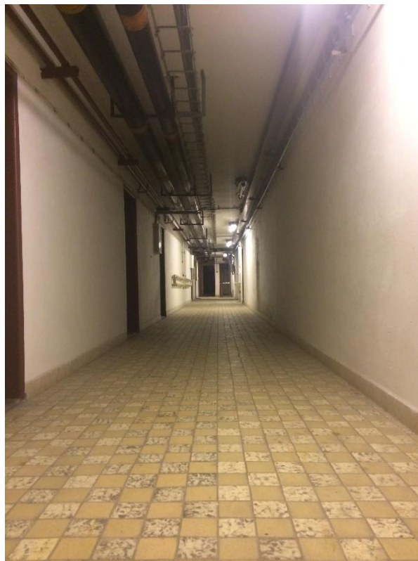
Příloha č. 4. Kryt civilní obrany zbudovaný pod budovou prelatury v roce 1963. Foto autorka, 2019.