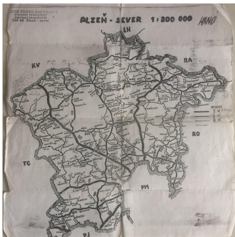
Příloha č. 1. Mapa prodejen v Plzeňském kraji odebírajících nápoje z plaské sodovkárny. Originál uložený v osobním archivu paní Štruncové.