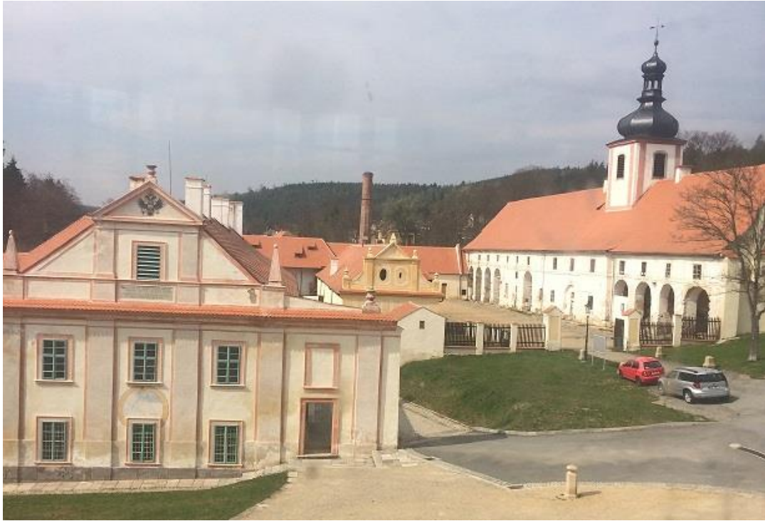
Příloha č. 7. Současný stav hospodářských budov. Vpravo věž sv. Floriána, vlevo štít s motivem habsburské orlice.