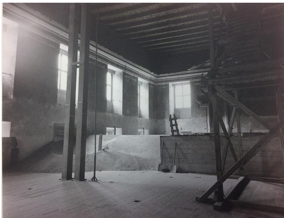
Příloha č. 2. Letní refektář konventu zachycený v roce 1969.