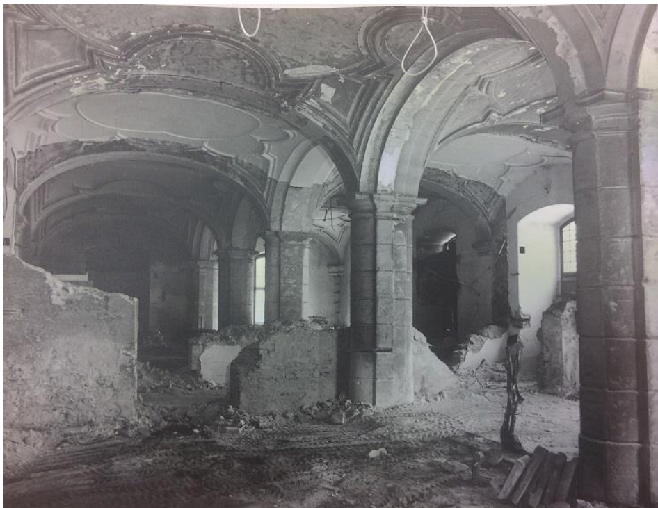
Příloha č. 10. Prostory zimního refektáře v konventu v roce 1994.