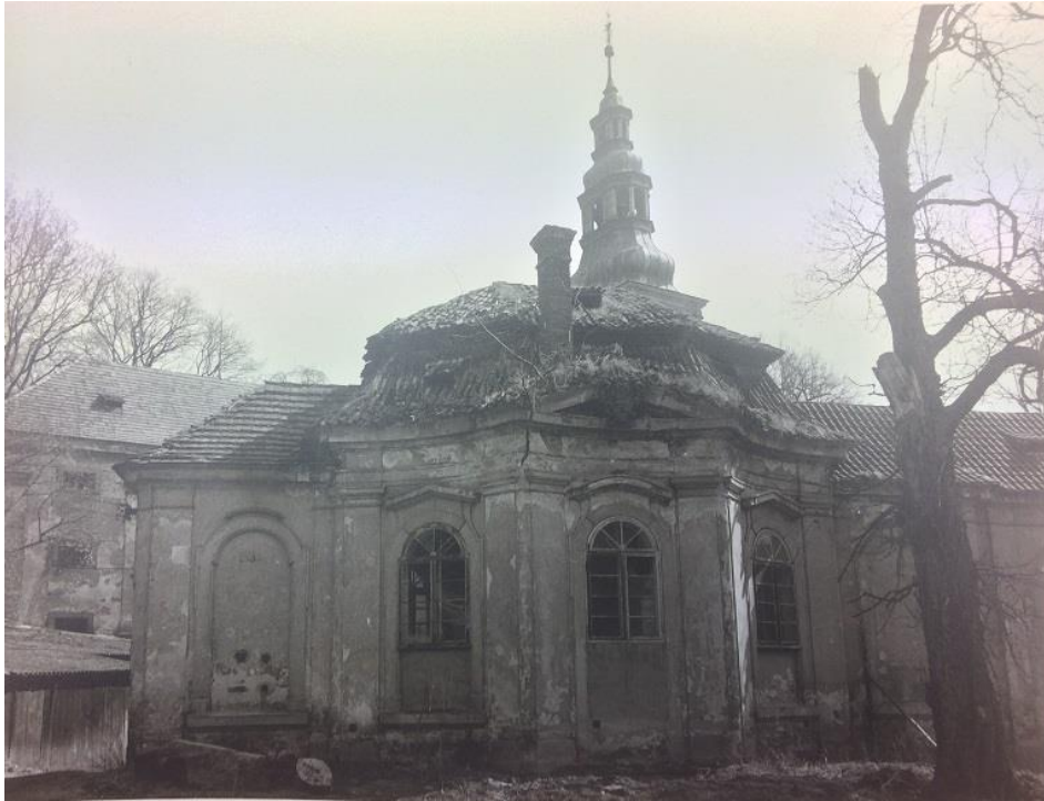
Příloha č. 9. Stav bývalé sala terreny zachycený v roce 1990. SOkA Plasy, f. MěstNV, Fotografie areálu kláštera, Jan Gryc 1990, nezpracováno, veřejnosti nepřístupné.