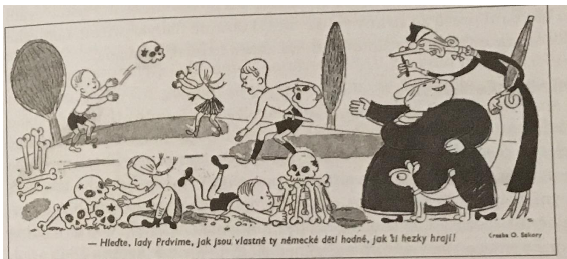
Obr. 43/ Ilustrace z časopisu „Dikobraz“ z 29. srpna 1945. Podle komentáře k obrázku snad bylo cílem zesměšnit kritiky zacházení s německým obyvatelstvem v Československu, kteří měli prokazovat neznalost skutečné „německé povahy“ (v daném případě i děti).