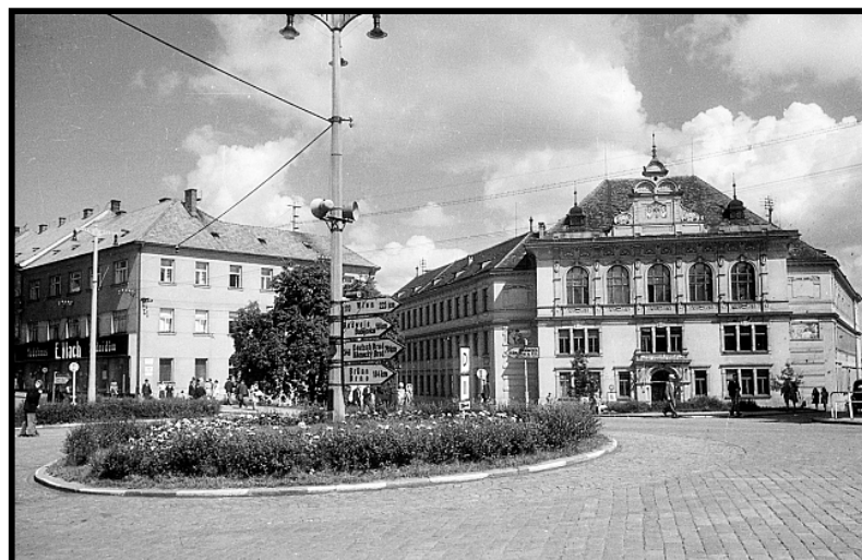
Obr. 2: Budova reálky (reálného gymnázia) na Riegrově náměstí v roce 1939