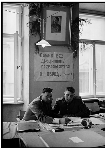
Obr. 7: Sověští vojáci na hlavním velitelství v budově gymnázia na Riegrově náměstí