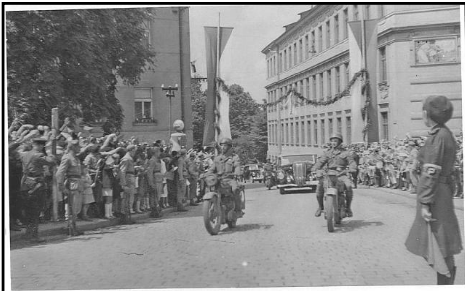
Obr. 6: Příjezd prezidenta Edvarda Beneše do Tábora v roce 1945