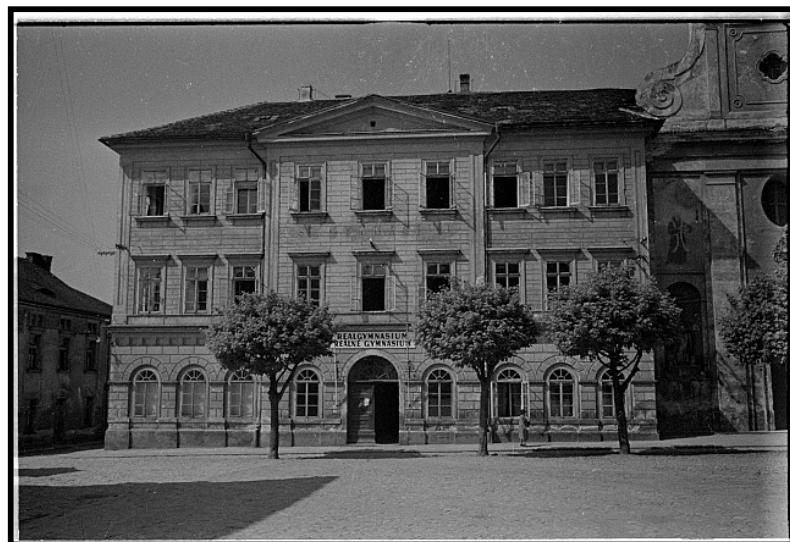
Obr. 1: Budova gymnázia na Klášterním náměstí v roce 1939