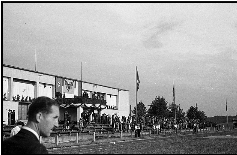
Obr. 3: Cvičení Kuratoria na tábořském stadionu