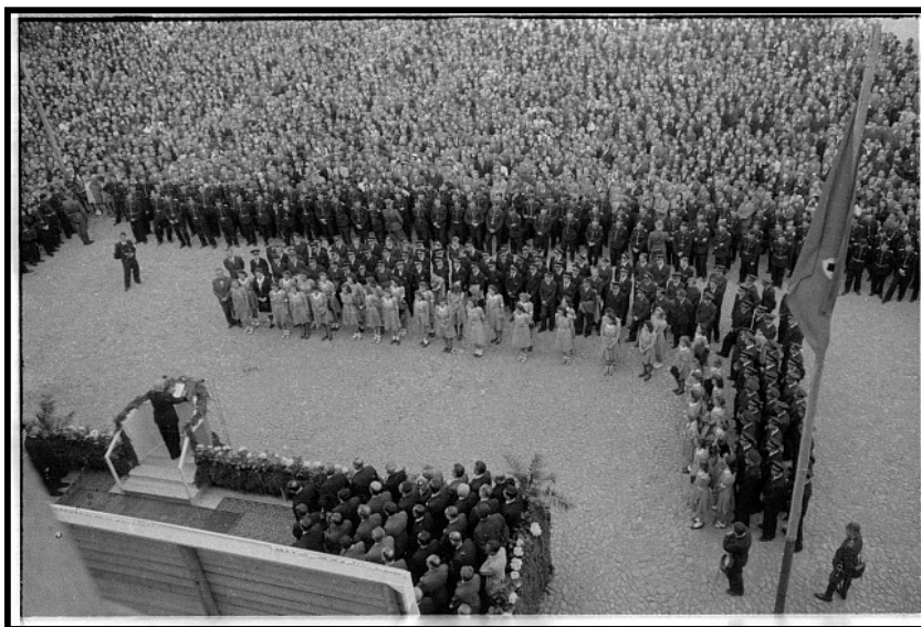
Obr. 4: Manifestace v Táboře 20. června 1942