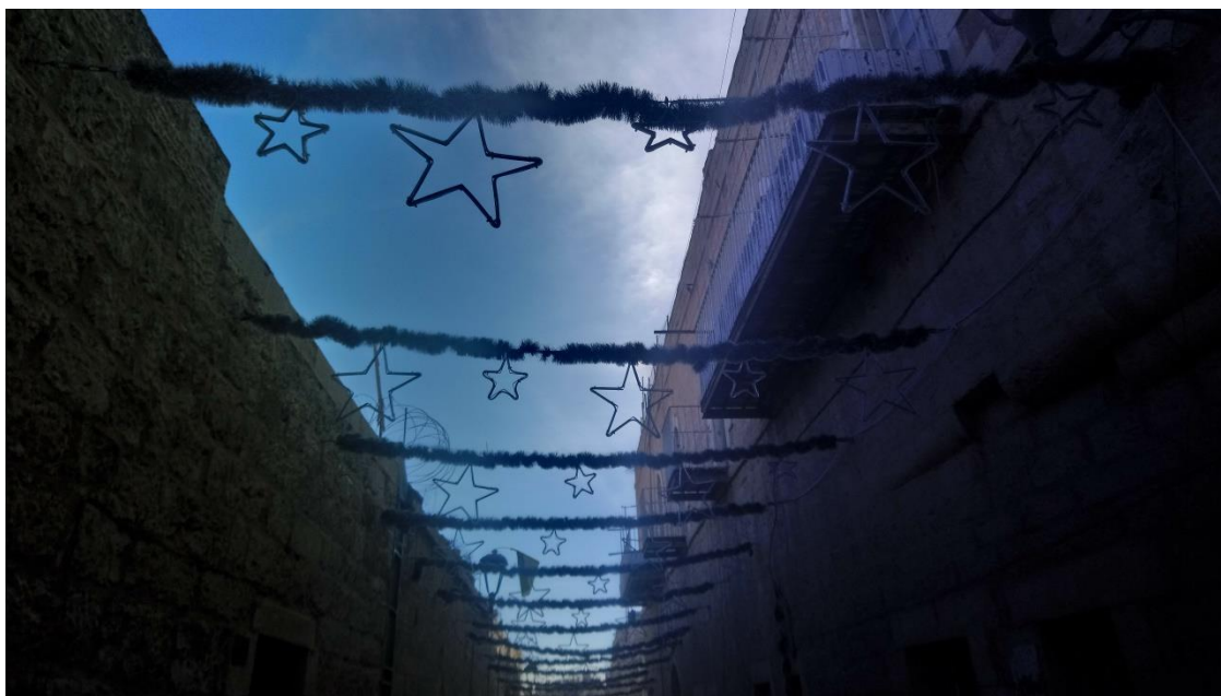
Příloha č. 5 – vánoční výzdoba v Hvězdné ulici (Autor: Pavlína Adámková, Betlém, listopad 2018)