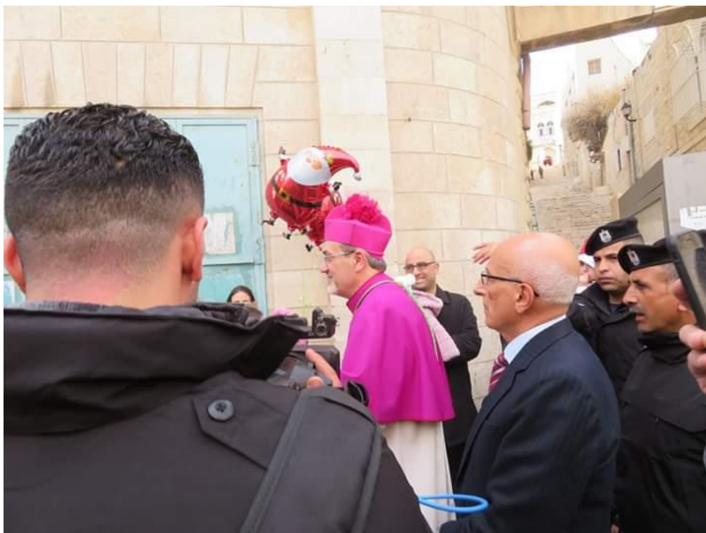
Příloha č. 11 – průvod jeruzalémského katolického patriarchy (Autor: Giselle Lawm, Betlém, prosinec 2018)