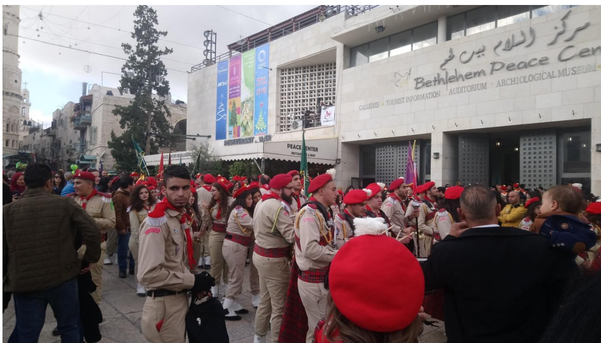
Příloha č. 12 – průvod skautů (Autor: Pavlína Adámková, Betlém, prosinec 2018)