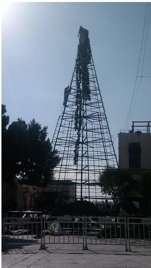
Příloha č. 3 – přípravy stromečku (Autor: Pavlína Adámková, Betlém, listopad 2018)