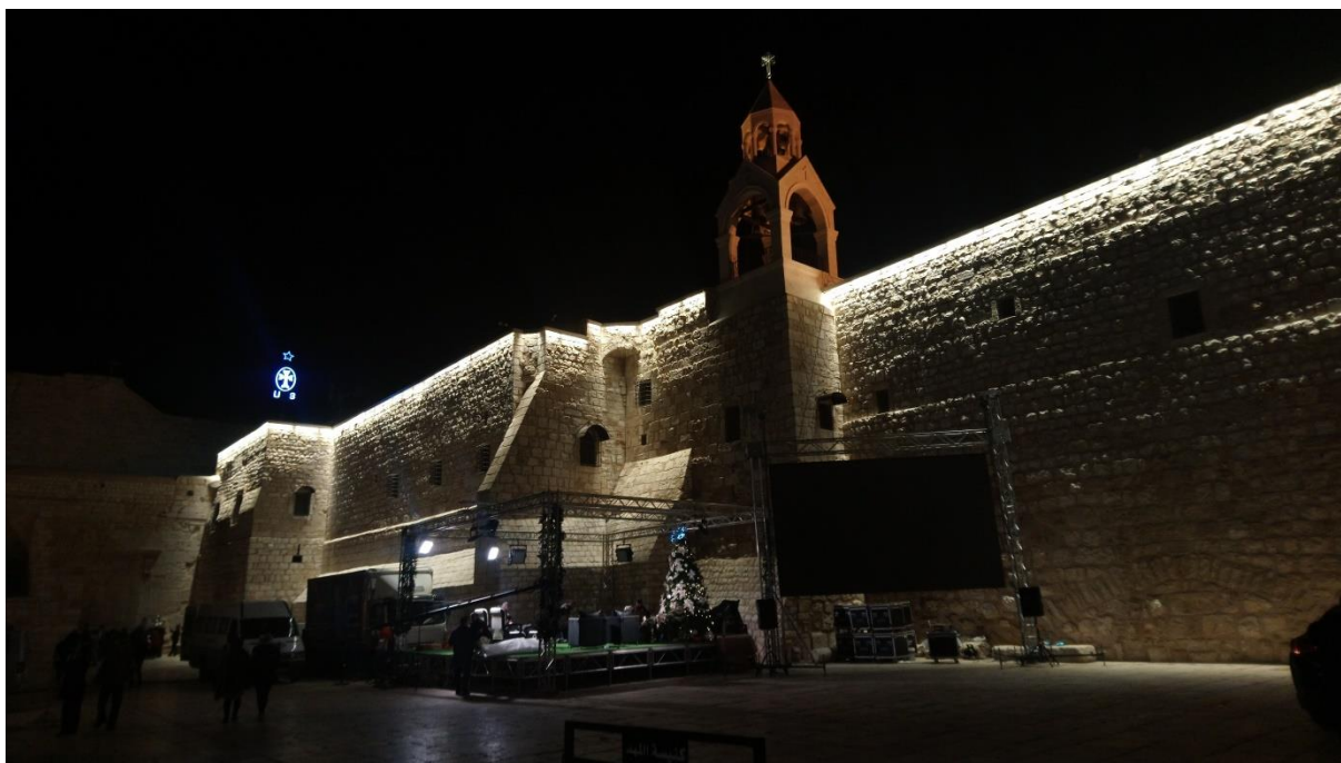
Příloha č. 13 – Chrám Narození Páně (Autor: Pavlína Adámková, Betlém, prosinec 2018)