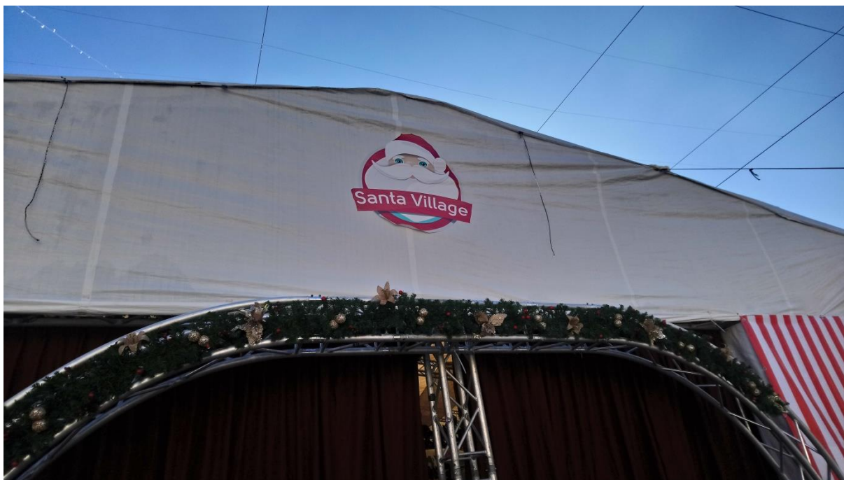
Příloha č. 9 – Santova vesnice (Autor: Pavlína Adámková, Betlém, prosinec 2018)