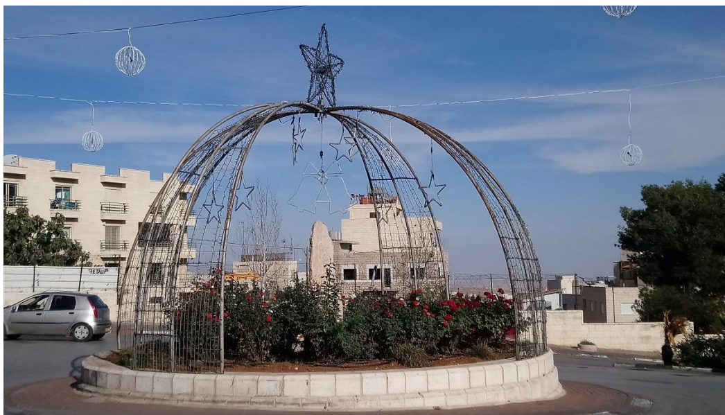
Příloha č. 4 – vánoční výzdoba kruhový objezd (Autor: Pavlína Adámková, listopad 2018)