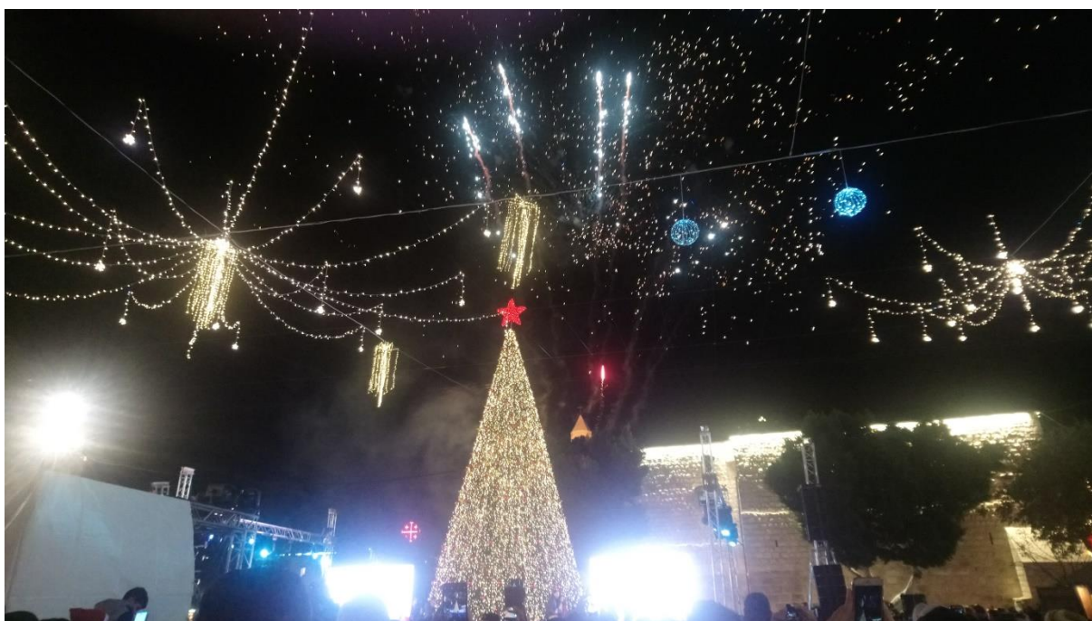
Příloha č. 6 – slavnostní rozsvícení stromečku (Autor: Pavlína Adámková, Betlém, prosinec 2018)