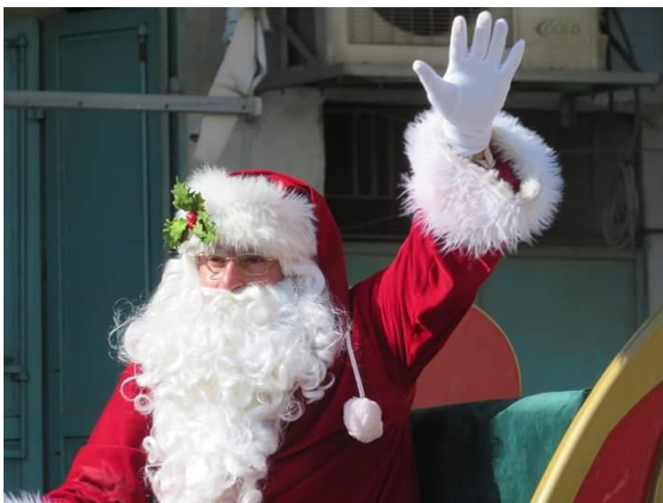
Příloha č. 10 – Santa Claus (Autor: Giselle Lawm, Betlém, prosinec 2018)