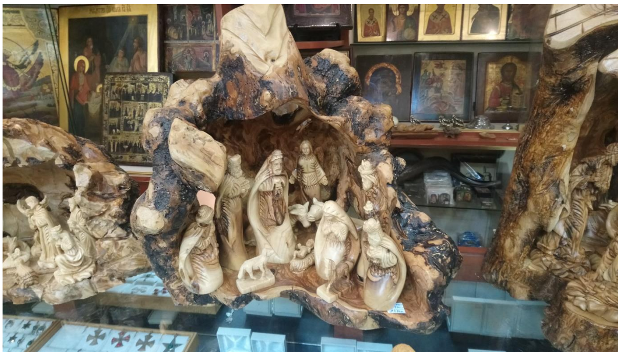
Příloha č.7 – ručně vyřezávaný betlém z olivového dřeva (Autor: Pavlína Adámková, Betlém, prosinec 2018)