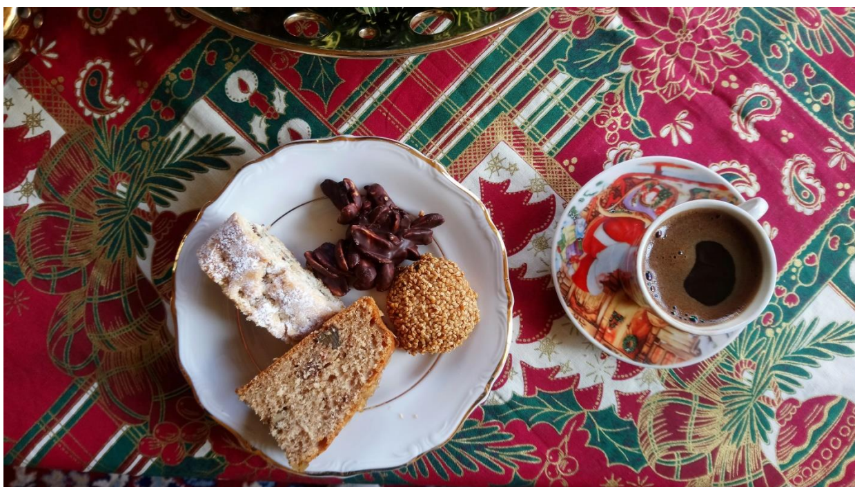
Příloha č. 8 – tradiční sladkosti pečené na Vánoce (Autor: Pavlína Adámková, Betlém, prosinec 2018)