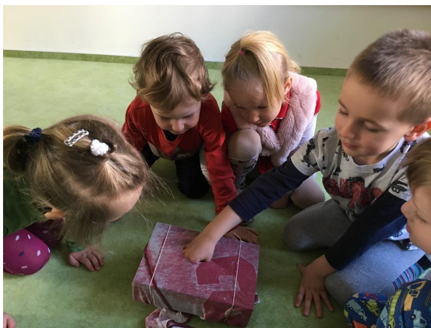
Obrázek 21 - Sběr žížal a červů

V závěru diskuze jsme se dostali k samotné pohádce a k tomu, co vlastně udělali lidé z kmene uličníků. Následně byla dětem položena otázka týkající se libosti/nelibosti schovávání nádob v momentě, kdy měly žízeň a chtěly se napít. Většina dětí tuto aktivitu brala jen jako hru, která je bavila. Za zábavu považovaly schovávání i hledání. Pomocí doplňujících otázek jsme však došli k závěru, že kdybychom byli na místě uličníka, asi by se nám to moc nelíbilo. Také mi však bylo sděleno, že si za to uličník mohl sám, protože nepomáhal s nošením vody. Kdyby pomáhal, tak by mu vodu určitě neschovávaly.