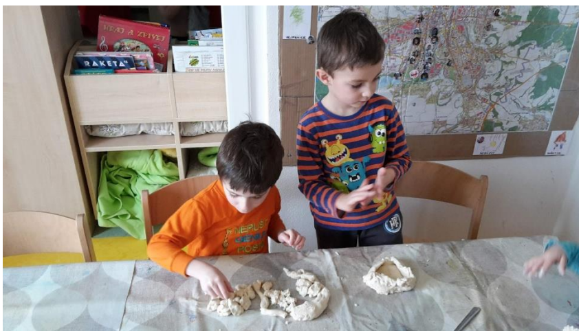
Obrázek 20 - Modelování nádob na vodu

Práce s modelínou či slaným těstem dětem umožňuje rozvíjet nejen svou kreativitu a fantazii, ale také hmat a výtvarné technické dovednosti. Tento druh práce je nezbytnou součástí výtvarných, či pracovních hodin v MŠ.