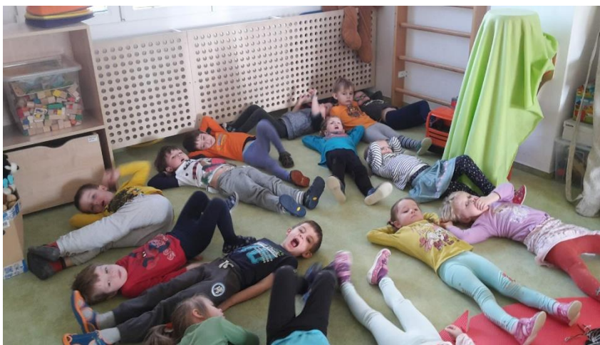
Obrázek 22 - Zívající uličníci