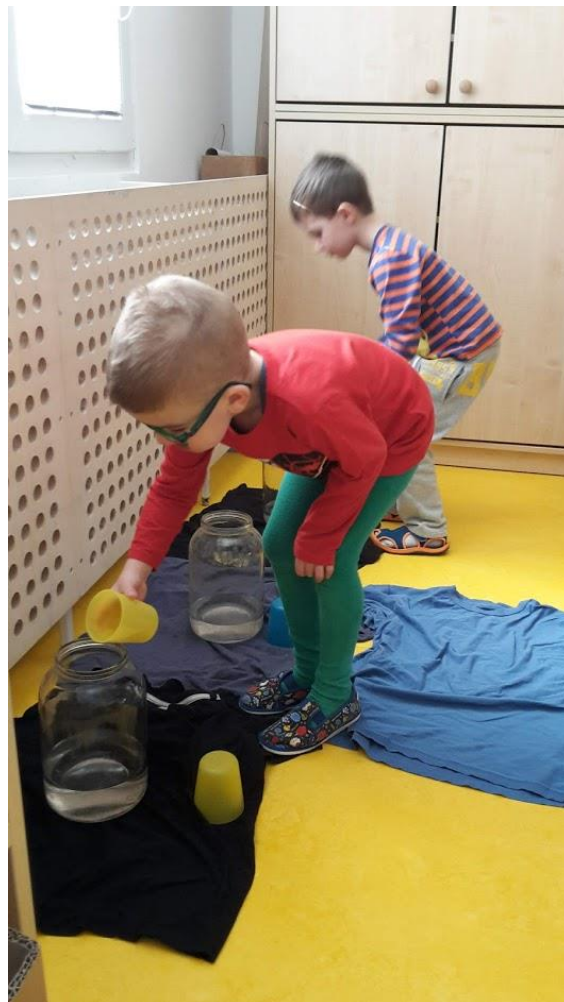
Obrázek 19 - Přelévání vody do nádob ve vesnici