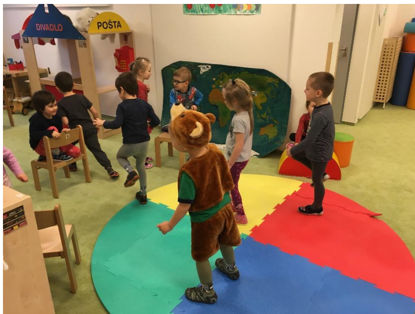
Obrázek 27 - Zpomalený pohyb rozzlobeného lidu