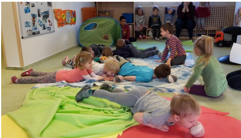
Obrázek 7 - Hra tuleních mlád'at II.