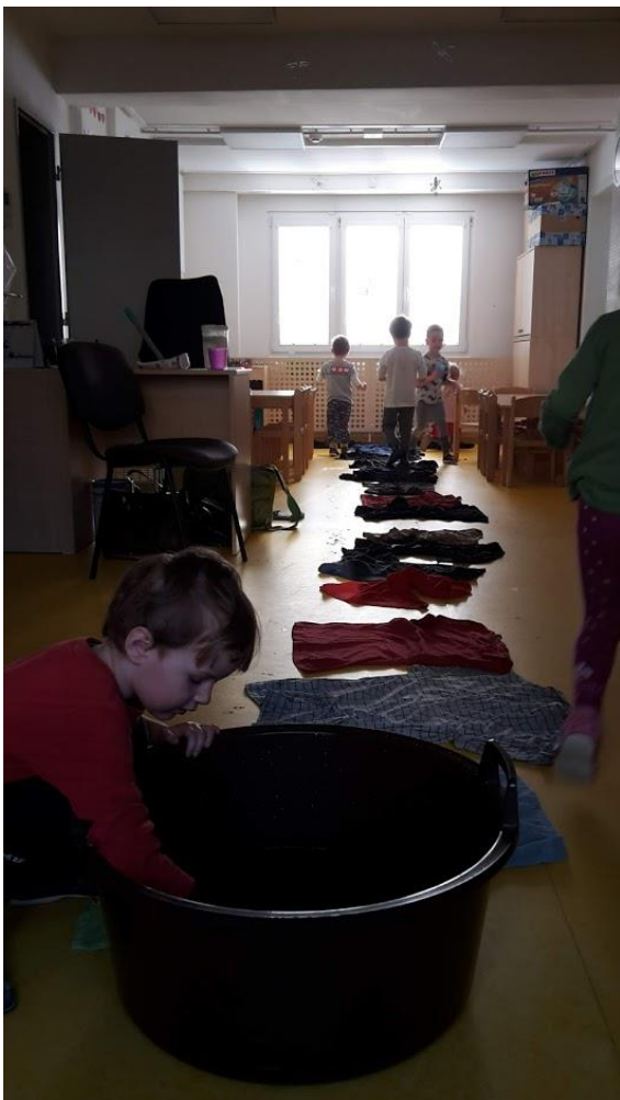
Obrázek 18 - Nabírání vody u pramene