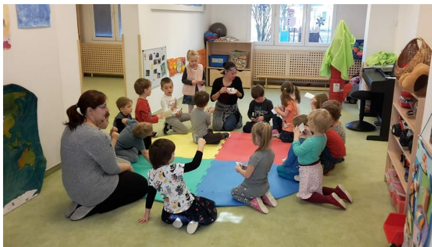
Obrázek 16 - Nalezení koal

Vyhodnocení průběhu: Před samotným hledáním bylo dětem sděleno, že koaly mohou vidět pouze tehdy, když jsou velmi potichu. Bylo tedy důležité chodit pomalu, potichu, abychom žádnou koalu nevyplašili. Děti byly zprvu zmatené, jelikož nedostaly konkrétní informace, a tak přesně nevěděly, co hledají. Obrázky koal byly však dětmi brzy objeveny. Zacházely s nimi jako se živými, nesly je v dlaních opatrně ke kruhu, kde mi bylo s nadšením sdělováno, že našly i koaly s mláďátky.