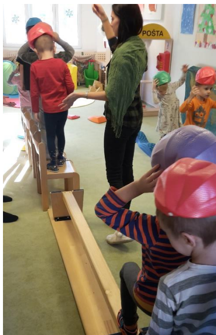
Obrázek 12 - Chodím jako král: překážková dráha

Vyhodnocení průběhu: „Myslíte si, že je těžké nosit na hlavě korunu?“ Tato aktivita sloužila nejen pro lepší představu o tom, jaké to je být králem s korunou na hlavě, ale také pro zapojení všech svalových skupin, stimulaci pohybového aparátu a zdokonalování koordinace pohybů. Z důvodu zapojení balančních pomůcek musely být pohyby pomalé a přesné, což zpočátku bylo pro některé děti velmi obtížné. Postupně však svoje tempo upravovaly až do situace, kdy dokázaly projít dráhu pouze s občasným pádem koruny. Pád koruny byl také zapříčiněn častým sledováním dění okolo a nesoustředěností, motivace dětí byla však veliká. Všechny děti chtěly být opravdovým králem a královnou.