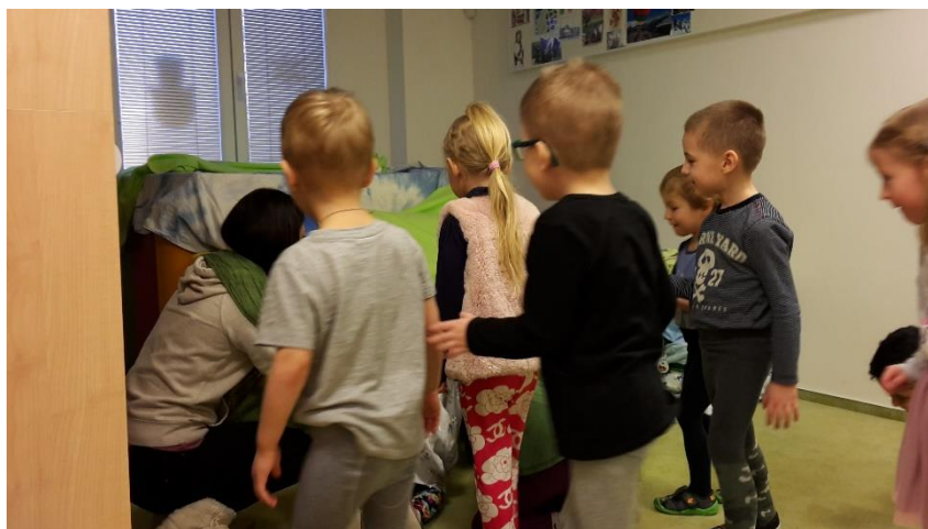
Obrázek 5 - Četba pohádky v iglú