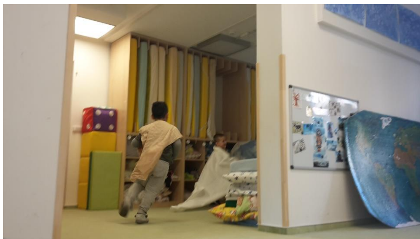
Obrázek 11 - Bělásek zahánějící hrozitánského medvěda