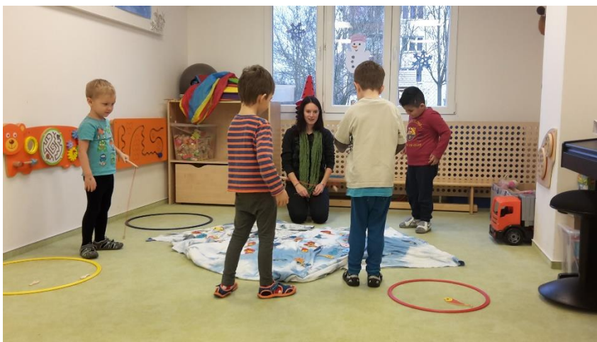
Obrázek 4 - Lov a třídění ryb

Děvčata nejprve udělala společně ohniště a následně do něj vložila dřevo. U chlapců nejprve probíhala samostatná práce, kdy si každý vytvářel své vlastní ohniště, po chvíli jim však došel materiál, a tak se rozhodli, že udělají pouze jedno společné. Nejprve nanosili dřevo a poté došli k názoru, že jim okolo ještě něco chybí, a dodali kameny.