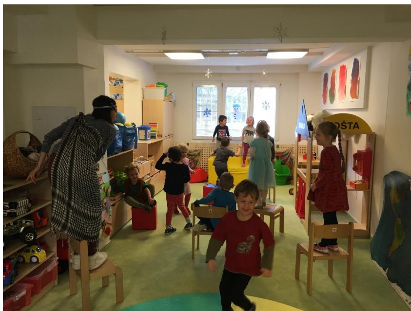
Obrázek 26 - Jdeme si pro tebe, uličníku!

Vyhodnocení průběhu: Dětem bylo předem připraveno prostředí, ve kterém se měly možnost dostat do prostoru nad zem. Hra byla zahájena hlasitým spadnutím na zem stejně jako v pohádce, kdy uličník spadl ze stromu. Po vyslovení: „ Uličníku, jdeme si pro tebe! “ se děti rozutekly do prostoru a každý si našel své místo. Rozzlobený lid následně zpomaleným pohybem chodil od uličníka k uličníkovi a kontroloval, zda nikdo nezůstal na zemi. V dalších pokusech hrály děti nejen uličníka, ale také rozzlobený lid, tudíž měly za úkol pohybovat se zpomaleně. Zpomalený pohyb zvládly jen dvě děti. Ostatní se o to pokoušely, ale v závěru se vždy rozeběhly.