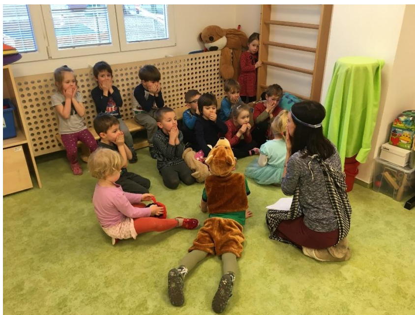
Obrázek 28 - Četba proměny uličníka

Vyhodnocení průběhu: Děti byly velmi zvědavé, jak to s uličníkem nakonec dopadne. Pozornost dětí byla upoutána vtažením konkrétních dětí do pohádky, a to zmíněním jejich jmen a následným ukazováním, ohmatáváním části těla, které se proměňovalo.