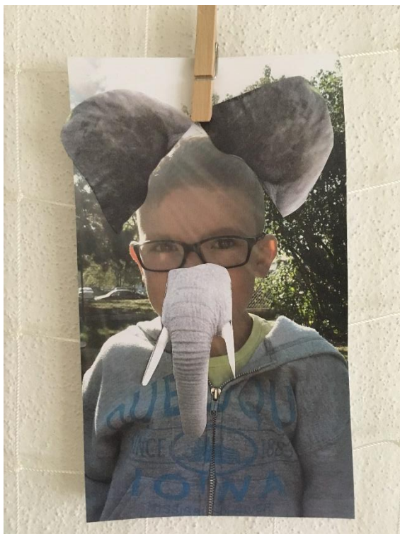
Obrázek 29 - Proměna ve slona

Samotná aktivita byla pro děti velice zábavná, ale také náročná, ať už z hlediska nalezení správných částí těl, tak i co se týče nalepování. Aktivitu bych ale i přes náročnost dětem znovu nabídla, a to hlavně z důvodu nadšení, které děti projevovaly jak u samotné tvorby, tak při reflexi, kdy mohly ostatním představit vlastní proměnu v libovolné zvíře.