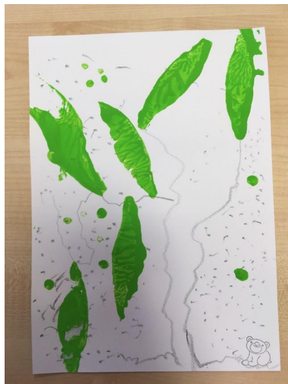
Obrázek 25 - Prastarý strom II.