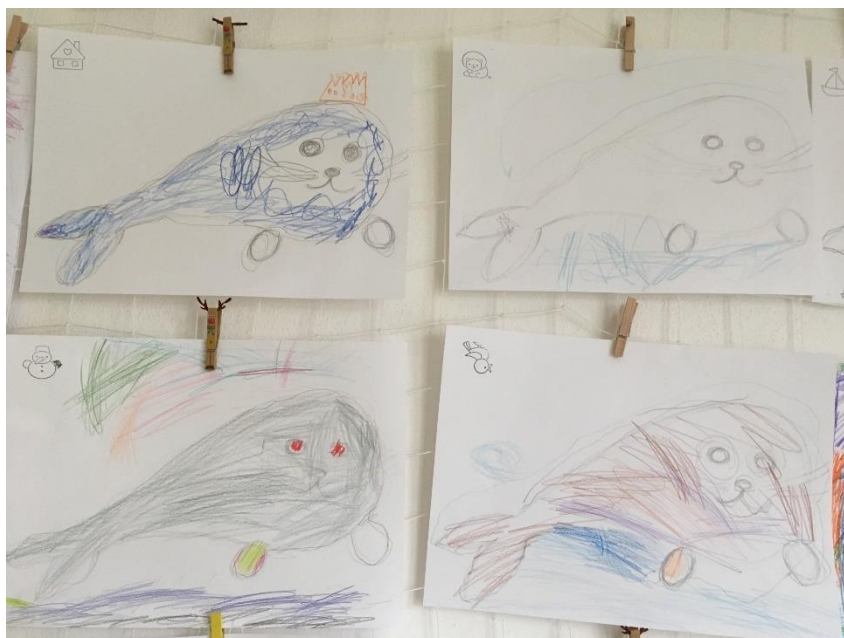
Obrázek 8 - Kresba tuleního kamaráda (zdroj: vlastní)