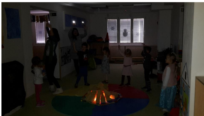
Obrázek 13 - Rituální tanec kolem ohně

Vyhodnocení průběhu: Tato hudba je hodně mystická a může na děti působit spíše negativně než pozitivně. Děti nejprve zaujatě poslouchaly, v jejich výrazech šlo vyčíst spíš nelibost, ale některé děti měly na tváři i náznak úsměvu. Následně jsme začali tančit, což připomínalo spíše mávání rukama, chůzi na místě, houpání, kývání hlavou, dupání apod. Při tanci se děti smály, bylo to pro ně zábavné, my samy jsme při realizaci vypadaly dosti zábavně. Následně jsem je nechala, aby se na hudbu pohybovaly dle vlastní fantazie. Chvilí vnímaly hudbu a pohybovaly se dle tempa a melodie, následně se aktivita začala proměňovat ve volnou hru. V ten moment jsme pomalu ztišovaly hudbu, abychom k sobě opět přitáhly pozornost. Na závěr jsme uctili Tuleního krále poklonou k ohni.