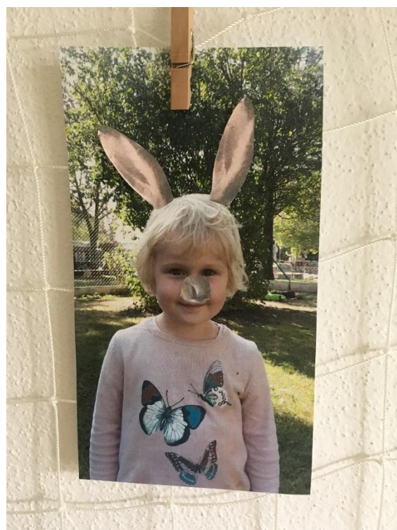
Obrázek 30 - Proměna v zajíce