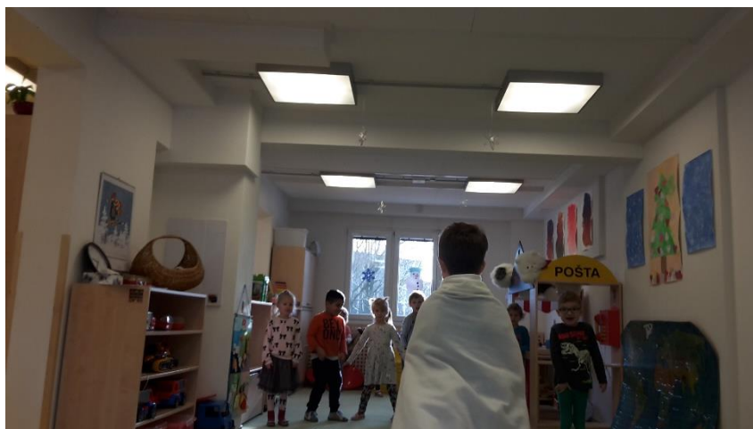
Obrázek 9 - Hra na spícího medvěda

Vyhodnocení průběhu: Po přečtení úryvku jsem dětem oznámila, že si my Eskymáci myslíme, že to bylo všechno malinko jinak. Vyprávěla jsem jim tedy, že si tulení mláďata hrála tak daleko od domova, až narazila na medvědí doupě, kde spal hrozitánský medvěd, kterého vzbudila. Měl hrozný hlad, a tak se vydal po jejich stopách do tuleního zálivu. Po vyprávění jsem jim navrhla, že bychom si mohli zahrát na zvědavé tuleně, kteří se chtějí jen malinko dotknout medvěda. Sama jsem se tedy stala spícím medvědem, ležela jsem na jednom konci třídy a děti, začarované kouzlem, stály na straně druhé. Když jsem zavřela oči, děti se pomalinku přibližovaly. Když jsem oči otevřela, zůstaly stát na místě jako sochy. Hru jsme opakovali již s dítětem v roli medvěda.