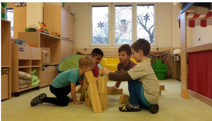
Obrázek 3 – Stavba ohniště