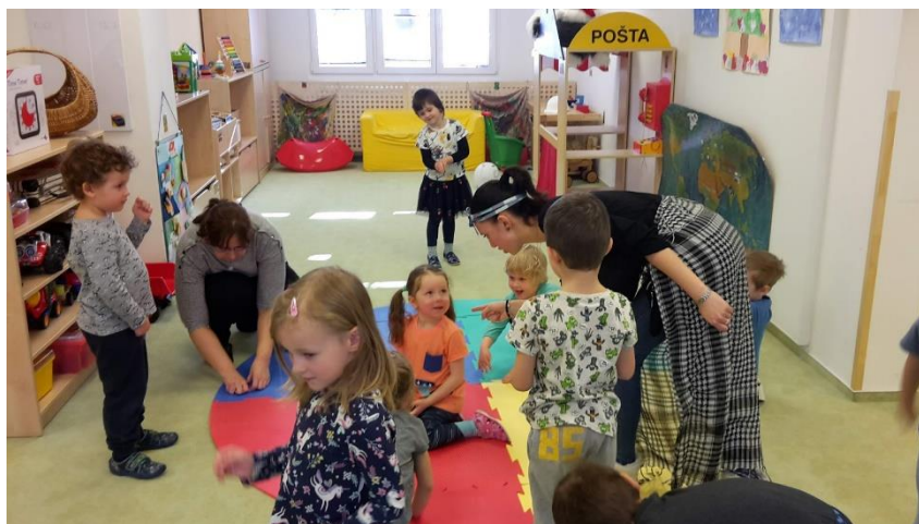
Obrázek 17 - "Uličníku, co děláš?!"

Vyhodnocení průběhu: Hra děti bavila, práce s hudebním kontrastem ticho a zvuk jim nedělal žádný problém. Při realizaci pracovního úkonu si děti volily stejnou, či podobnou činnost připomínající kopání rýčem, lopatou či vykonávání práce v dřepu. V moment, kdy se k nim náčelník přiblížil se slovy: „ Uličníku, co děláš?! “, byly děti vystrašené, odpovídaly proto jen slovem: „ Pracuji. “ Po odpovědi, kdy náčelník odcházel k jinému dítěti, se na něj však dotazované dítě provokativně smálo. Bylo zde vidět vžití do role uličníka, který má sice z náčelníka strach, ale přesto radši zlobí a nedělá, co má.