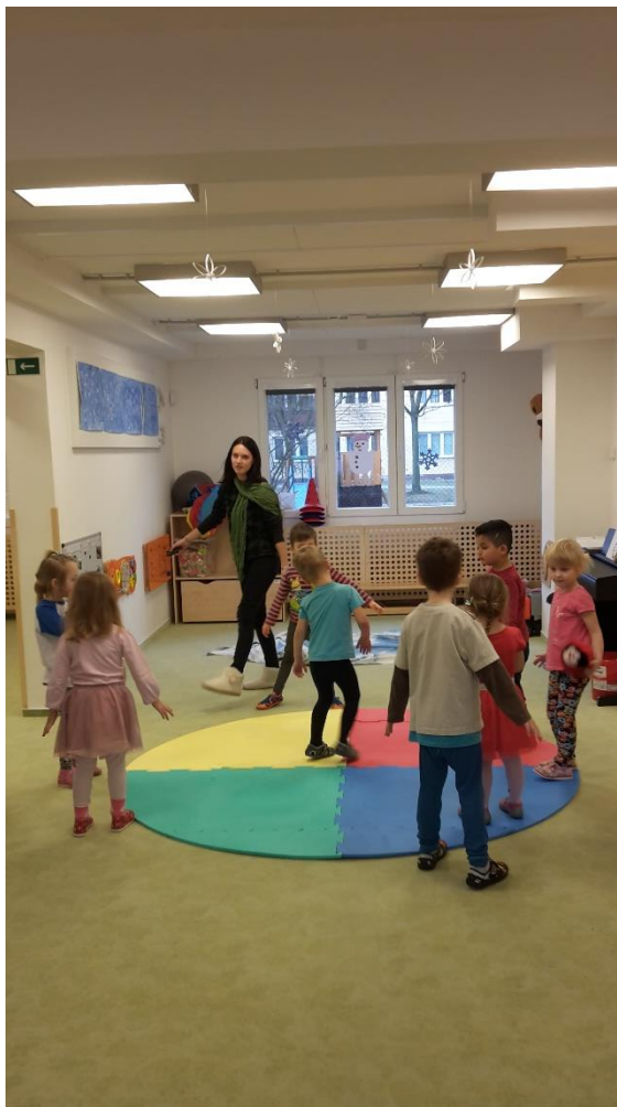
Obrázek 2 - Pozdrav Eskymáků