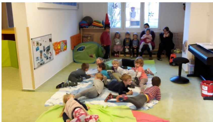
Obrázek 6 - Hra tuleních mlád'at I.

Vyhodnocení průběhu: Před samotnou realizací jsem si neuměla konkrétně představit, jak bude tato aktivita probíhat. Zda se děti nerozdivočí, jak tento úkol vlastně uchopí. Musím však konstatovat, že jsem byla mile překvapena. Děti se opravdu vžily do role tuleních mlád'at, a tak se pouze kolébaly na modrém prostěradle a vydávaly zvuky připomínající tulení štěkot.