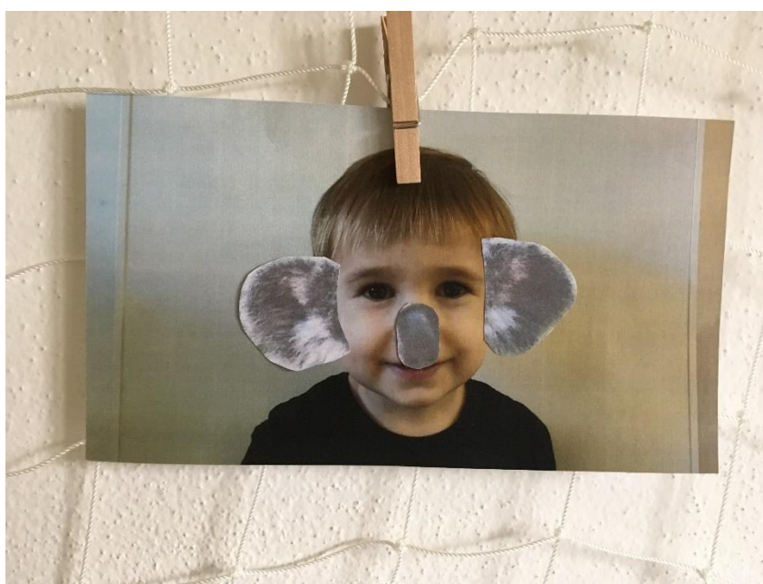
Obrázek 31 - Proměna v koalu