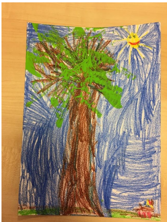
Obrázek 24 - Prastarý strom I.