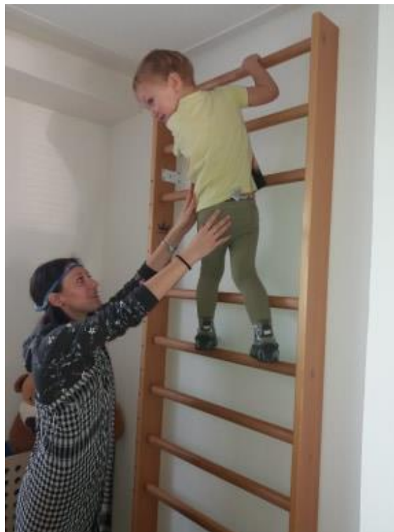
Obrázek 23 - Hurá do koruny prastarého stromu