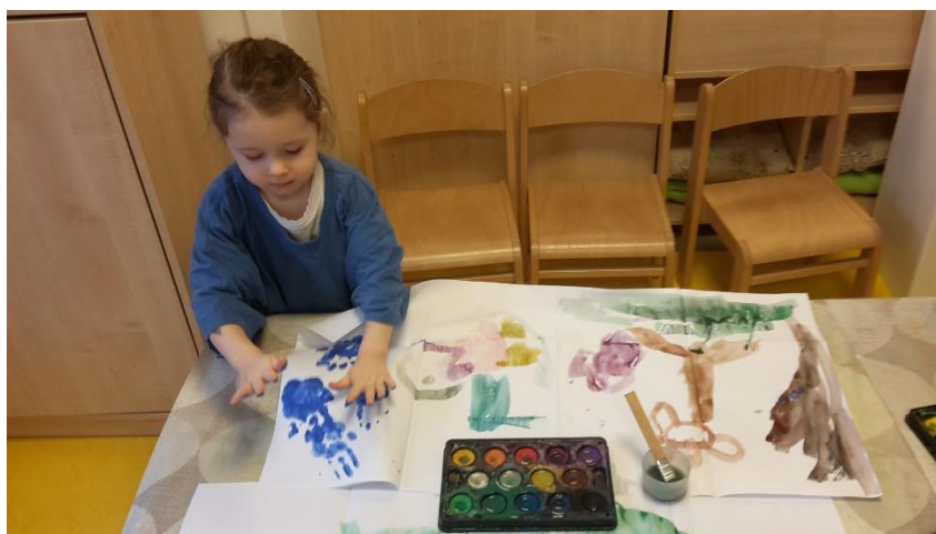
Obrázek 14 - Malba tuleního zálivu a tisk medvědíh stop

Vyhodnocení průběhu: Práce s barvami, jejich míchání a propojování je pro děti velmi oblíbenou činností. Pokud jim k tomu ještě umožníme pracovat samostatně a dáme jim prostor pro svobodnou volbu v rozhodování, jak téma pojmu, stanou se opravdovými umělci. Také se mi velmi osvědčilo zapojit do malby prožitek z doteku. Malba prsty či obtiskování celých dlaní je pro děti fascinující a velmi příjemné. Musíme však dbát na to, že ne pro každé dítě, a tak je potřeba vymyslet alternativu, která by dítěti poskytla stejný prožitek, ale nefrustovala jej. Osvědčenou možností jsou gumové rukavice.