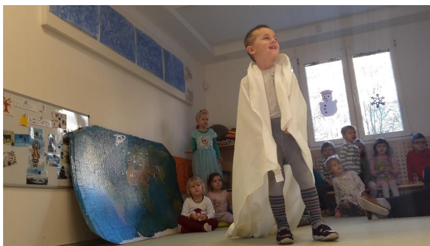
Obrázek 10 - Medvěd loví Běláskovu maminku

Vyhodnocení průběhu: V první, společné dramatizaci se děti v roli Běláska ochránářsky vrhly na medvěda, povalily ho, až musel prosit, aby ho nechaly odejít. Medvěd se však vrátil, a tak jej pronásledovaly až do jeho doupěte, kde mu podle slov dětí „ strhly kůži z těla “ – bílá deka, kterou přinesly po dokončení ke kruhu. Při dalších pokusech již hrály děti pouze spolu, bylo zapotřebí klást důraz na bezpečnost a ohleduplnost k ostatním aktérům. Děti projevovaly velký zájem o roli medvěda a Běláska, maminku jsme v posledních pokusech musely ztvárnit my.