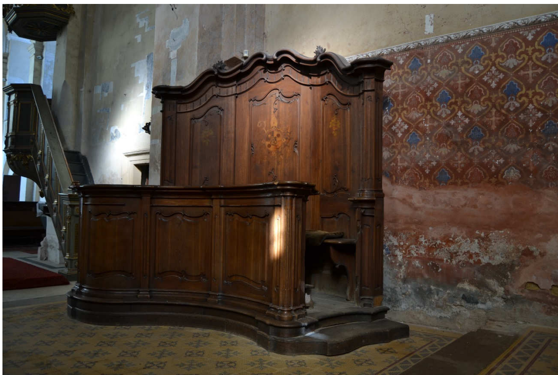
Obrázek 14- Opatské lavice v kostele sv. Petra a Pavla v Kralovicích