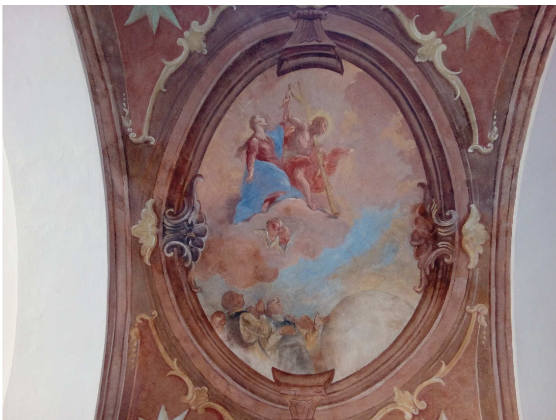
Obrázek 6- Freska v klenbě nad vchodem do ambitu, která zachycuje Spasitele trestajícího lid blesky a Pannu Marii, která se přimlouvá za cisterciácký řád