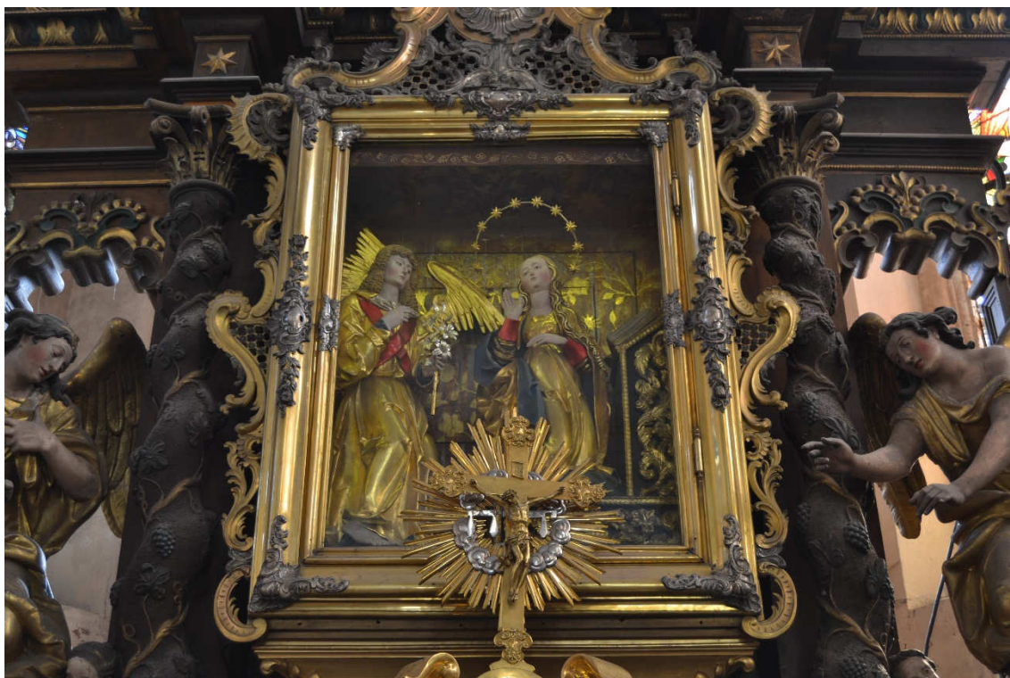
Obrázek 12- Sousoší Zvěstování Panny Marie v kostele sv. Petra a Pavla v Kralovicích