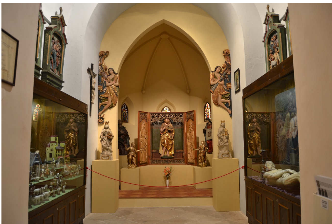
Obrázek 28- Místnost C 1 v současné expozici, která představuje interiér kaple