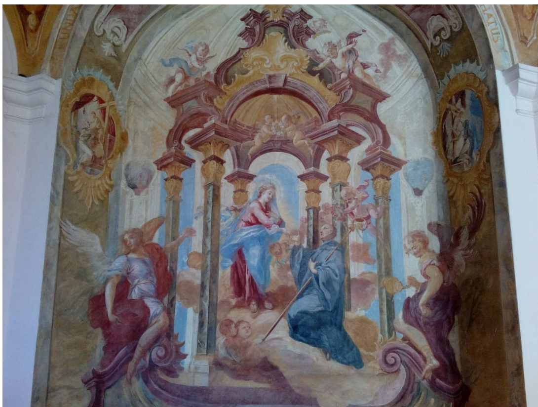
Obrázek 4- Nástěnná freska v kapli sv. Roberta, která zachycuje Pannu Marii předávající zasnubní prsten sv. Robertovi