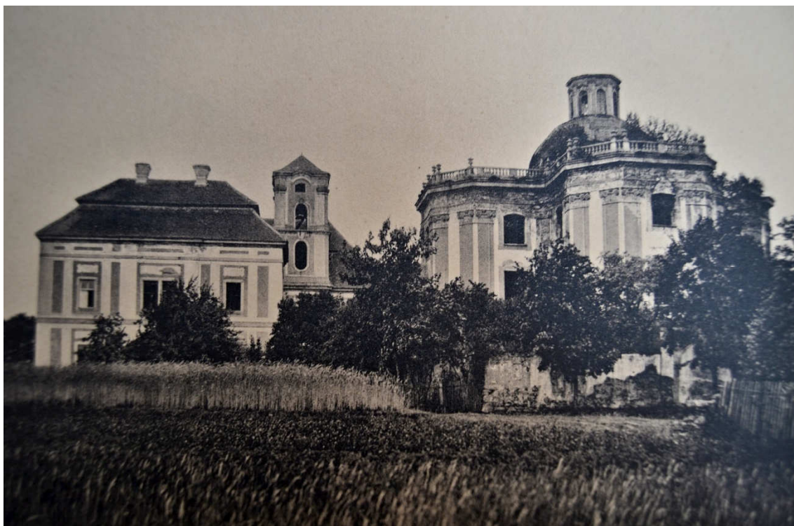
Obrázek 20- Stav Mariánské Týnice kolem roku 1908