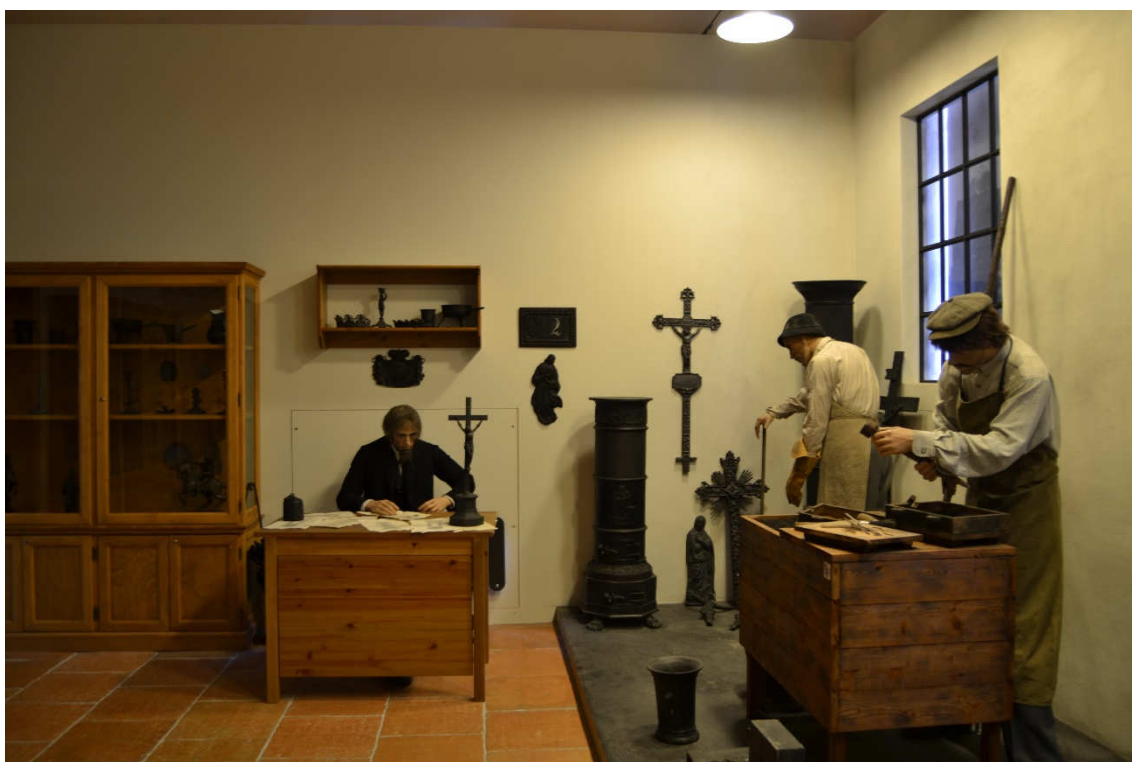
Obrázek 32- Místnost E 1 v současné expozici, která je věnována výrobkům z litiny