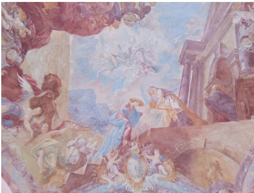
Obrázek 1- Freska v klenbě kaple sv. Štěpána zachycující setkání Panny Marie se sv. Alžbětou, ve spodní části fresky je k vidění osobní emblém opata Celestýna Stoye (Jozua zastavující běh slunce)