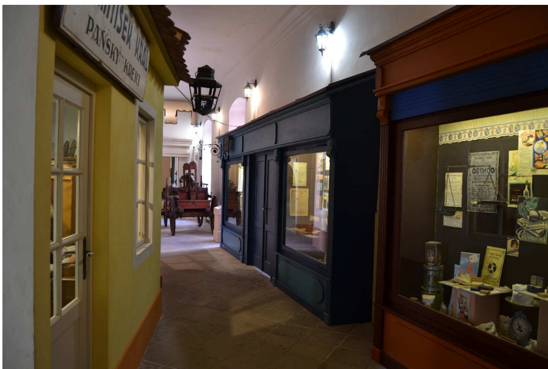
Obrázek 34- Chodba F 1 v současné expozici, která představuje městskou ulici