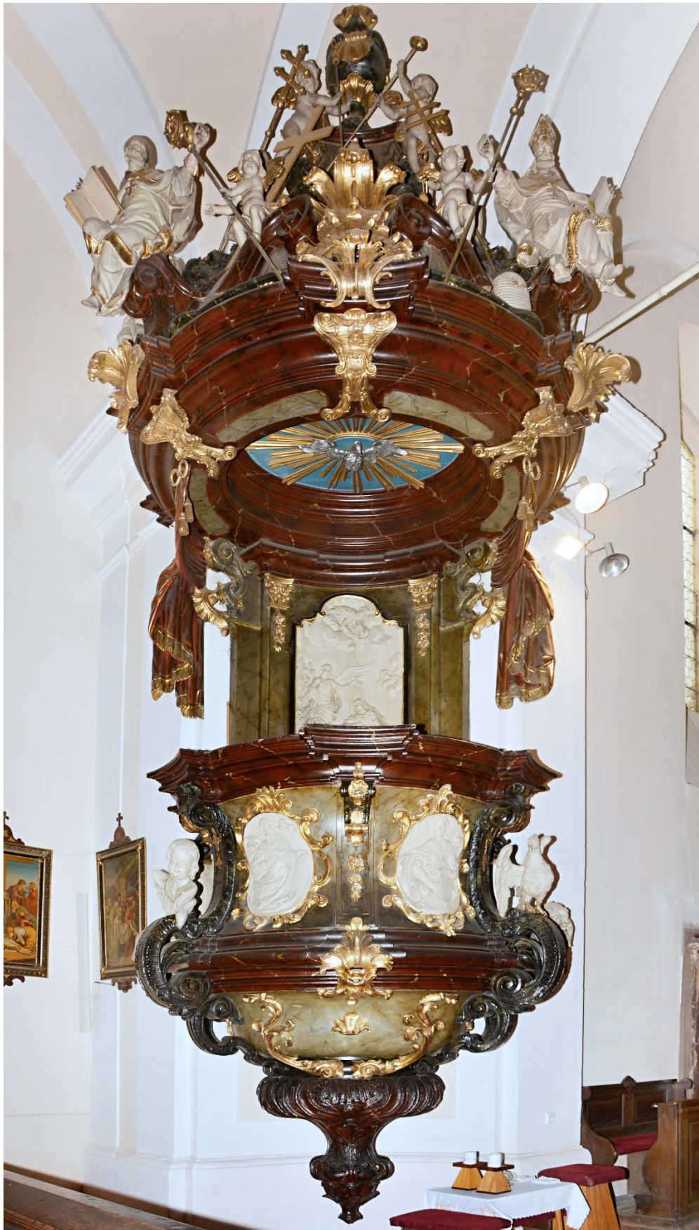
Obrázek 16- Kazatelna v kostele sv. Vavřince v Žebráku