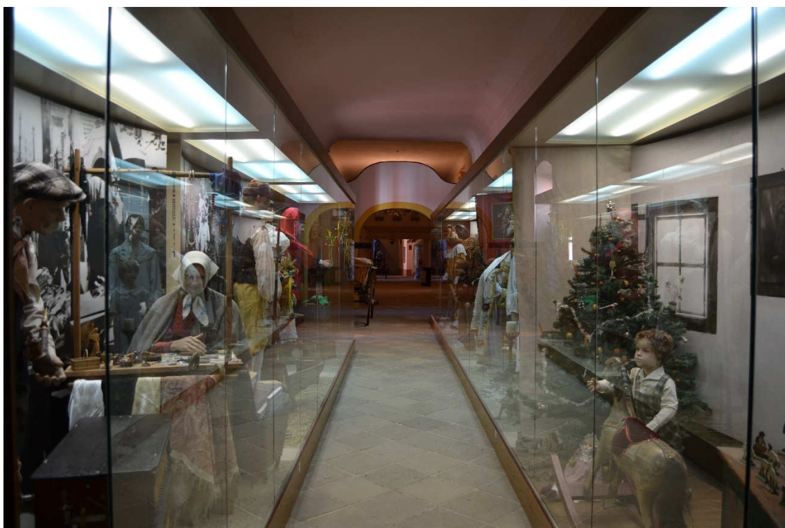
Obrázek 30- Chodba D 1 v současné expozici, která je věnována lidovým zvykům