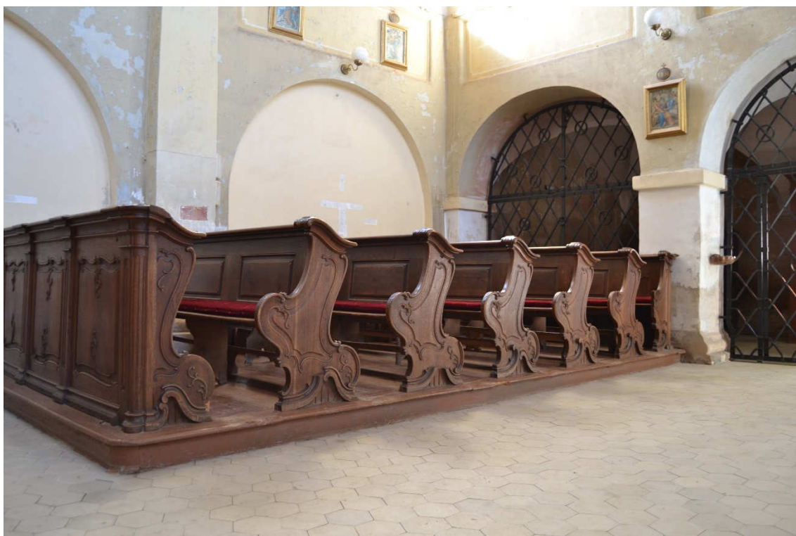
Obrázek 13- Lavice pro lid v kostele sv. Petra a Pavla v Kralovicích