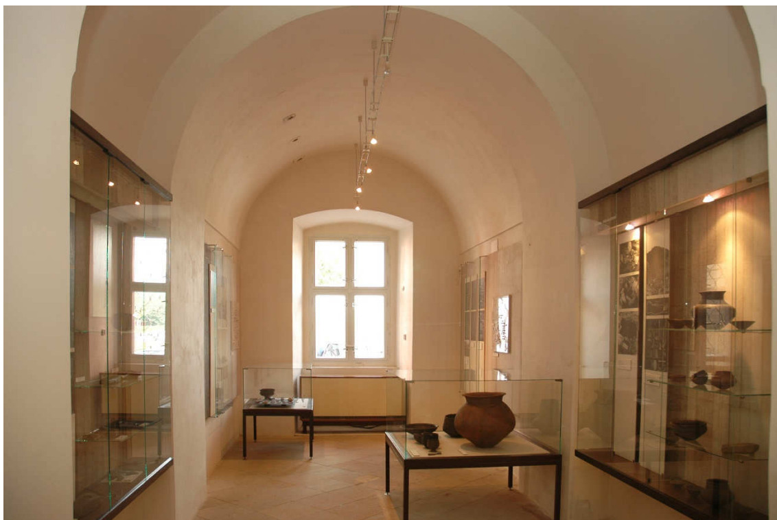
Obrázek 23- Přízemní část expozice z 90. let 20. století, ve které byly vystaveny archeologické nálezy