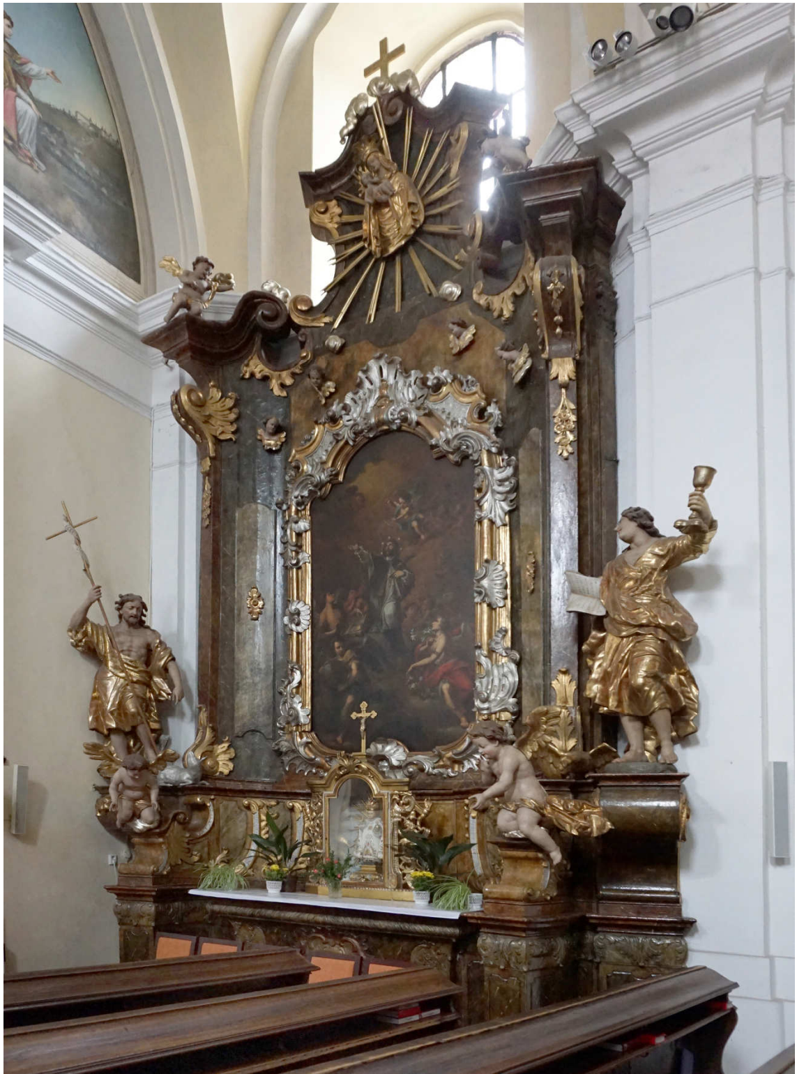
Obrázek 18- První z bočních oltářů v kostele sv. Jakuba v Příbrami