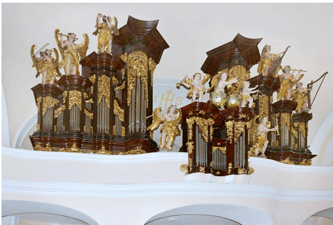
Obrázek 15- Varhany v kostele sv. Vavřince v Žebráku