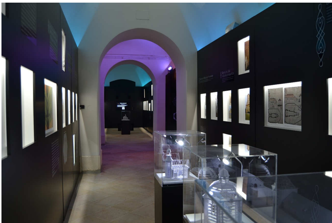
Obrázek 24- Současný stav expozice v přízemí představující Baroko a jeho svět