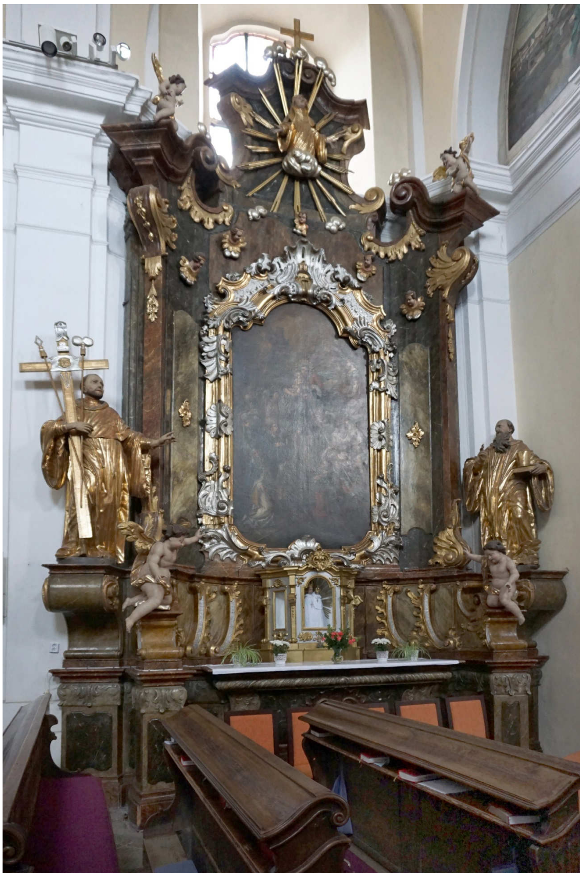
Obrázek 19- Druhý z bočních oltářů v kostele sv. Jakuba v Příbrami