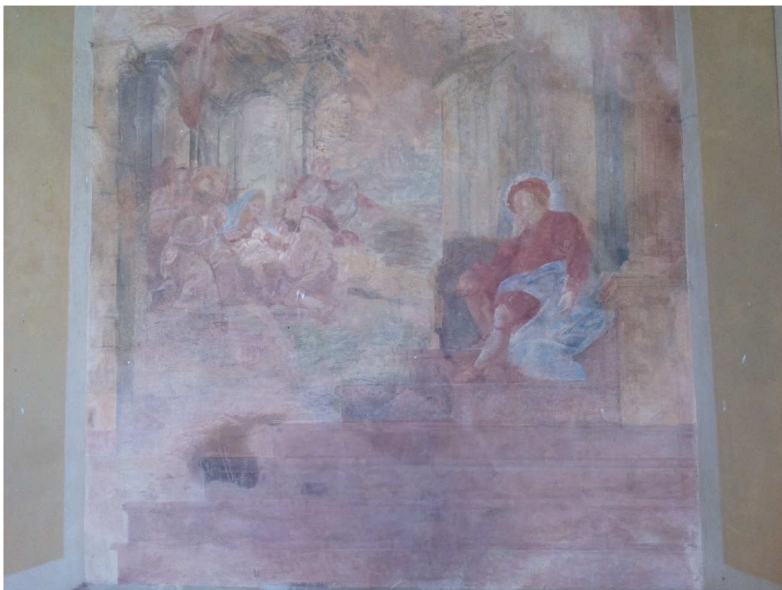
Obrázek 5- Nástěnná freska v kapli sv. Bernarda zachycující sv. Bernarda, který sní o Narození Páně