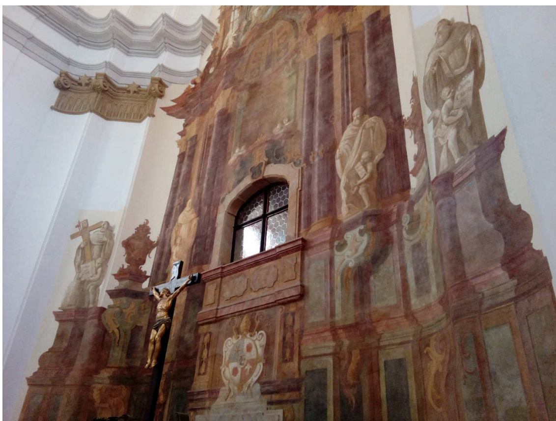
Obrázek 9- Freska iluzivního oltáře v chrámu Zvěstování Panny Marie, která zachycuje cisterciácké světce, znak plaského kláštera s monogramem Celestýna Wernera (C 2) a osobní emblém Fortunáta Hartmanna (kotva nad oknem do oratoře)