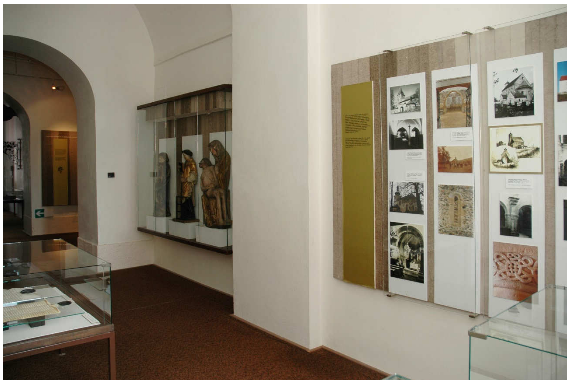
Obrázek 27- Místnost C 1 v expozici z 90. let 20. století, která byla věnována ranému středověku