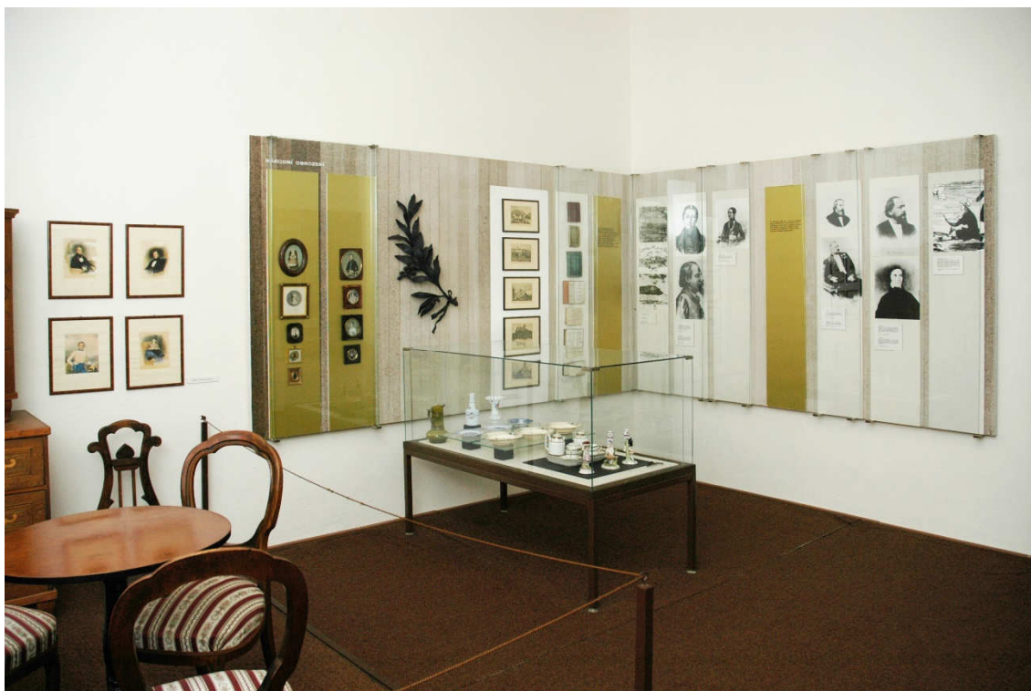
Obrázek 25- Místnost B v expozici z 90. let 20. století, která byla věnována národnímu obrození