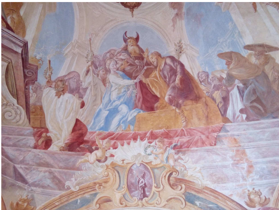
Obrázek 3- Freska v klenbě kaple sv. Roberta zachycující zasnoubení Panny Marie a sv. Josefa, ve spodní části fresky je k vidění osobní emblém opata Celestýna Stoye (Jozua zastavující běh slunce)