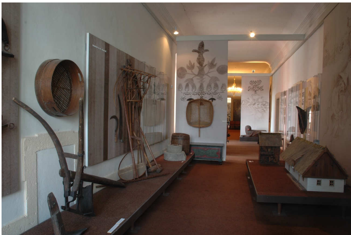
Obrázek 29- Chodba D 1 v expozici z 90. let 20. století, která byla věnována životu na venkově