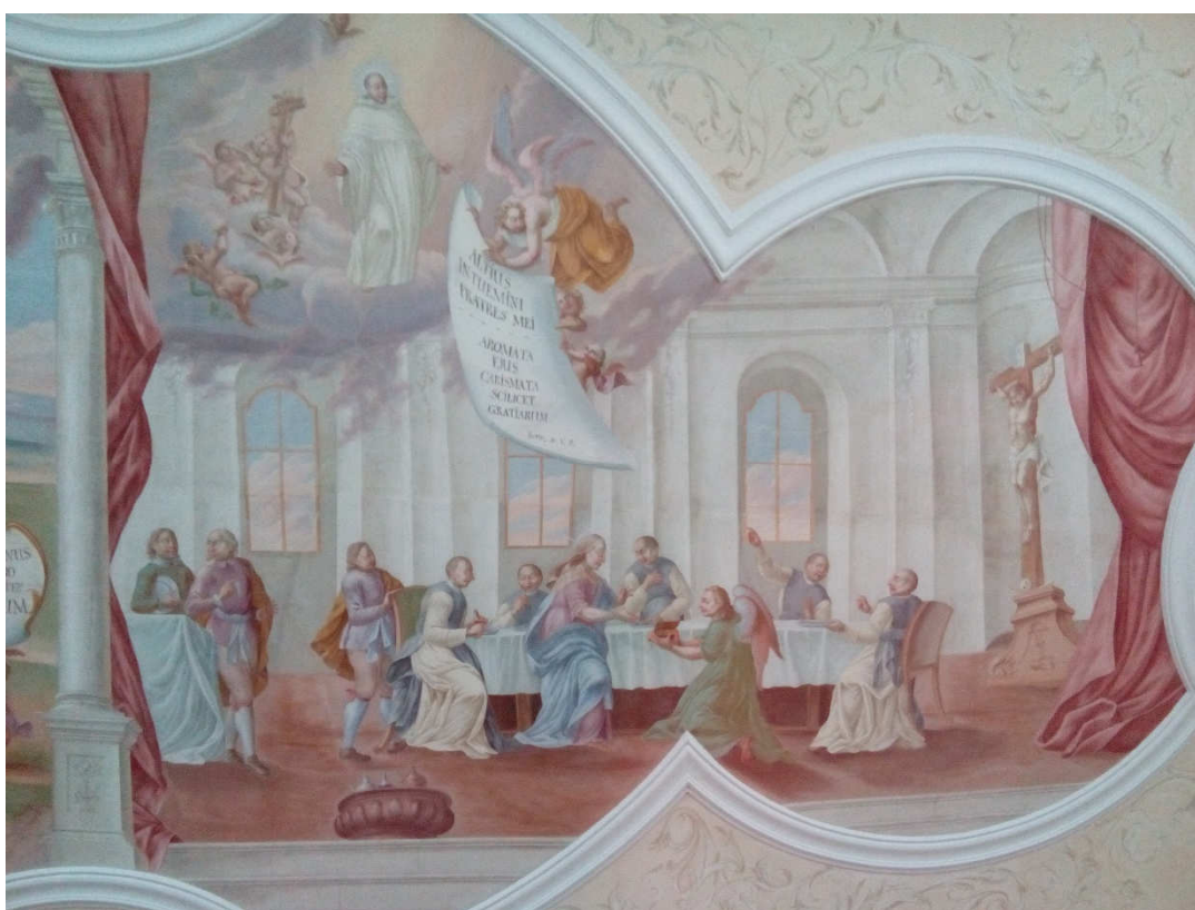
Obrázek 11- Pravá polovina fresky v refektáři, která zachycuje stolující řeholníky s Pannou Marií a žehnajícího sv. Bernarda