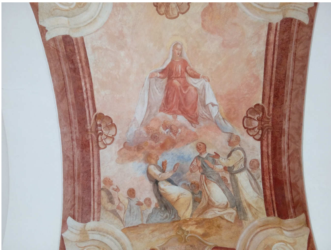
Obrázek 7- Freska v klenbě nad vchodem do ambitu, která zachycuje Pannu Marii jako ochránkyni cisterciáckého řádu