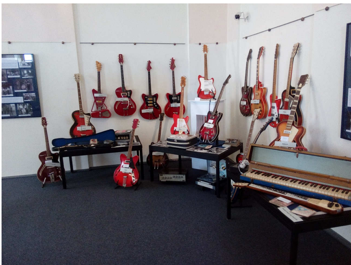
Obrázek 36- Výstavní sál H v roce 2018, kdy zde byla umístěna krátkodobá výstava bigbeatových kapel severního Plzeňska