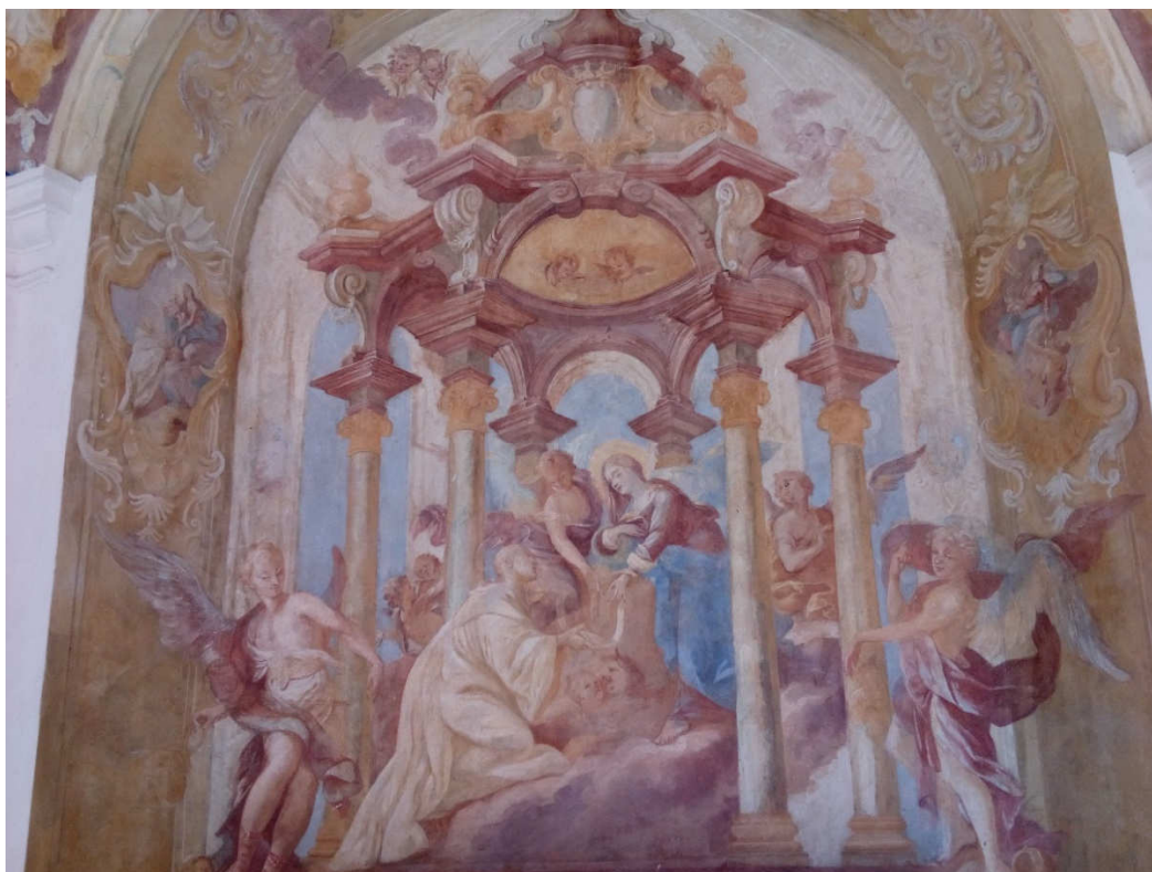
Obrázek 2- Nástěnná freska v kapli sv. Štěpána zachycující Pannu Marii, která předává opasek od řeholního roucha sv. Štěpánovi