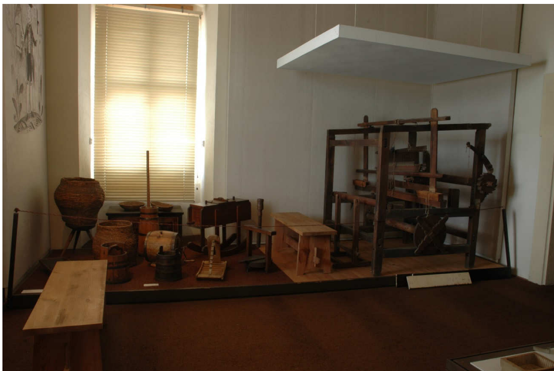
Obrázek 31- Místnost E 1 v expozici z 90. let 20. století, která byla věnována životu na venkově