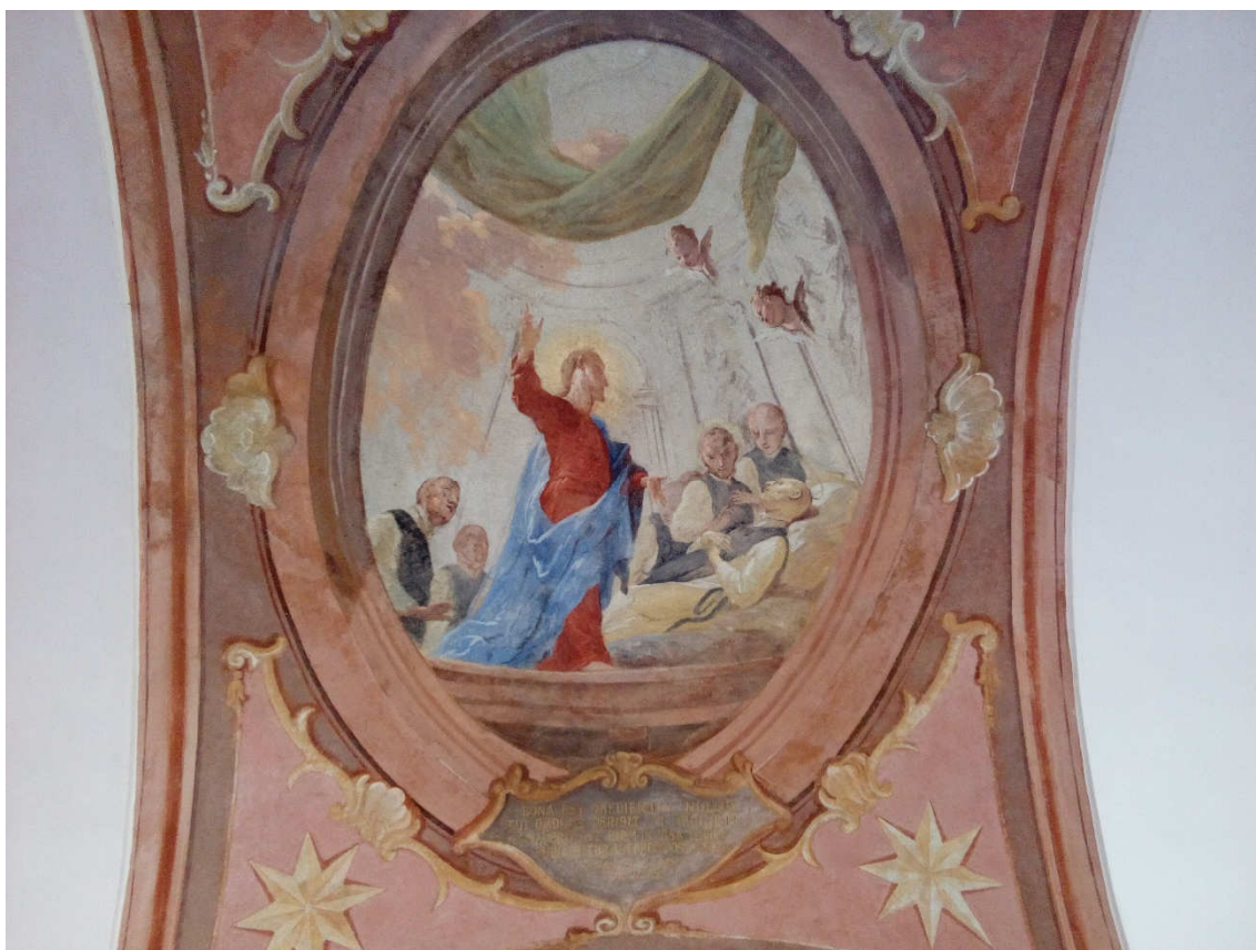
Obrázek 8- Freska v klenbě nad vchodem do ambitu, která zachycuje umírajícího sv. Bernarda