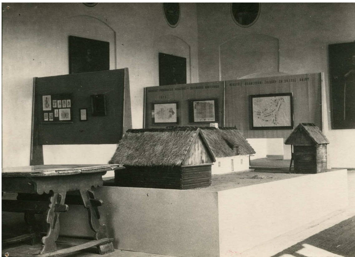
Obrázek 35- Výstavní sál H v roce 1954, kdy v něm byla umístěna stálá expozice