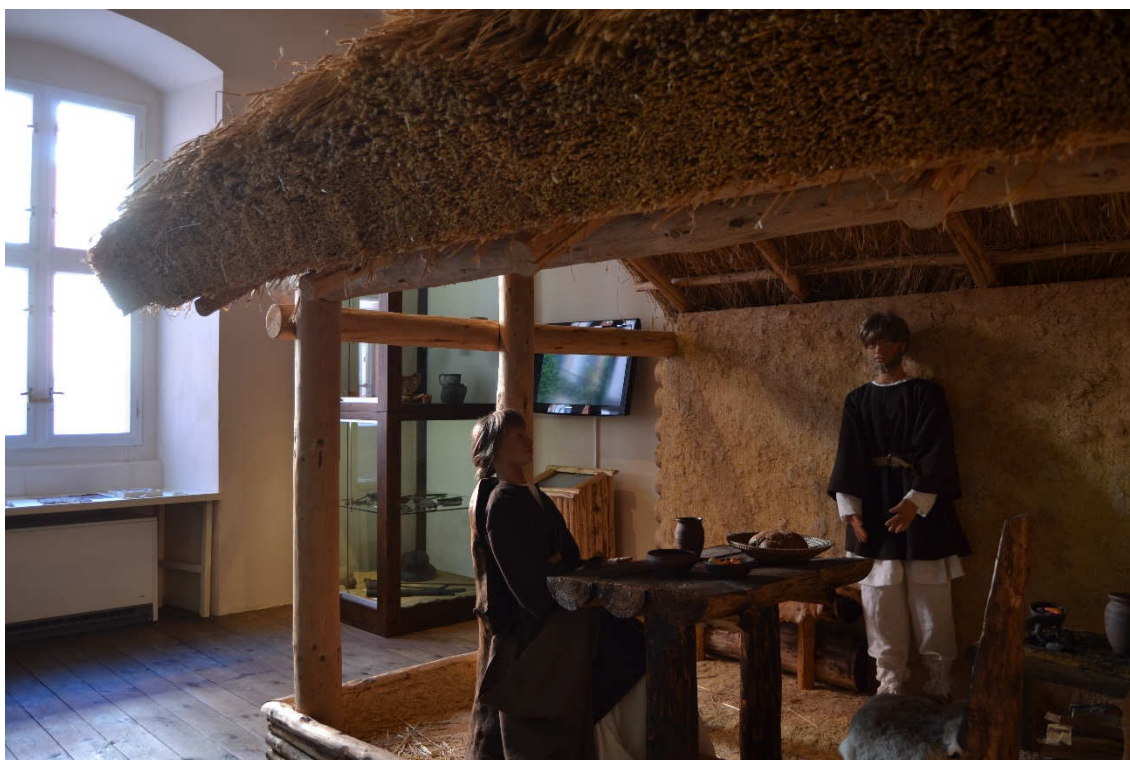
Obrázek 26- Místnost B v současné expozici, ve které je umístěna ukázka středověkého obydlí