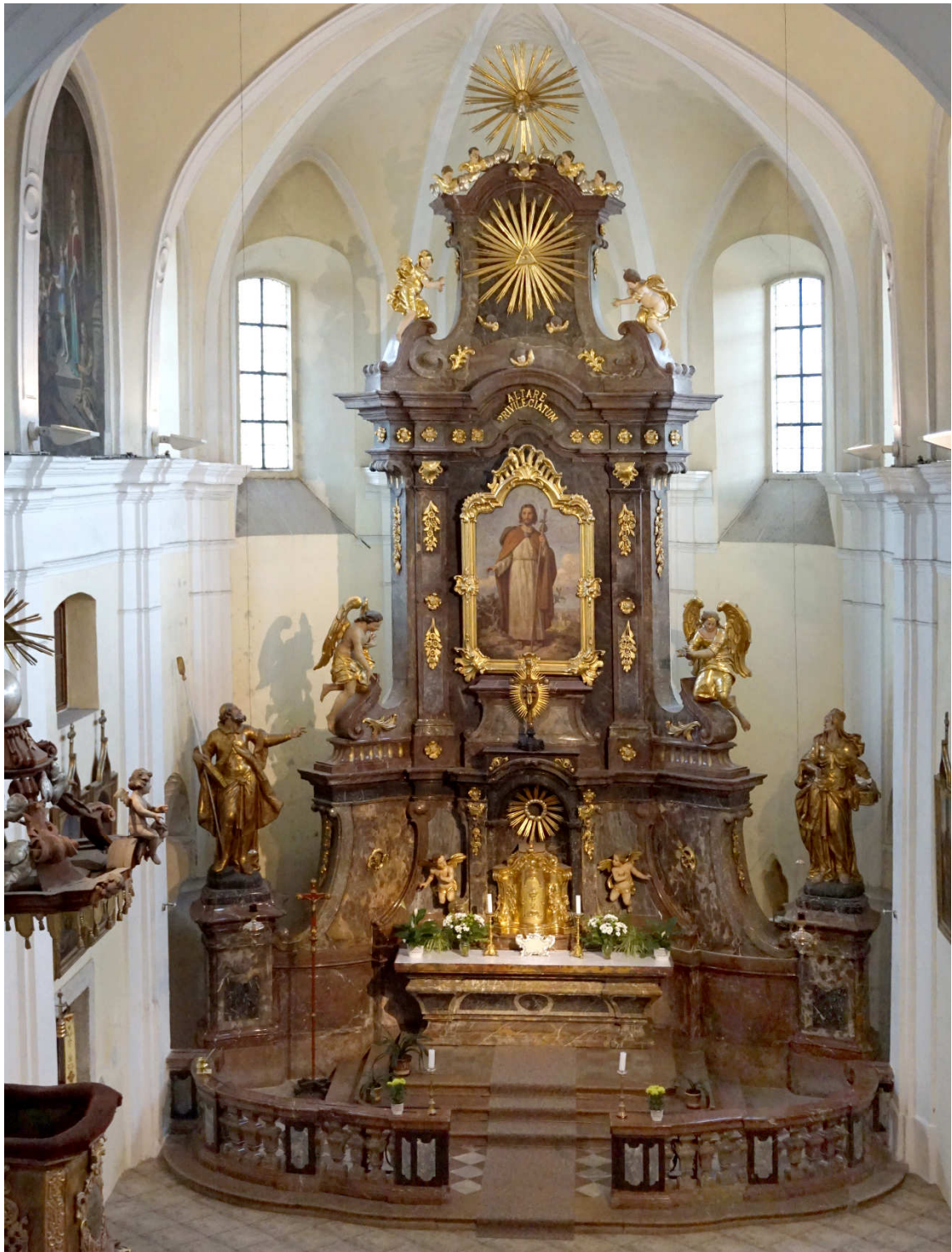
Obrázek 17- Hlavní oltář v kostele sv. Jakuba v Příbrami