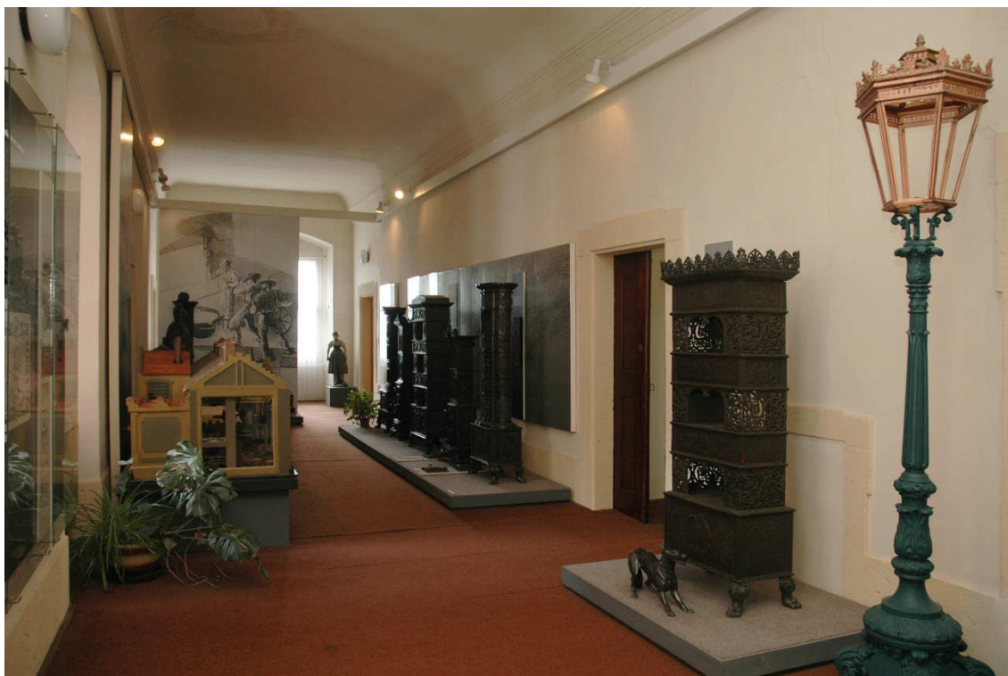
Obrázek 33- Chodba F 1 v expozici z 90. let 20. století, která byla věnována výrobkům z litiny