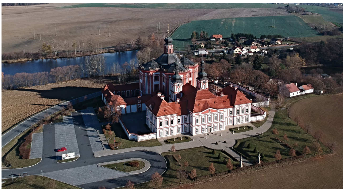
Obrázek 21- Současný stav Mariánské Týnice s rozestavěným východním ambitem