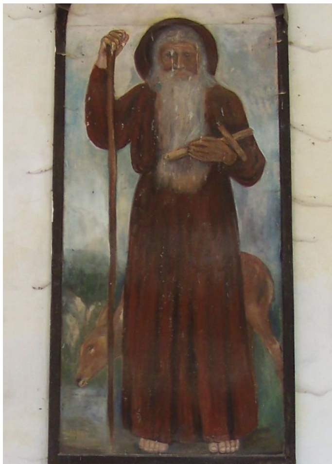
Obr. 1 sv. Ivan