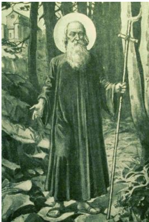
Obr. 2 sv. Prokop