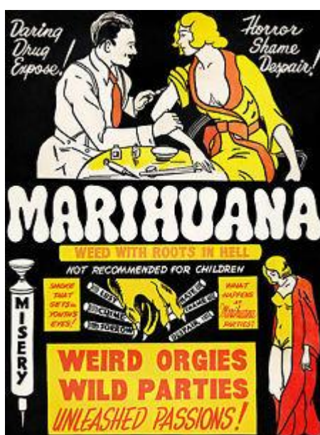
Obrázek 3 Antireklama zaměřená na marihuanu

Níže jsou vyobrazeny konkrétní příklady antireklamy zaměřené na děti a mládež. Je vhodné poznamenat, že antireklama má vliv také na turisty. Z již uvedené typologie turistů plyne, že turisté vyhledávají zábavu, vzrušení a odreagování od každodenních starostí, přesto si však uvědomují rizika, která jsou s užíváním drog spjata. V případě že by se antireklama zaměřila na zdravotní, sociální i právní rizika účasti na drogovém cestovním ruchu, by mohli turisté zamezit nekontrolovatelnému užívání drog. (Pužejová, 2012)