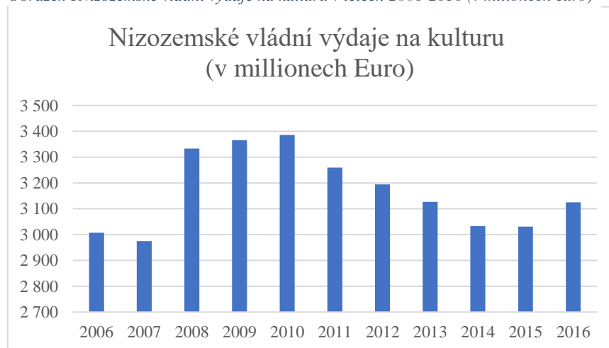
Obrázek 1 Nizozemské vládní výdaje na kulturu v letech 2006-2016 (v milionech euro)