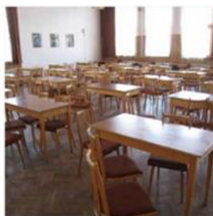
příklad „restauračního“ uspořádání návštěvní místnosti