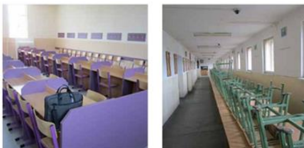
příklad liniového uspořádání návštěvních místností