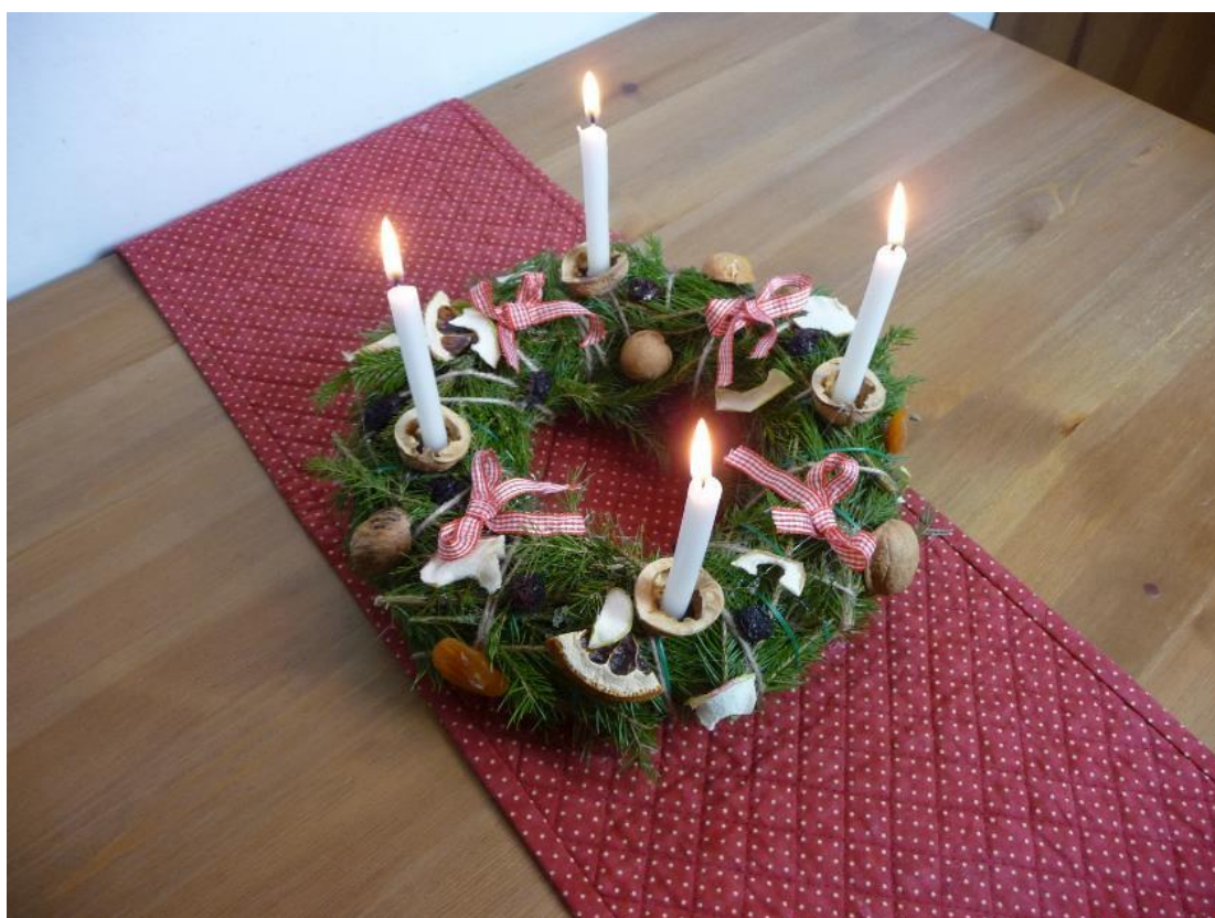
Obr. č. 6 – Adventní věnec. Fotografie.