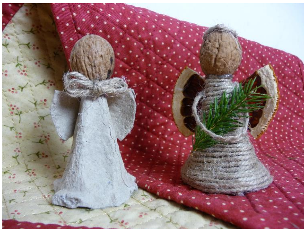
Obr. č. 8 – Andílek z přírodních materiálů. Fotografie.