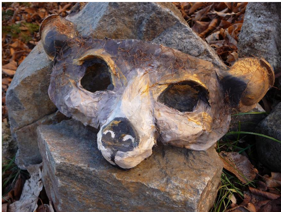
Obr. č. 22 – Masopustní maska. Fotografie.