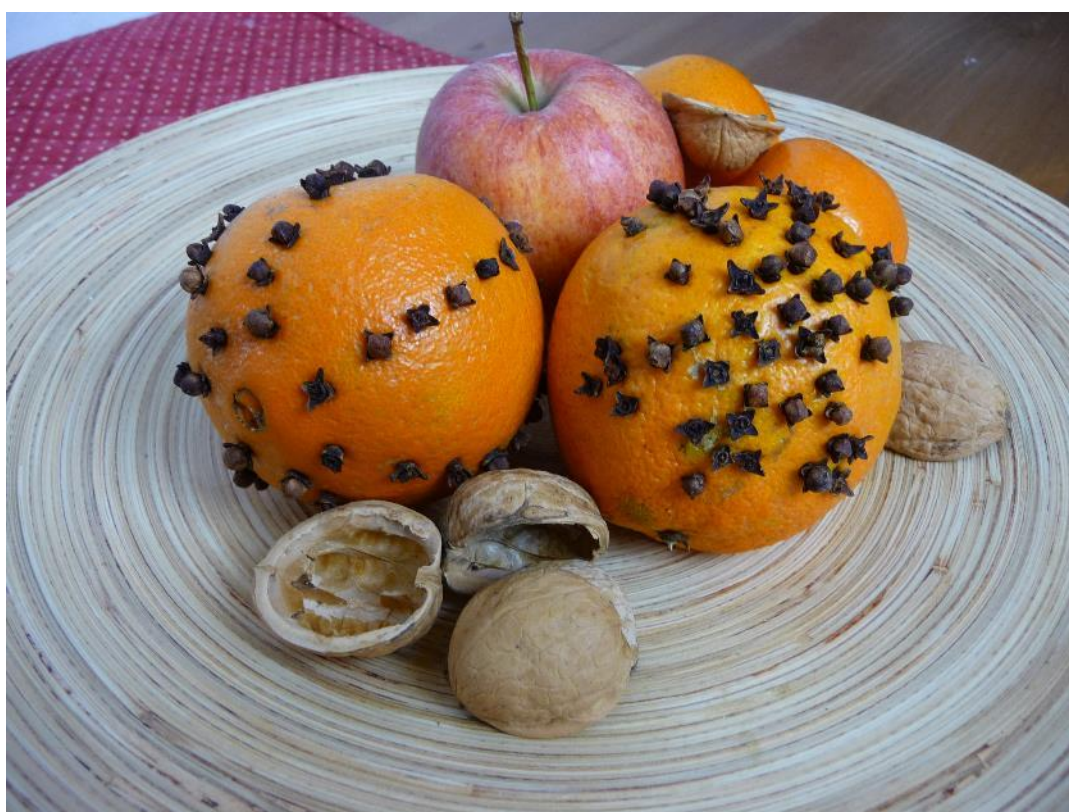
Obr. č. 10 – Vonný pomeranč. Fotografie.