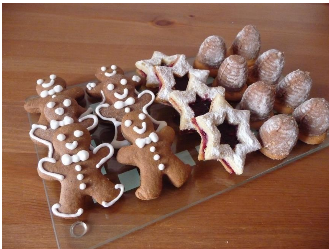
Obr. č. 26 – Cukroví. Fotografie.