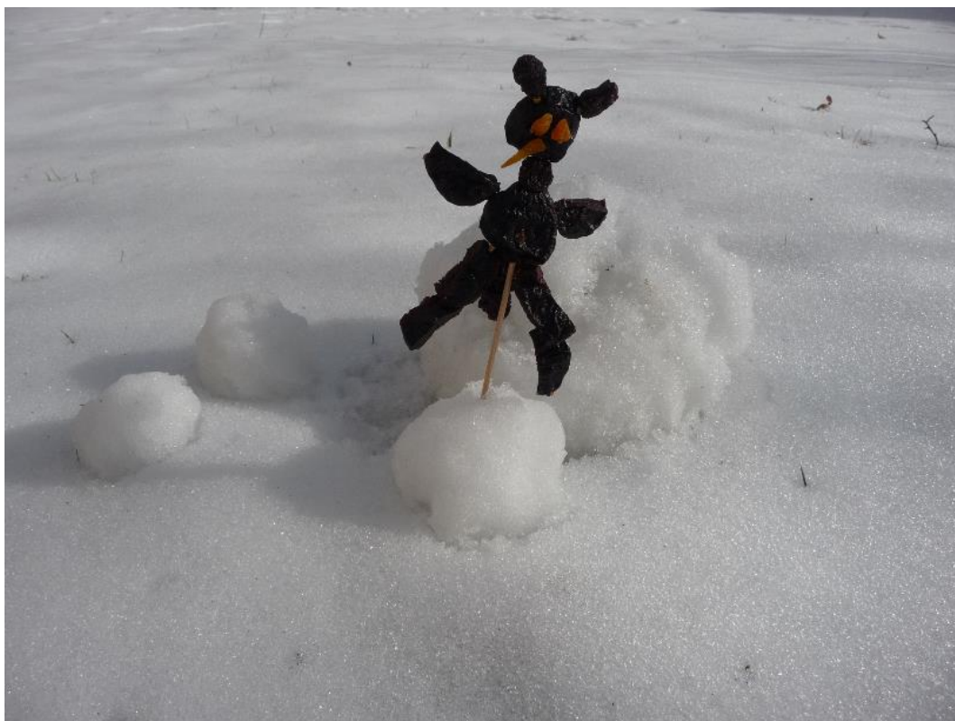
Obr. č. 9 – Čertík ze sušených švestek. Fotografie.