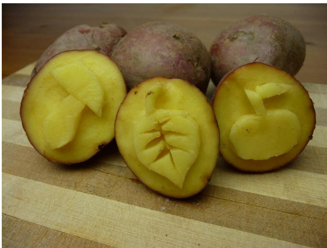
Obr. č. 18 – Razítka z brambor – podzimní tematika. Fotografie.