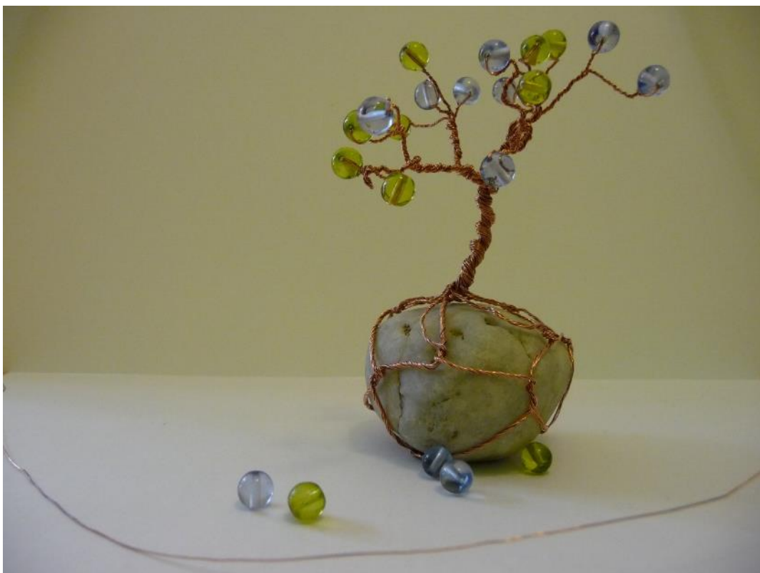
Obr. č. 11 – Strom štěstí z drátků. Fotografie.