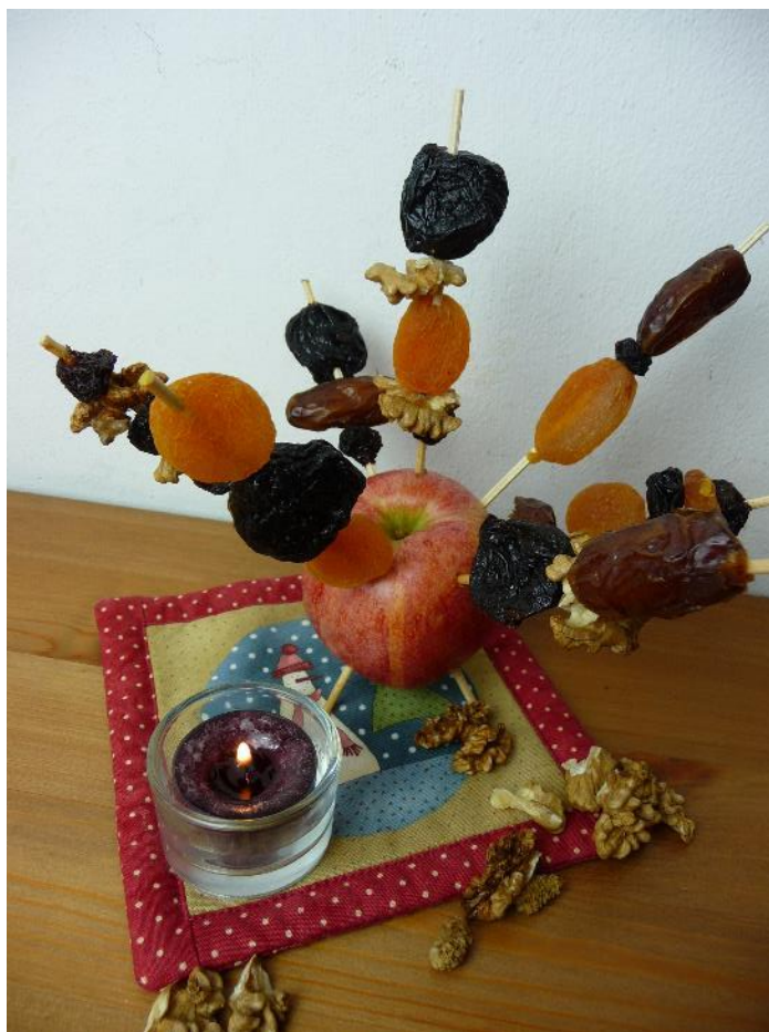
Obr. č. 19 – Vánoční jablíčko. Fotografie.