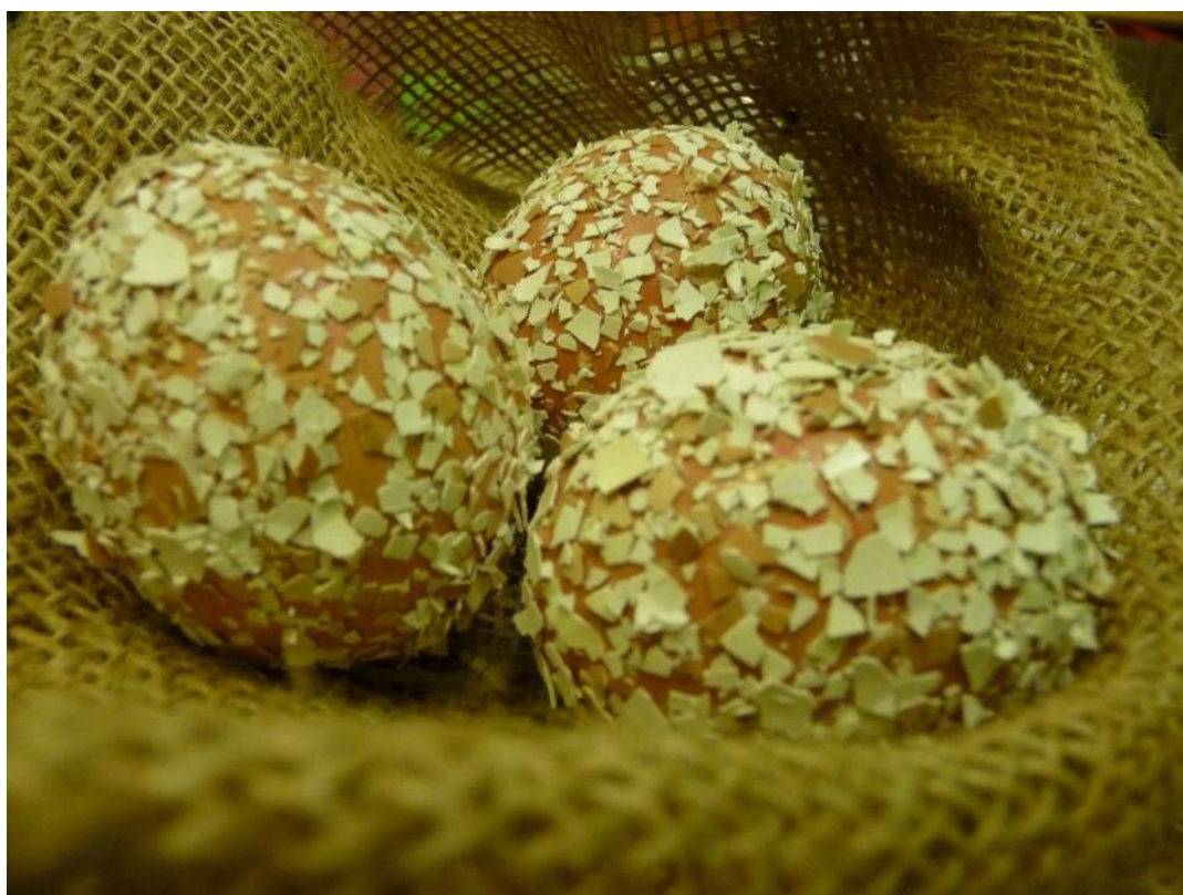
Obr. č. 12 – Rustikální vejce. Fotografie.