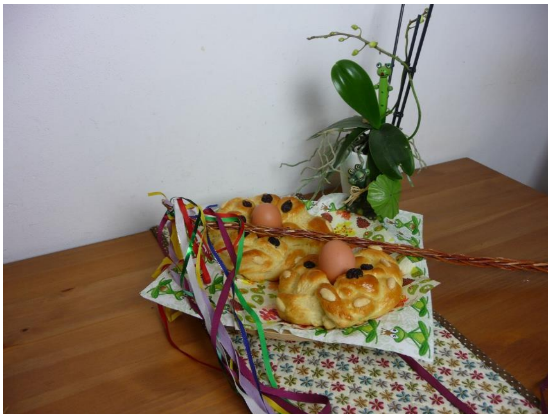
Obr. č. 13 – Pomlázka. Fotografie.