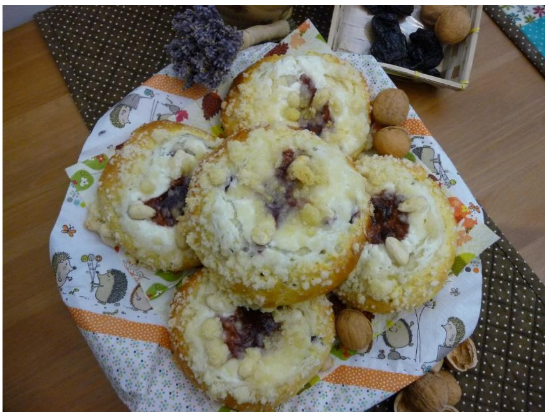
Obr. č. 4 – Posvícenské koláče. Fotografie.