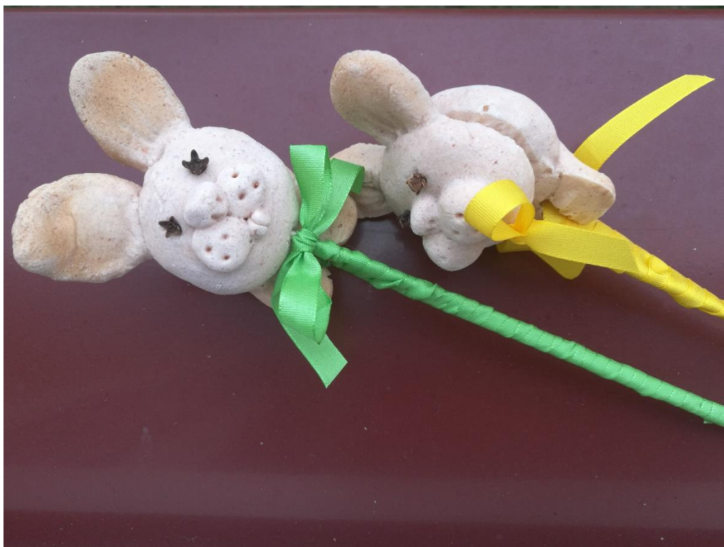
Obr. č. 21 – Zápich ze slaneého těsta. Fotografie.