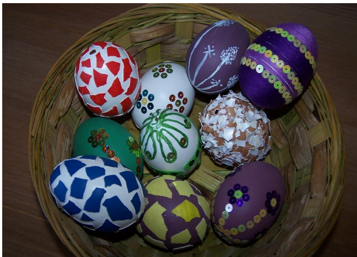
Obr. č. 28 – Ukázka zdobení vyfouklých vajec. Fotografie.