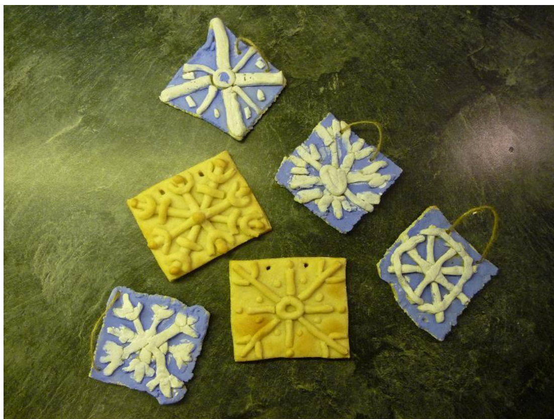
Obr. č. 30 – Kachle ze slaného těsta. Fotografie.