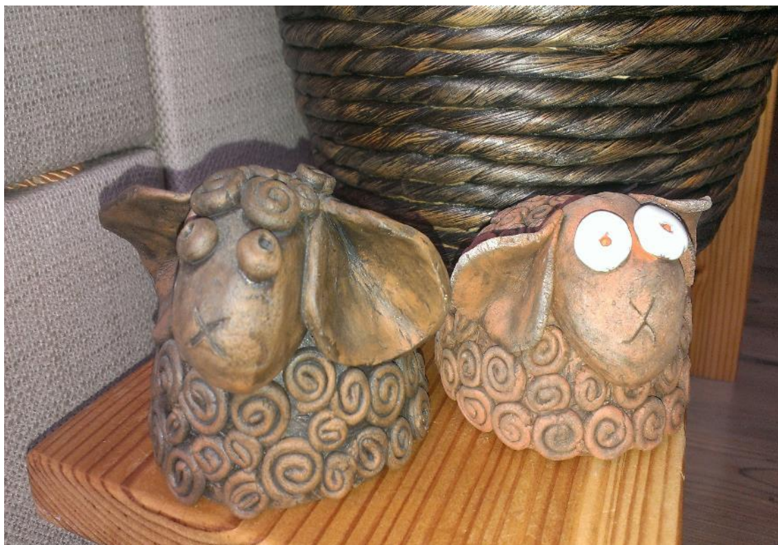
Obr. č. 29 – Beránek, keramika. Fotografie.