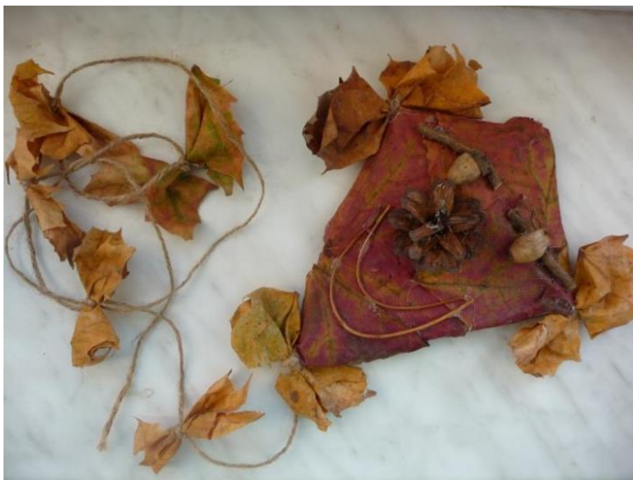
Obr. č. 1 – Podzimní drak z přírodnin. Fotografie.