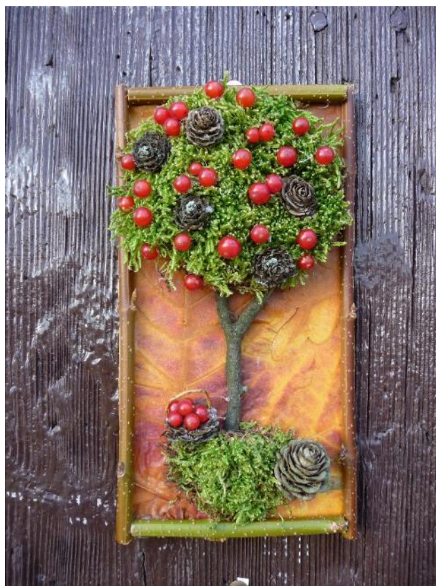
Obr. č. 16 – Obrázek z mechu – sklizeň. Fotografie.