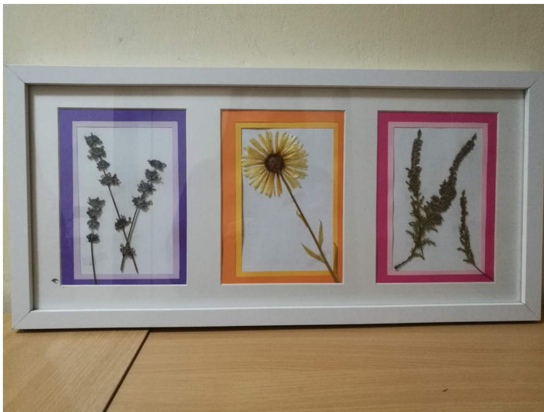
Obr. č. 23 – Herbář – obraz, Filipojakubská noc. Fotografie.