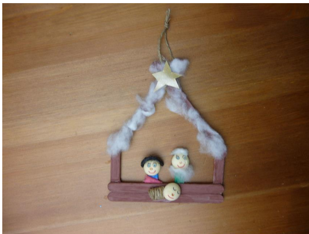
Obr. č. 24 – Betlém z klacíků. Fotografie.