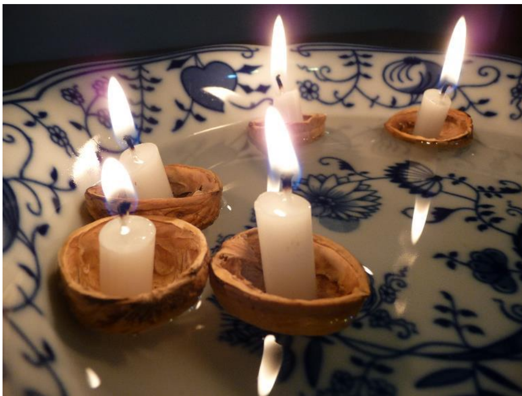
Obr. č. 7 – Lodičky ze skořápek. Fotografie.