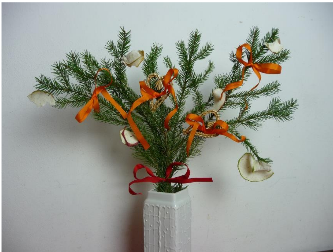
Obr. č. 17 – Polazy. Fotografie.