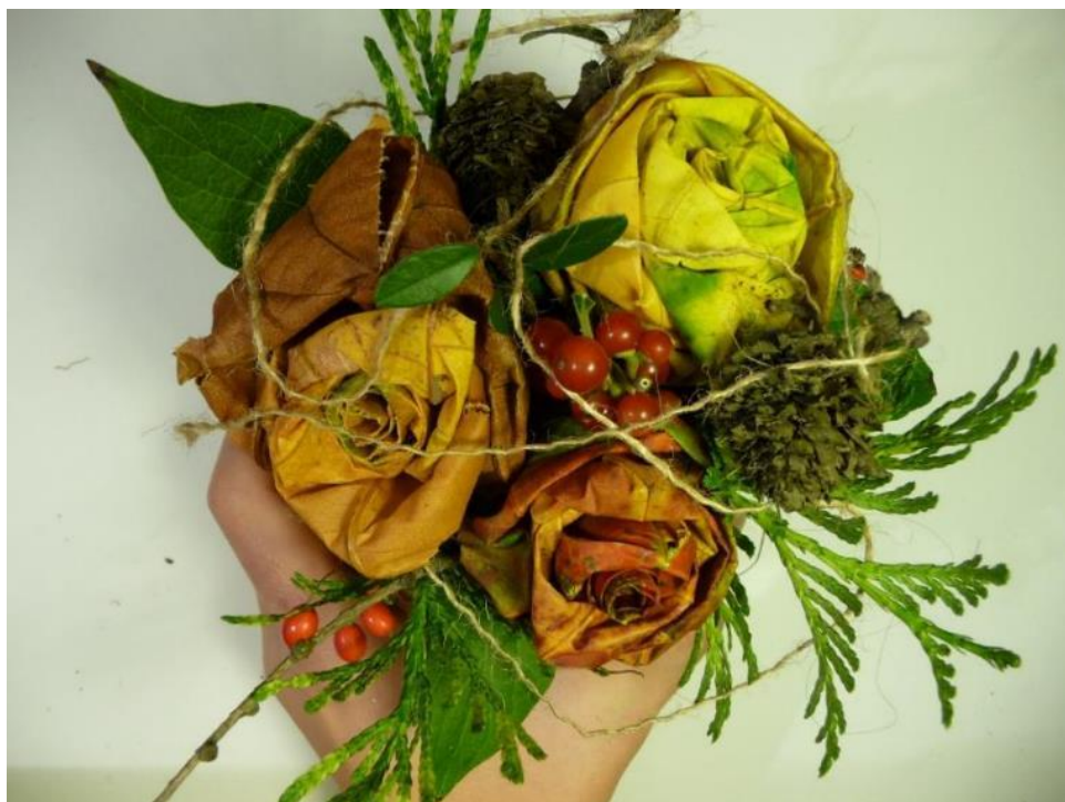
Obr. č. 3 – Květinové aranžmá z listů a přírodnin. Fotografie.