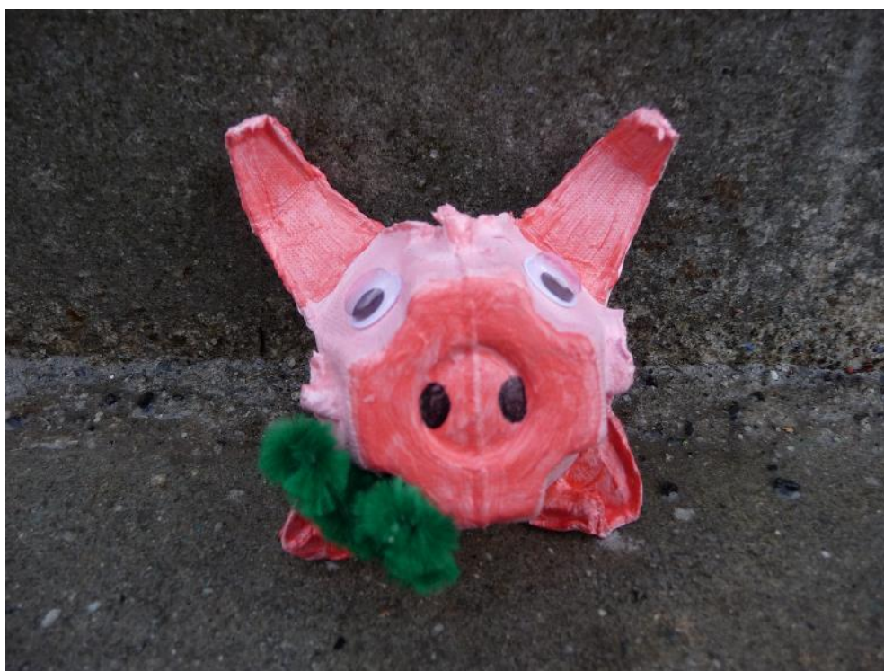
Obr. č. 20 – Prasátko pro štěstí – Nový rok. Fotografie.