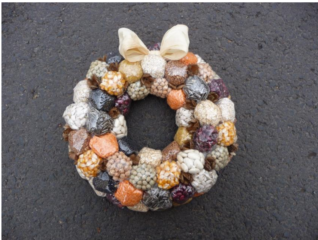
Obr. č. 5 – Staročeský věnec. Fotografie.