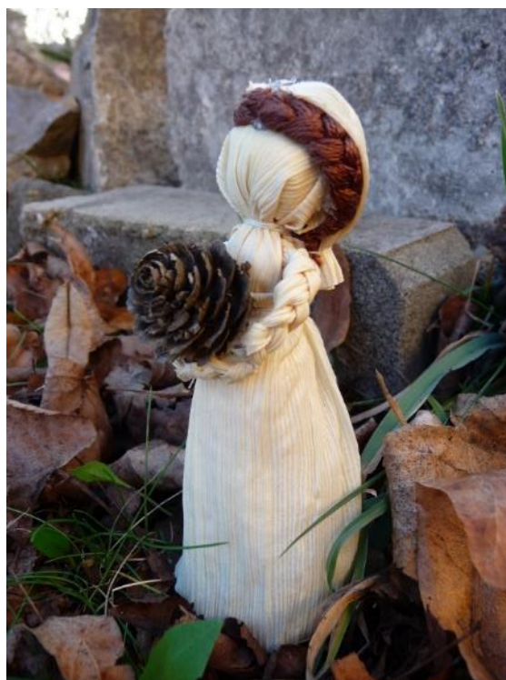
Obr. č. 2 – Panenka z kukuřičného šustí. Fotografie.