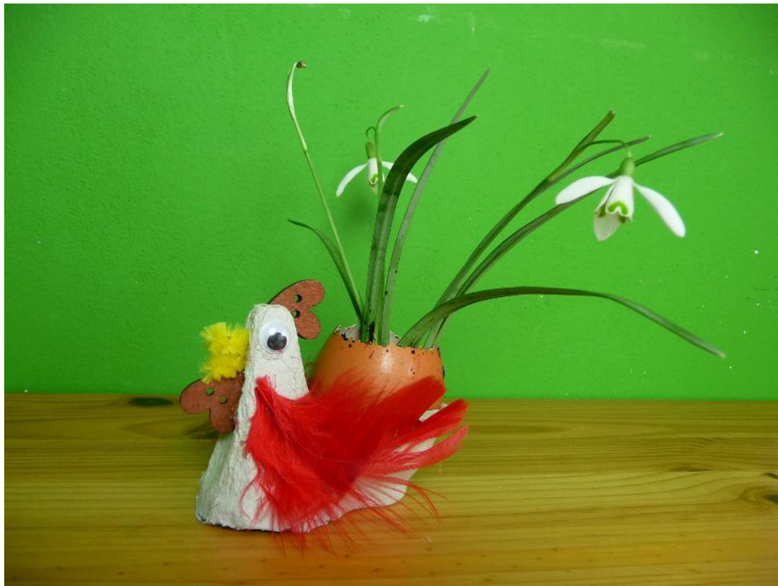
Obr. č. 14 – Vázička na sněženku. Fotografie.