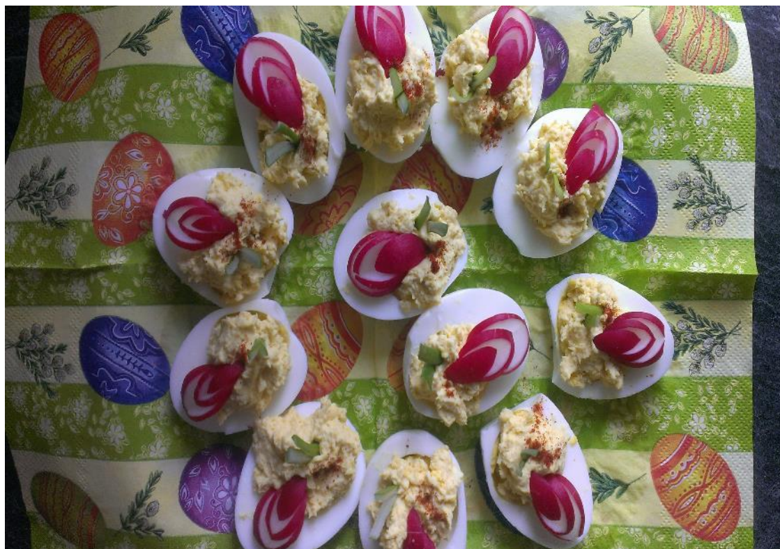
Obr. č. 27 – Velikonoční vajíčka – plněná. Fotografie.