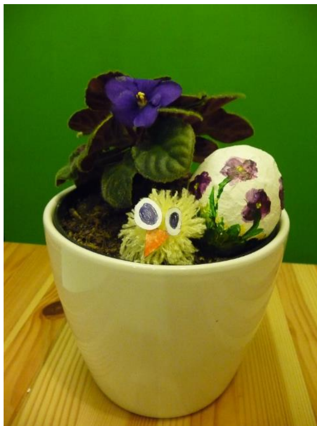
Obr. č. 15 – Kuřátko z bambule. Fotografie.