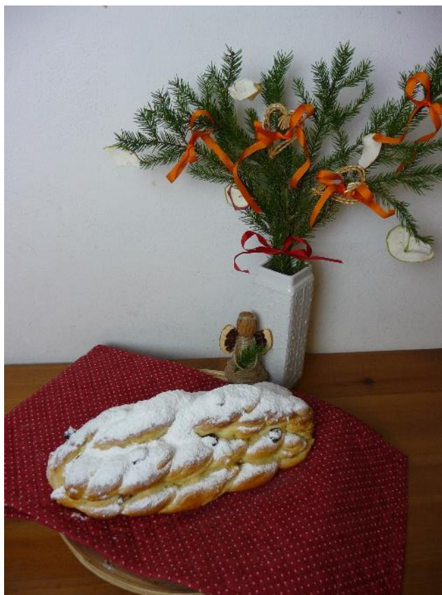
Obr. č. 25 – Vánočka. Fotografie.