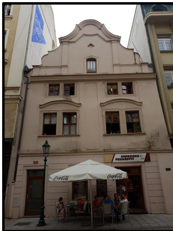
Příloha č. 10 – Pamětní deska Matouše Mandla v Riegrově ulici. 176