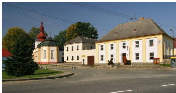
Obr. č. 3. Obec Rynárec

Obec Rynárec leží v západní části Českomoravské vrchoviny v nadmořské výšce 520 m.n.m. s katastrální územím o rozloze 598 ha. Podle posledního sčítání lidí v obci žije 601 obyvatel. Jedná se o obec I.stupně, kde hlavní kulturní dominantou je kostel zasvěcený sv. Vavřinci. 84