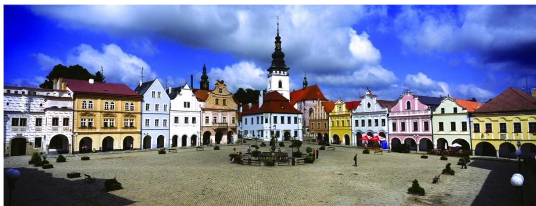
Obr.č.4. Město Pelhřimov