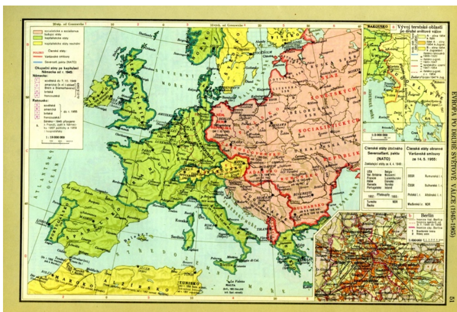
Obrázek 1 Mapa – Evropa po 2. světové válce (1945–1965)

byl odmítnut sovětským ministrem zahraničí Molotovem a jeho týmem 80 poradců (Bělina 2002).