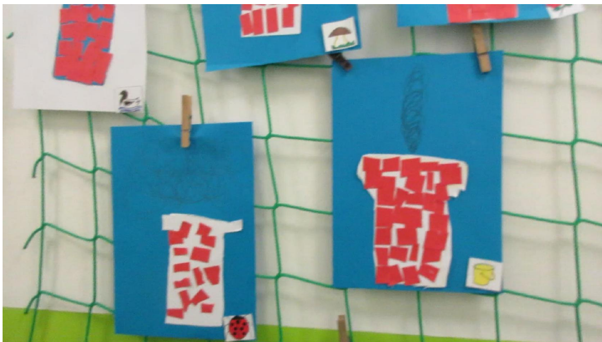
Příloha č. 13 – Obrázek komína a kouře 79