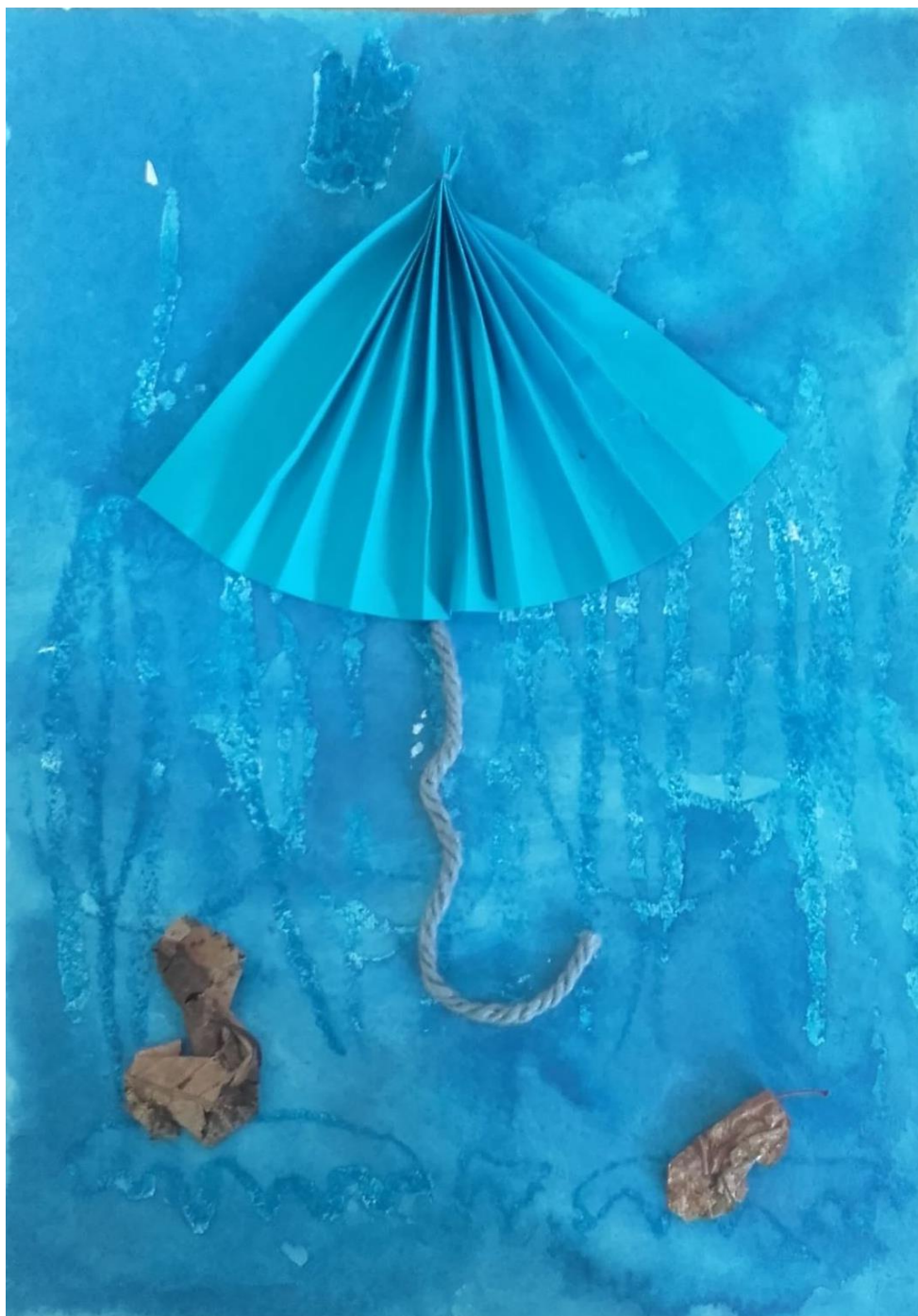
Příloha č. 8 – Výrobek k tématu „Podzimní počasí“ 74