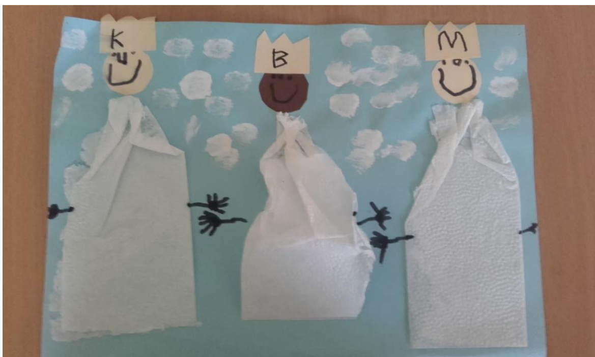
Příloha č. 15 – Obrázek tří králů 81