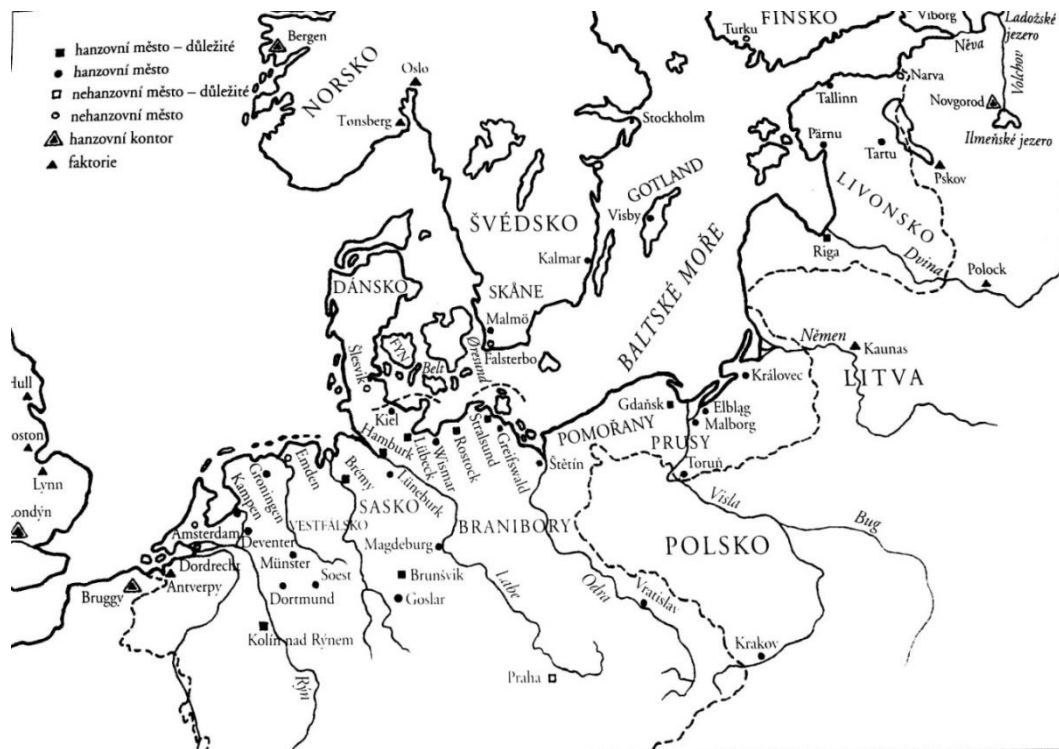
Mapa hanzovních měst, kontorů a faktorií

(Zimák, A. (2002) Hanza. Obrazy z dějin severského námořního obchodu . Praha: Libri. ISBN 80-7277-107-8, 47 s.)