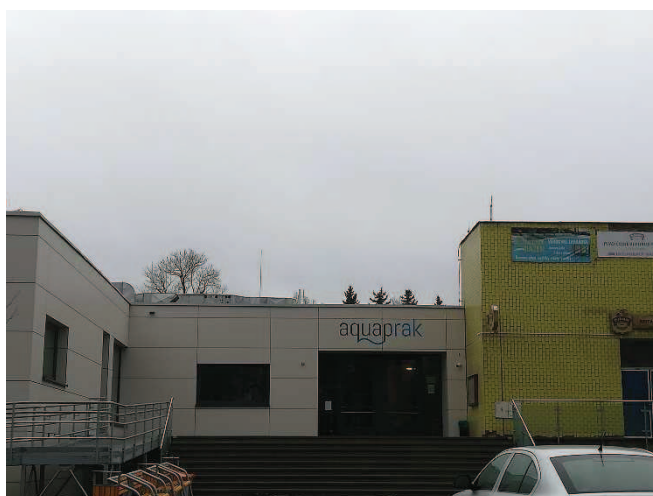
Obr. Aquapark