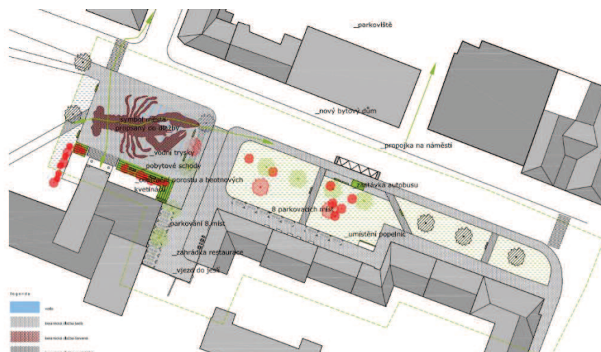
Obr. Verze č. 2 – podoba prostranství před městskou knihovnou