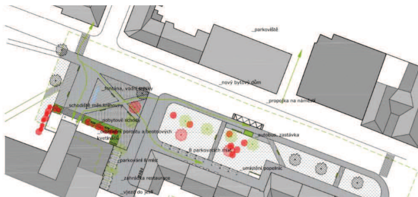
Obr. Verze č. 1 – podoba prostranství před městskou knihovnou