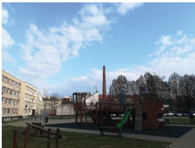
Obr. Veřejné prostranství v ulici Palackého u náměstí