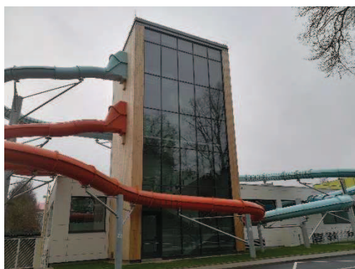
Obr. Aquapark