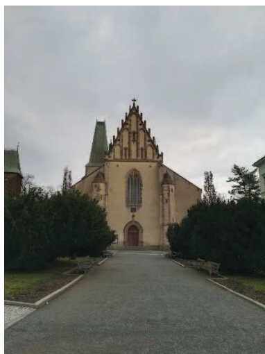
Obr. Kostel sv. Bartoloměje

Rakovník je dnes důležitým obchodním, správním, průmyslovým, sportovním a kulturním městem a zároveň obec s rozšířenou působností. Ve městě se nachází mnoho památek. Mezi nejznámější památky města patří Vysoká a Pražská brána, kostel sv. Bartoloměje se zvonící, Husovo náměstí, kostel sv. Jiljí, kostel Nejsvětější trojice, barokní radnice na náměstí a morový sloup atd. Nachází se zde též 7 mateřských škol, 3 základní školy, gymnázium Zikmunda Wintra a 4 další střední školy, seznam škol uzavírá 1 speciální škola.