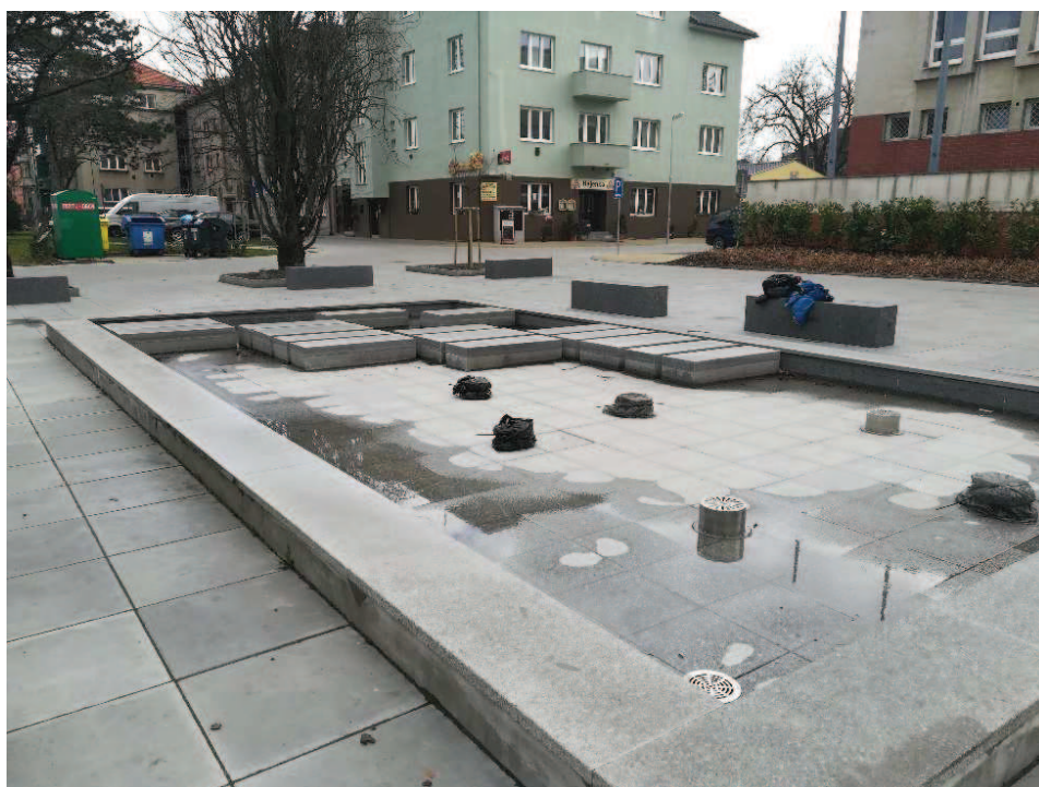
Obr. Podoba fontány před městskou knihovnou (zdroj: autor, vyfotografováno dne 7. 3. 2020)