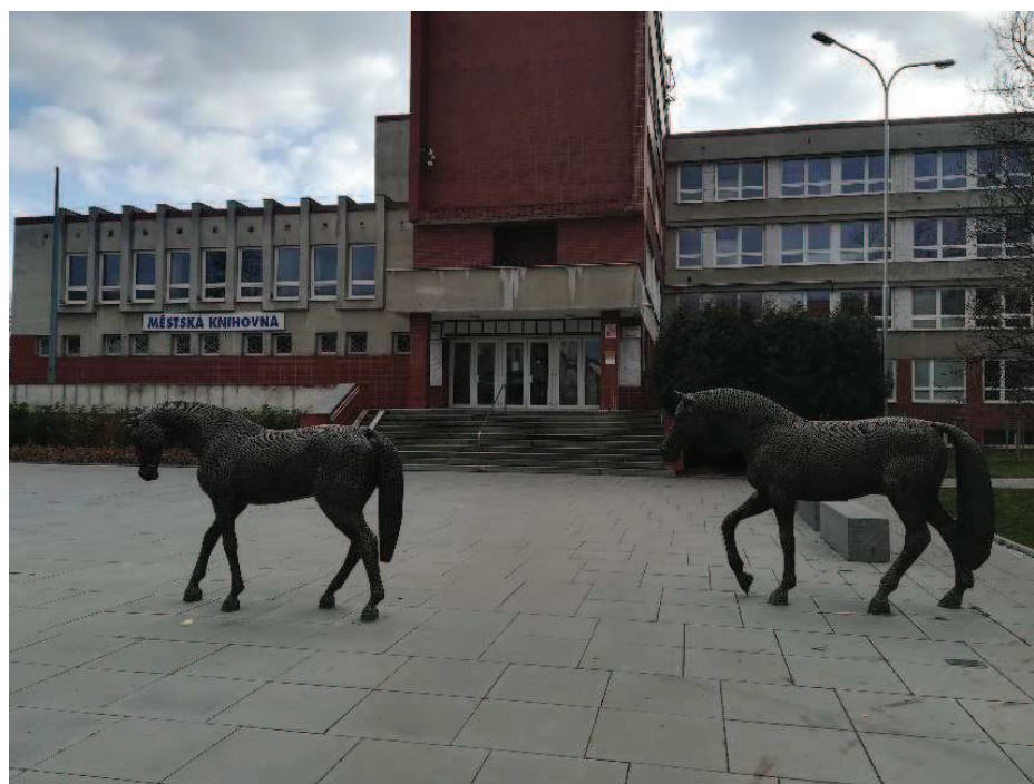
Obr. Bronzoví koně před městskou knihovnou (nalevo je postavena fontána)

Na seznamu Městské knihovny Rakovník je i roubenka Lechnýřovna, která po opravě a slavnostním otevření v roce 2012 slouží jako muzeum a místo, kde dochází zejména ke čtenářským akcím zaměřených na děti.