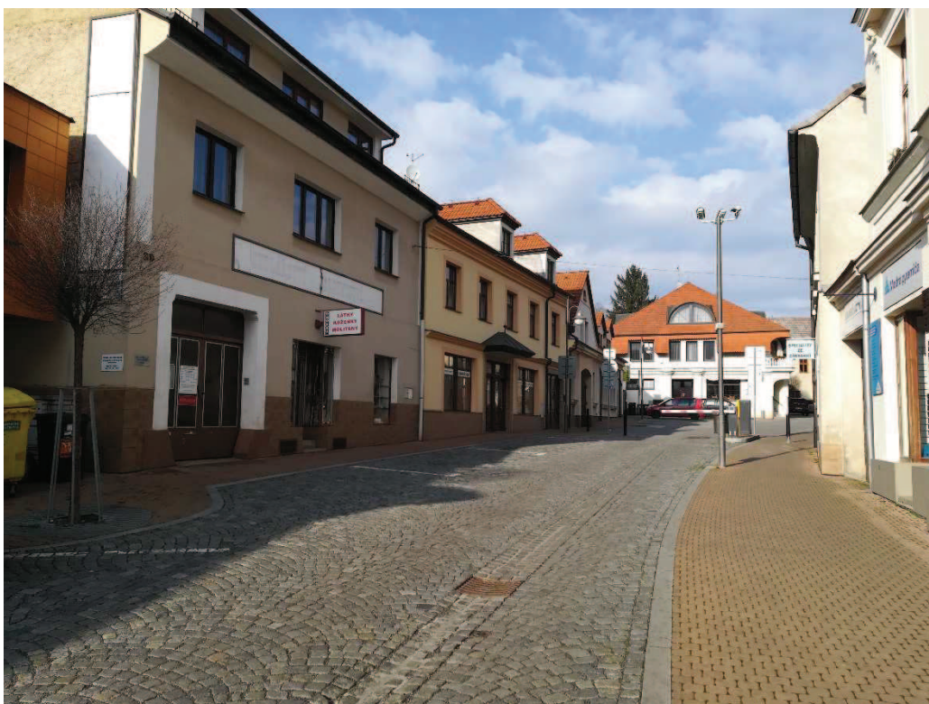
Obr. Vysoká ulice