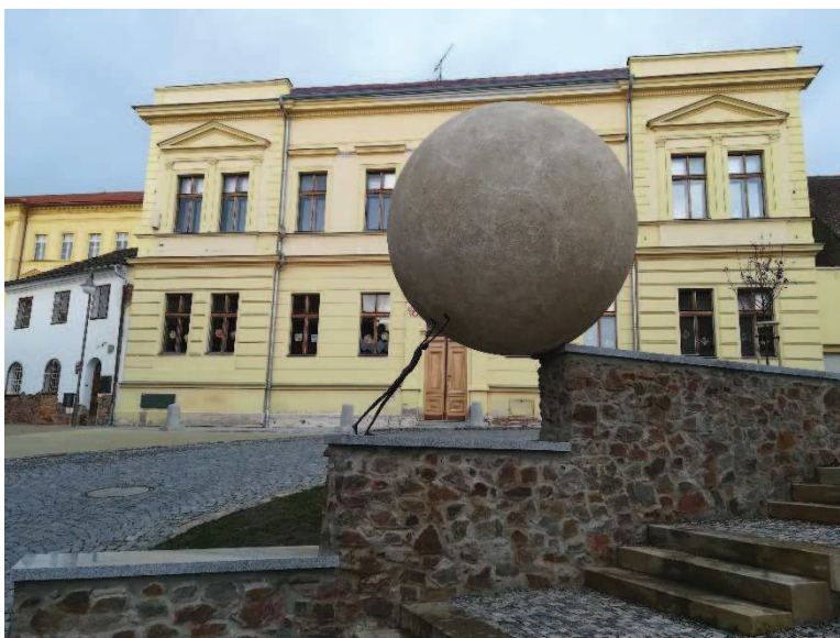
Obr. Sysifos před rakovnickým gymnáziem