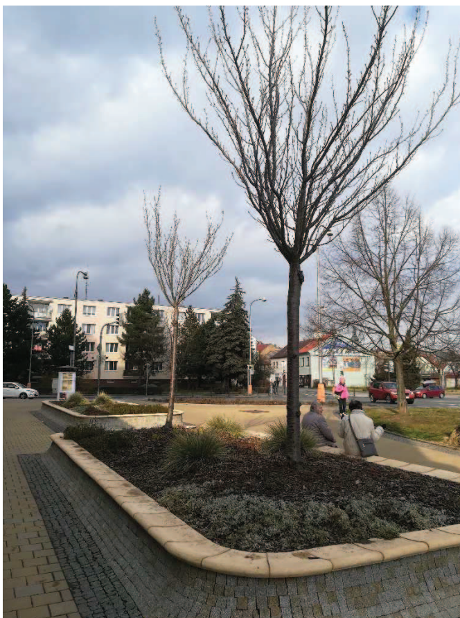
Obr. Na Váze