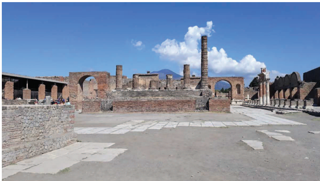
Obr. Veřejné prostranství Pompejí

část města Catanie. 70 Asi nejznámější je zničení města Pompeje Vesuvem v roce 79 n. l. Povodně v roce 2013 zasáhly značnou část České republiky. Město Christchurch na Novém Zélandu se potýká s častými zemětřeseními. 71