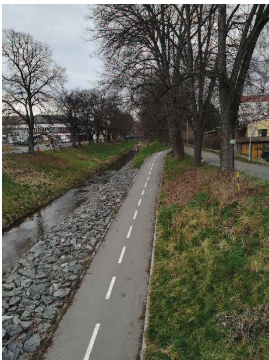
Obr. Cyklostezka (zdroj: autor)