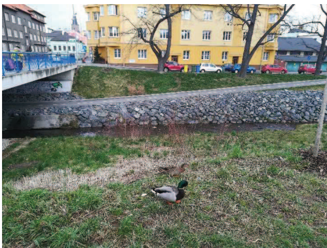
Obr. Cyklostezka