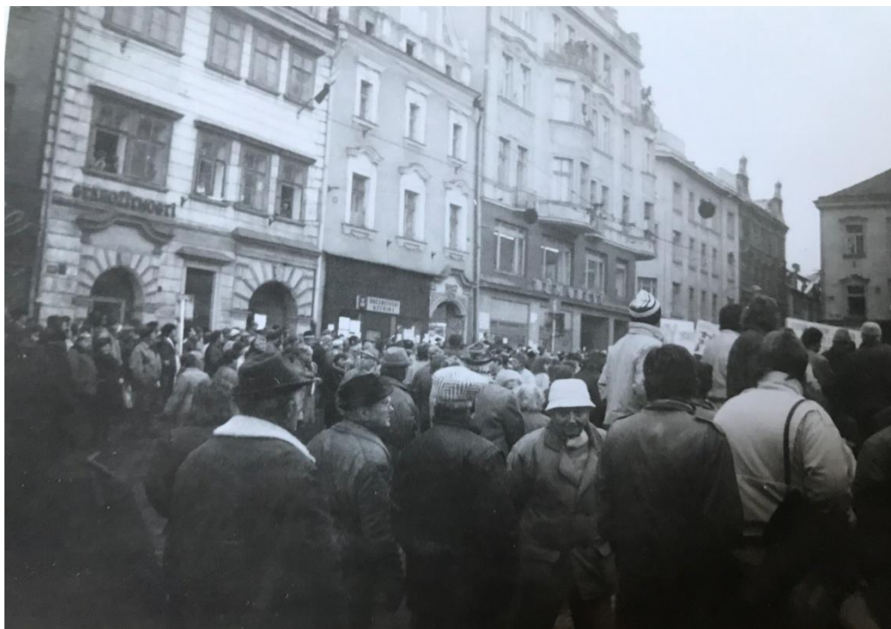
Obrazová příloha č. 5 – Účastníci plzeňských listopadových demonstrací, náměstí Republiky 1989. 265