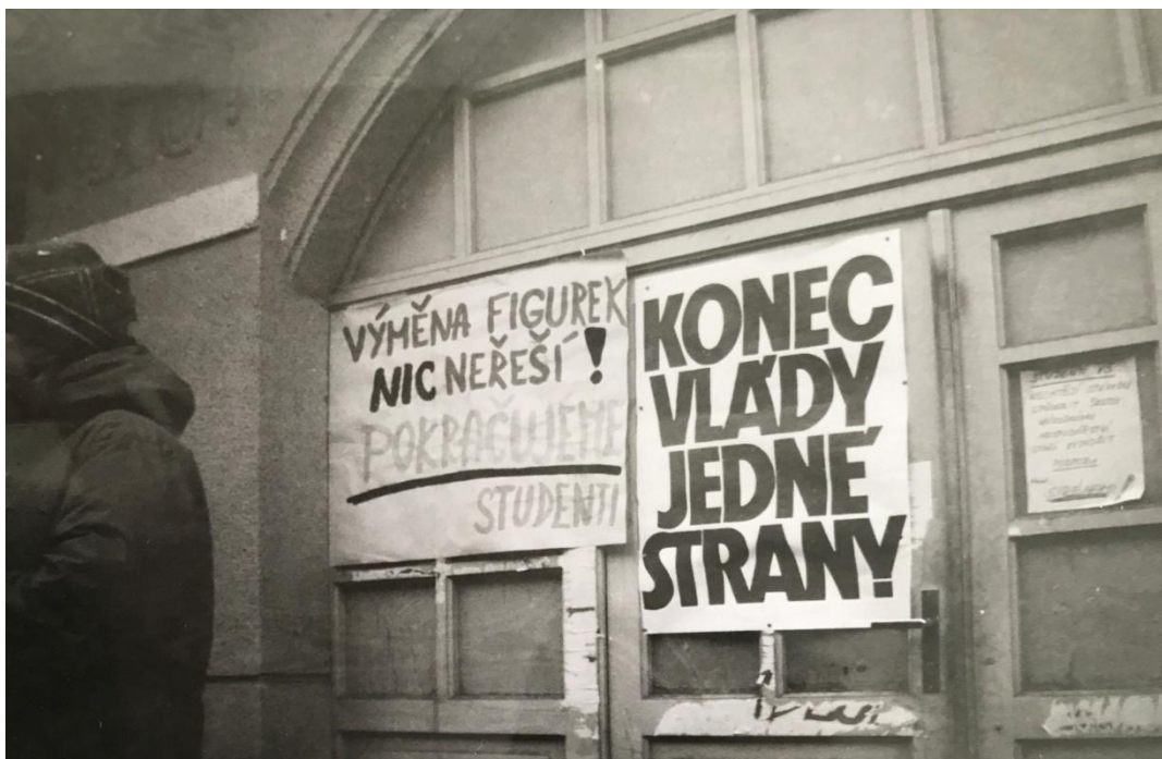
Obrazová příloha č. 1 – Plakáty vylepené v okolí centra Plzně, listopad 1989. 261