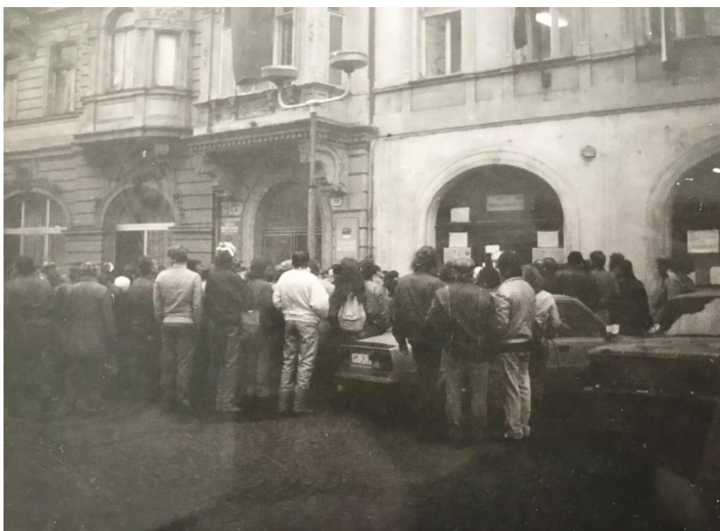
Obrazová příloha č. 4 – Občané pročítající vyvěšené letáky v Plzni, listopad 1989. 264