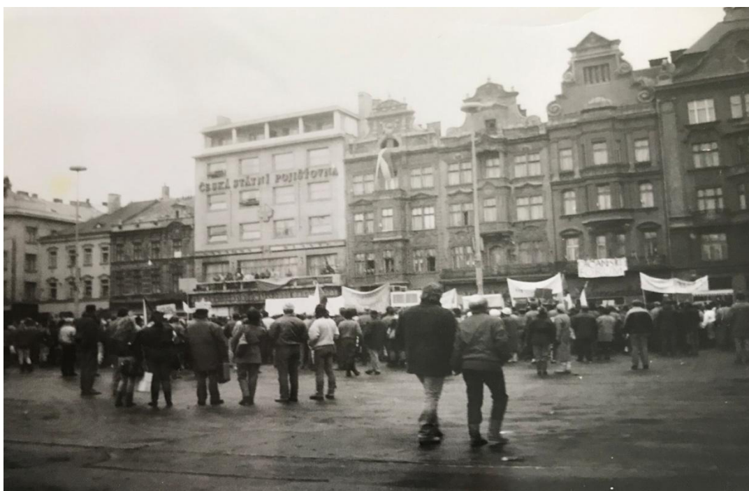
Obrazová příloha č. 2 – Demonstrace na náměstí Republiky v Plzni během listopadových dní 1989. 262