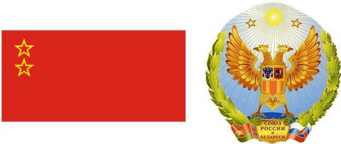
Obrázek 4: Návrh vlajky a erbu Svazu Ruska a Běloruska