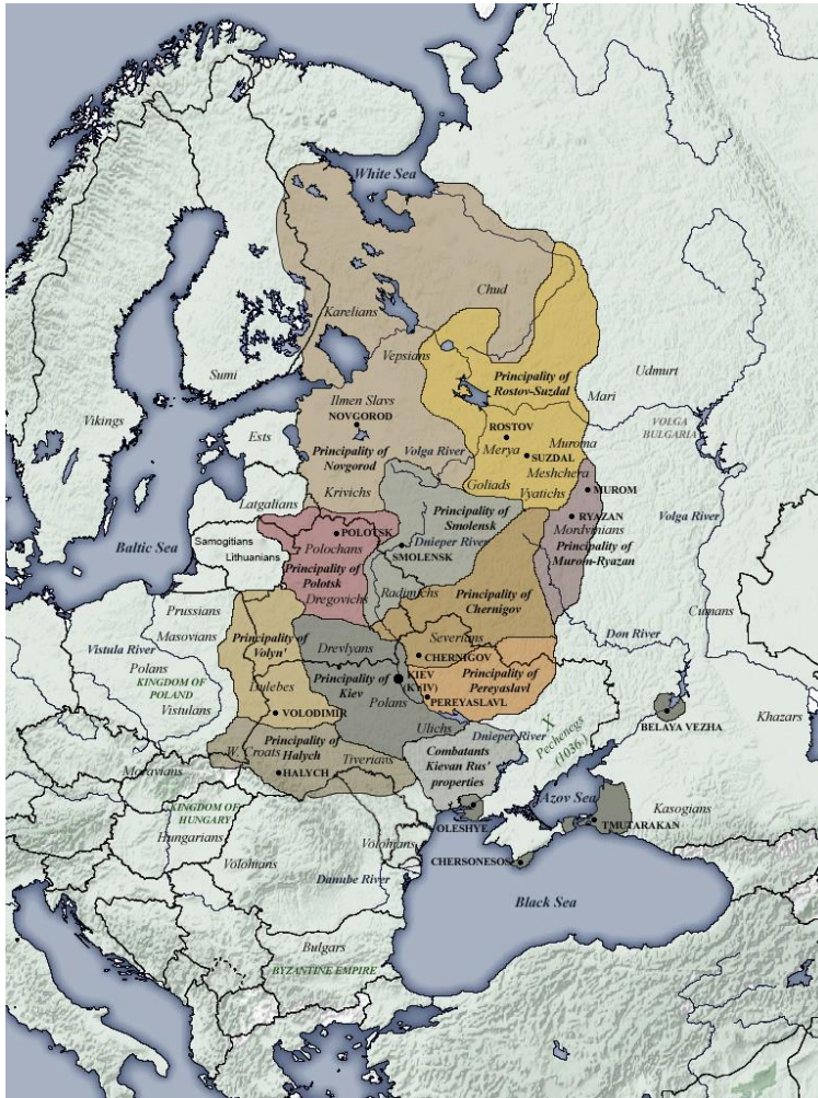
Obrázek 2: Mapa Kyjevské Rusi