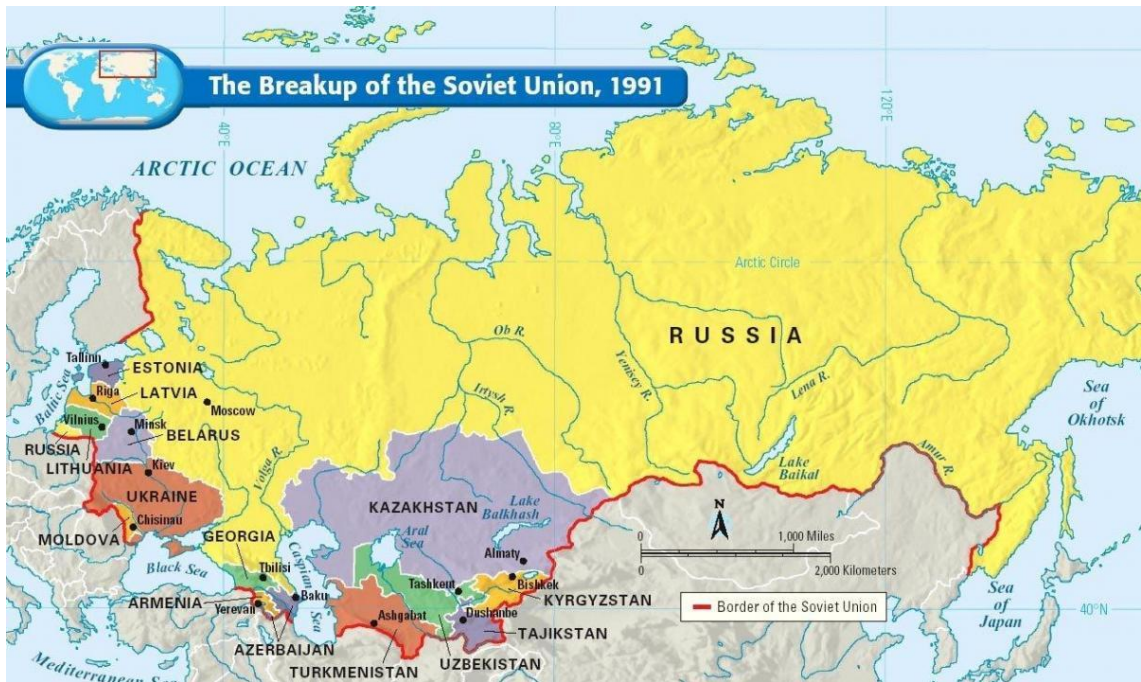
Obrázek 1: Mapa rozpadu Sovětského svazu v roce 1991