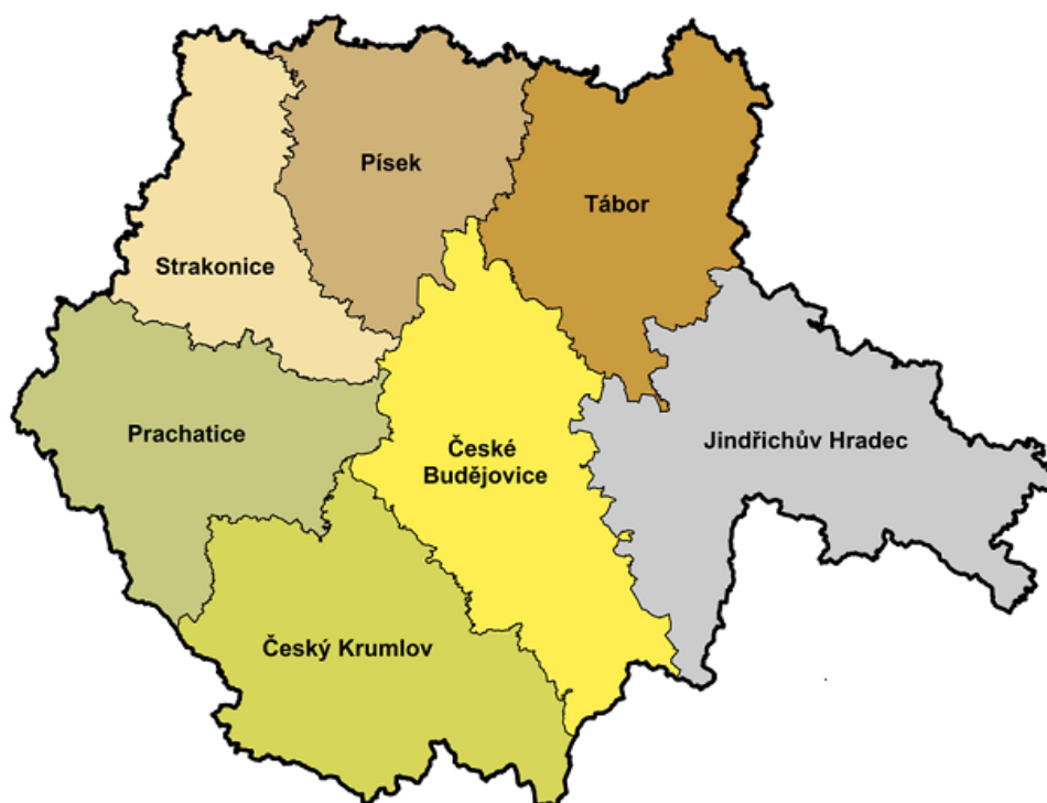
Obrázek 2: Mapa okresů Jihočeského kraje

Obrázek 2 znázorňuje geografické postavení a rozmístění okresů v Jihočeském kraj.