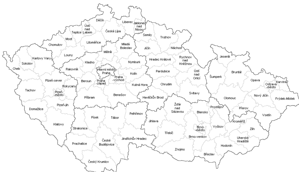
Obrázek 1: Okresy a kraje v územním členění České republiky

Každý kraj je tvořen okresy. V prosinci 2002 byla ukončena činnost okresních úřadů a okresy fungují již jen jako územní jednotky. V současné době je na území České republiky celkem sedmdesát sedm okresů (viz obrázek1, zdroj 13 ).