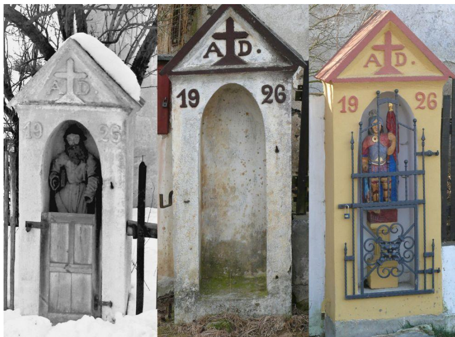
Obr. 5- Kaple u ohradní zdi (1970, 2011, 2013). Josef Hanzlík