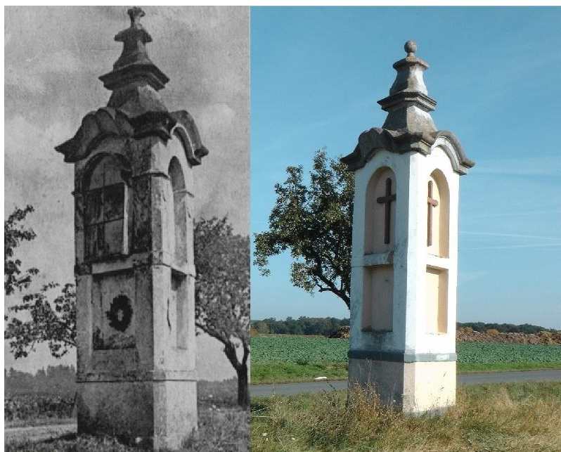
Obr. 3- Boží muka u cesty směrem k obci Hunčice (1926 a 2013).