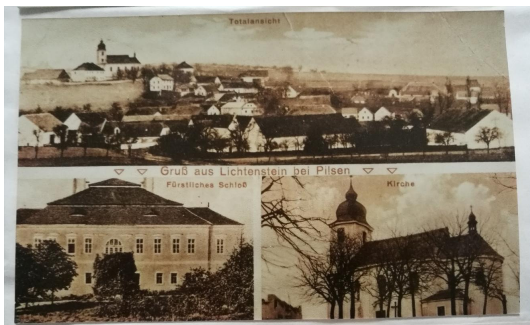
Obr. 1- Historická pohlednice obce Líšťany.