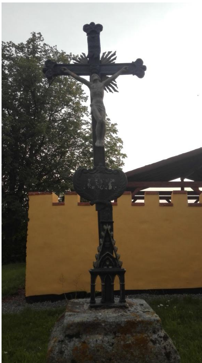
Obr. 8- Pamětní kříž u kostela.