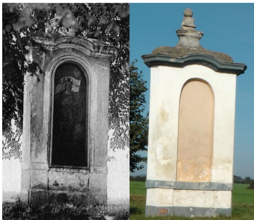
Obr. 4- Boží muka na rozcestí (1926 a 2013). Josef Hanzlík