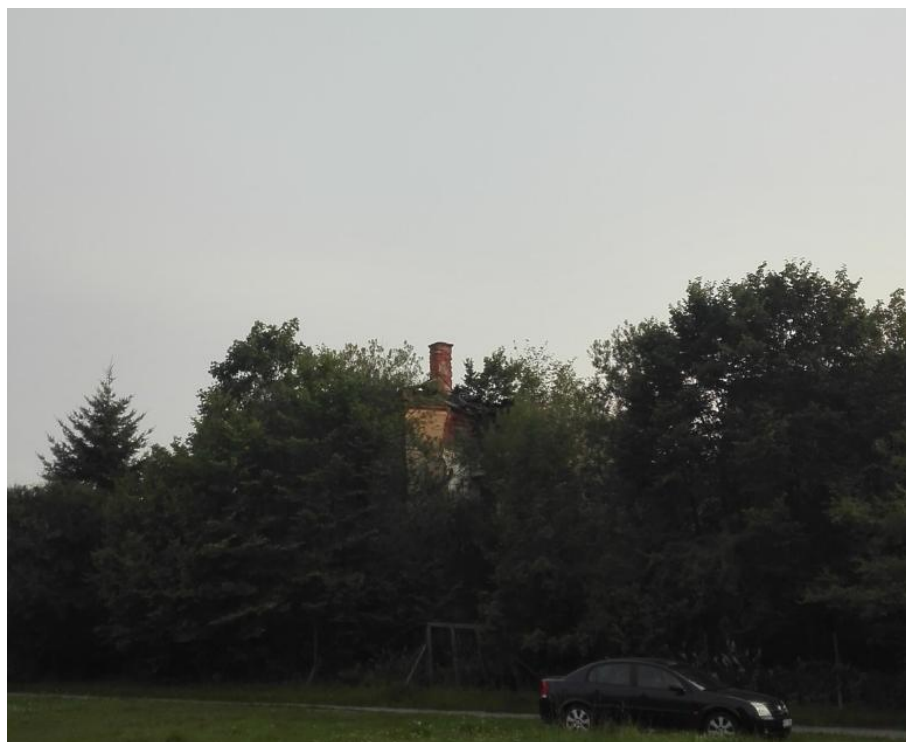
Obr. 15- Severní stěna zámku, pohled z panství.