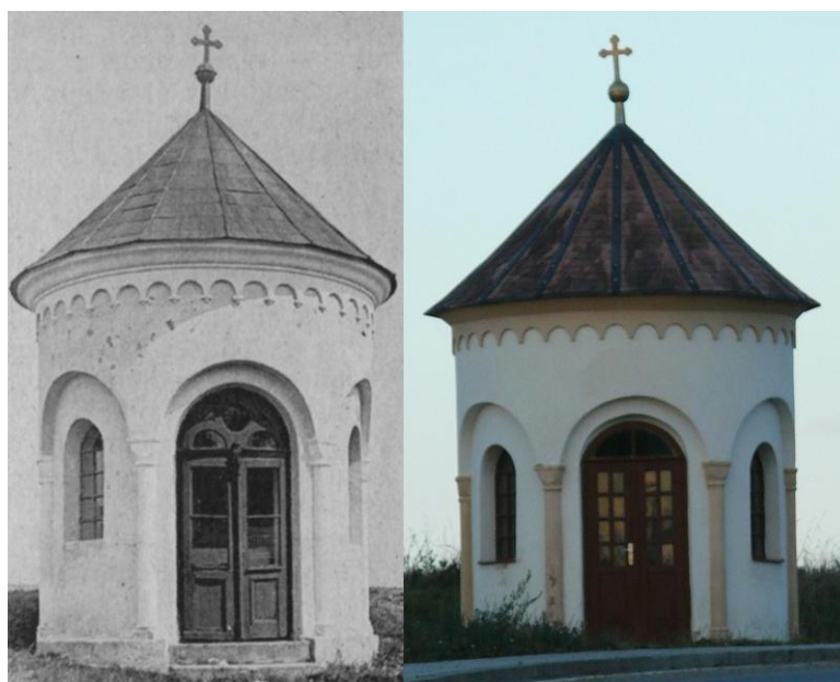
Obr. 2- Drobná kaple u cesty směrem k obci Hunčice (1926 a 2013). Josef Hanzlík