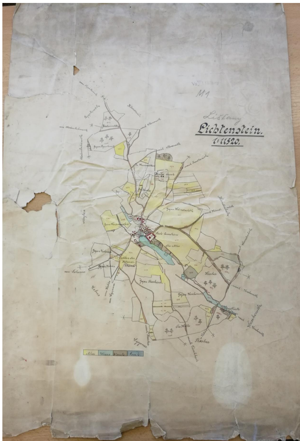
Obr. 17- Situační plán dvora a pozemků v obci Lištiny z konce 19. století.