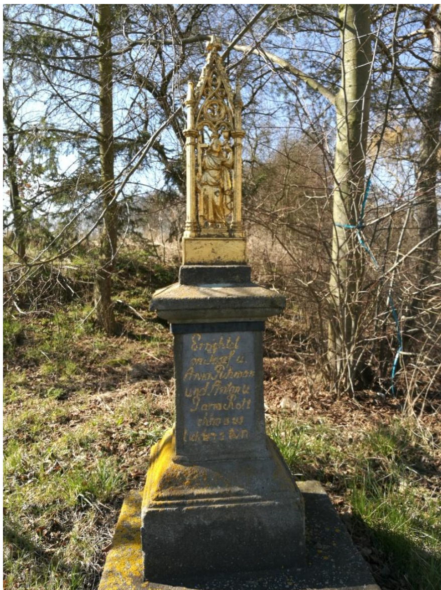
Obr. 9.- Pamětní kříž zvaný u Puhmanů.