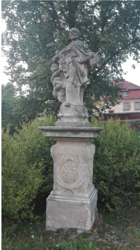
Obr. 7- Socha sv. Jana Nepomuckého.