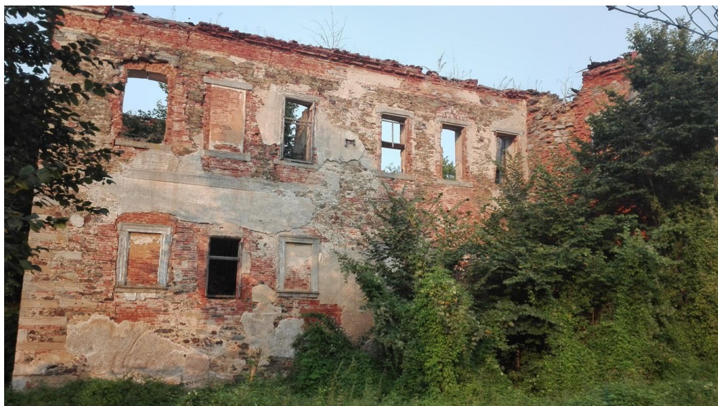
Obr. 13- Jižní stěna barokního zámku.