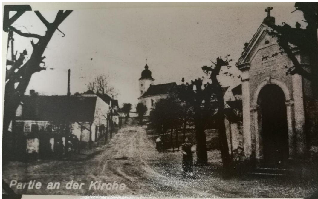
Obr. 10- Historická pohlednice nedochované kaple u cesty pod kostelem sv. Petra a Pavla.