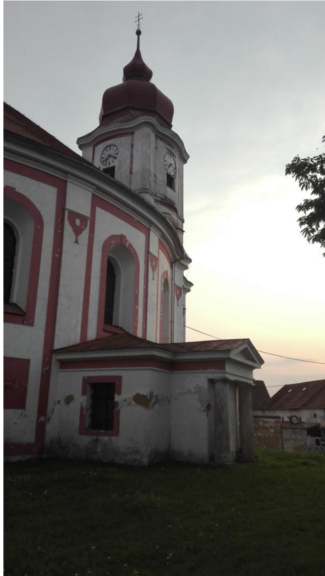
Obr. 12- Boční stěna kostela s kaplí rodu Steinbachů a věží.