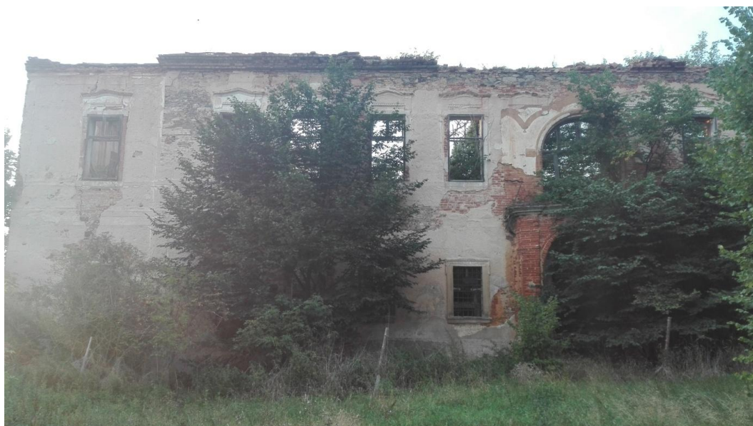
Obr. 14- Západní stěna zámku s poničeným balkónem.