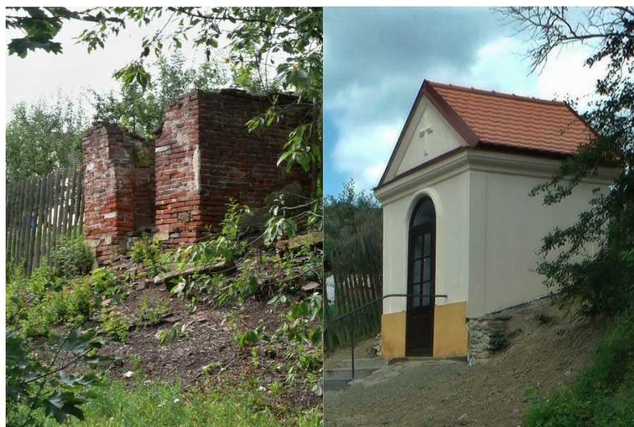
Obr. 6- Kaple u školy (2010 a 2013).