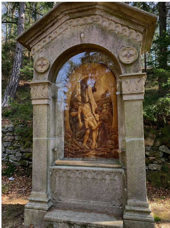
Příloha č. 5: Křížová cesta v Nejdku, XIII. zastavení Ježíšovo tělo snato z kříže