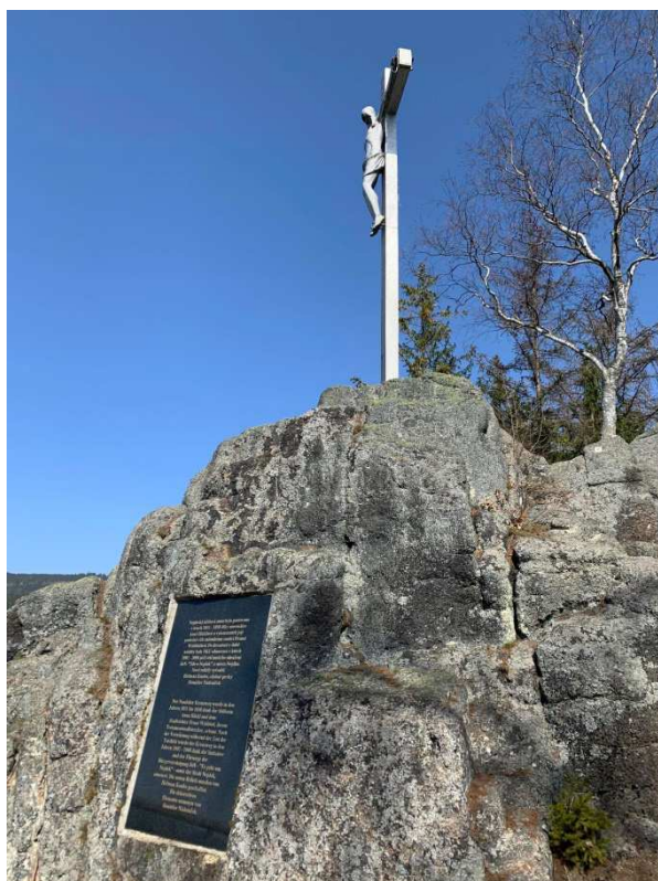
Příloha č. 6: Křížová cesta v Nejdku, železný krucifix na konci cesty