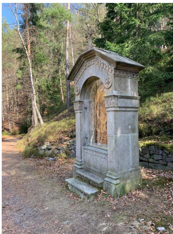
Příloha č. 4: Křížová cesta v Nejdku, X. zastavení Ježíš zbaven šatu