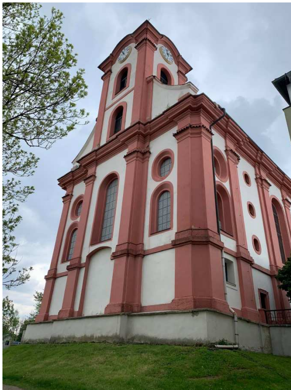
Příloha č. 1: Kostel svatého Vavřince v Chodově