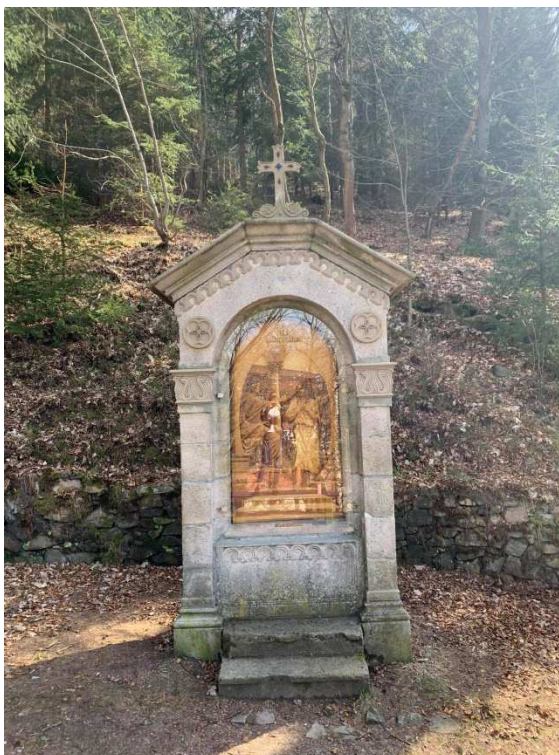
Příloha č. 3: Křížová cesta v Nejdku, I. zastavení Ježíš souzen Pilátem