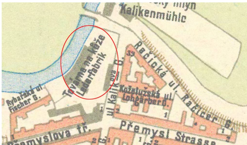
Příloha č. 5. Koželužna v Kalikově ulici . Dostupné 12. 1. 2020. Online z: https://gis.plzen.eu/staremapy/ .