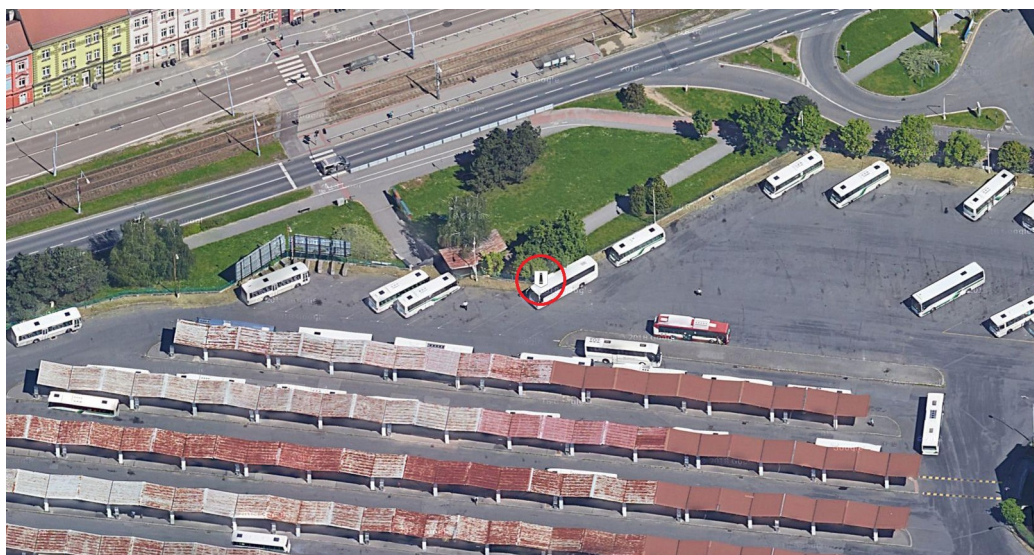
Příloha č. 14. KODA. Papírna Fürth a Gellert . Záznam z roku 2012. Dostupné 2. 5. 2020 online z: http://koda.kominari.cz/?action=karta&cislo=8115 .