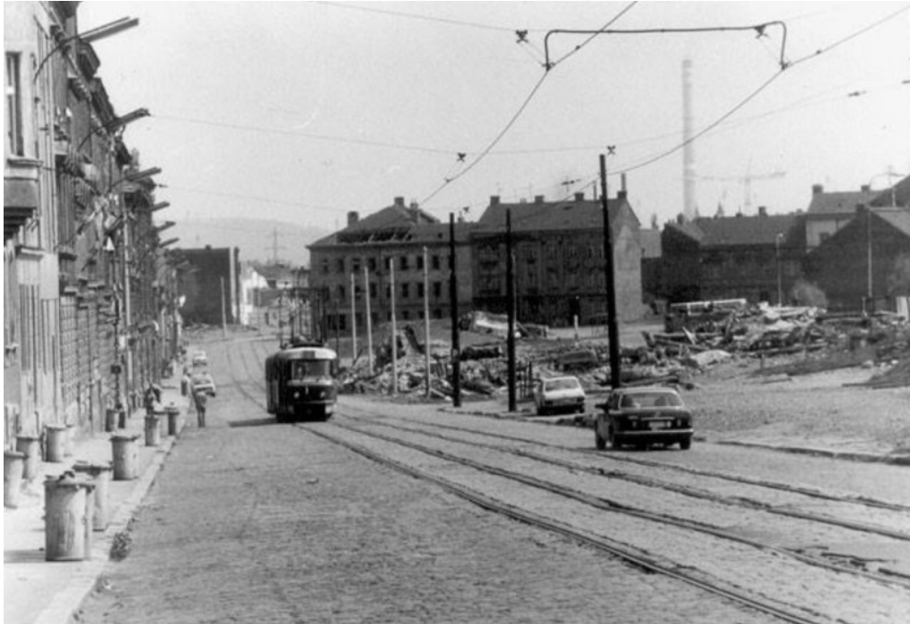
Příloha č. 7. Skvrňanská ulice po zbourání její poloviny. 2. 5. 1986. Dostupné online z: http://www.plzensketramvaje.cz/?page=provizoria.htm.