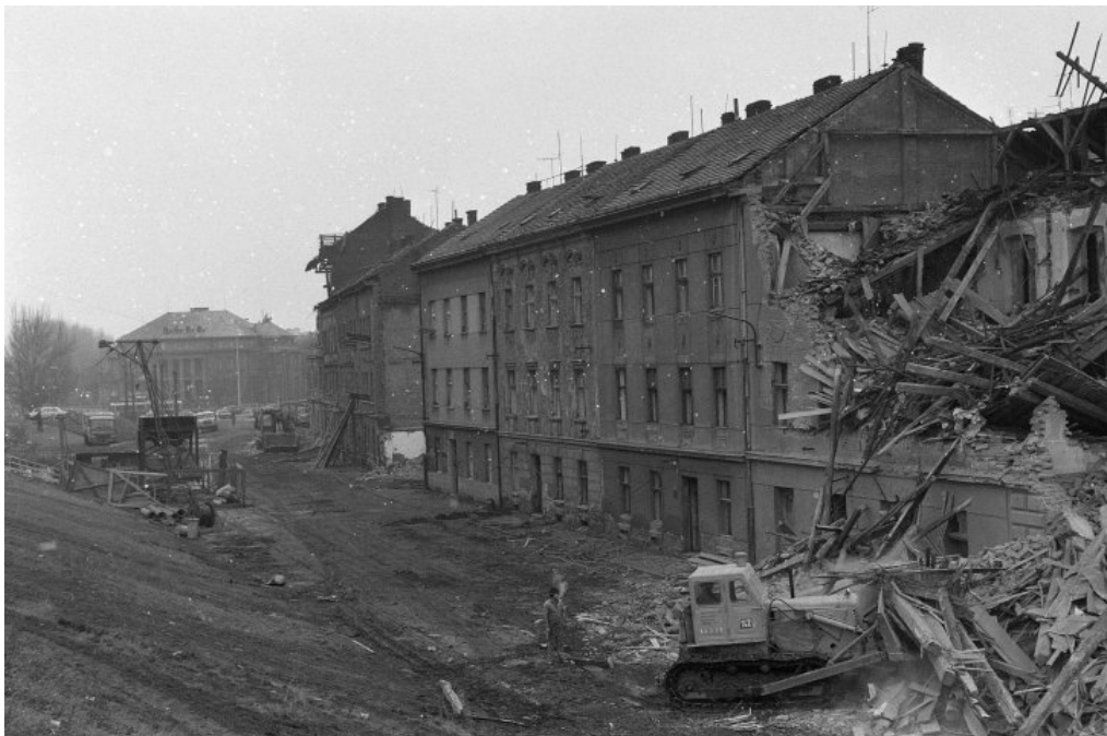
Příloha č. 8.