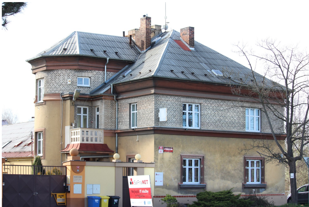
Příloha č. 11. Dům spojený s bývalou továrnou J. Hanáka . 14. března 2020.