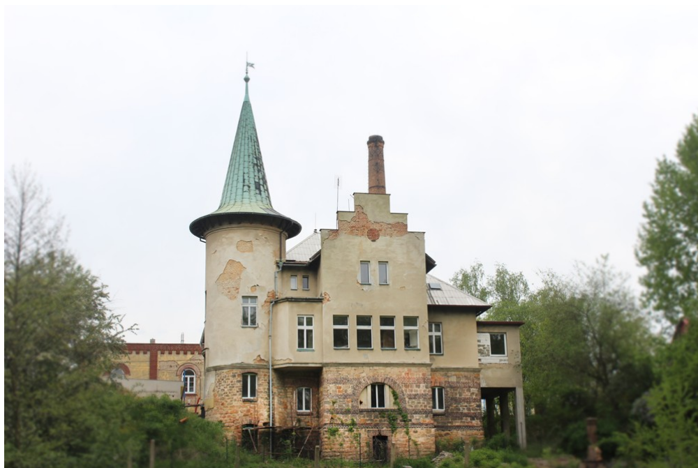
Příloha č. 15. Vila firmy Eisner & Levit . Fotografie vlastní, duben 2020.