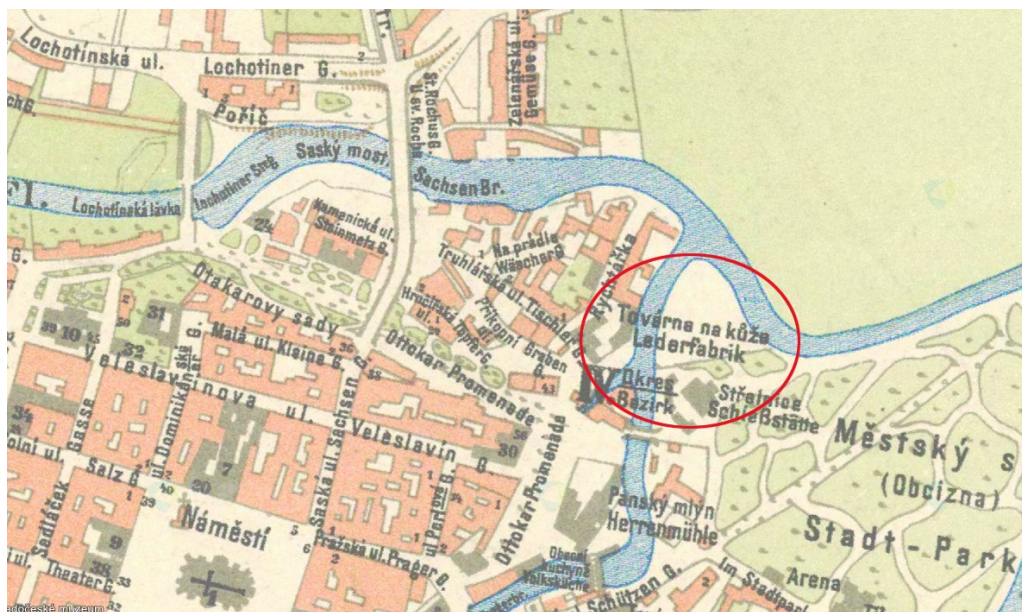
Příloha č. 1. Plán královského města Plzně, upravený městským stavebním úřadem. Dostupné 12. 1. 2020. Online z: https://gis.plzen.eu/staremapy/ .