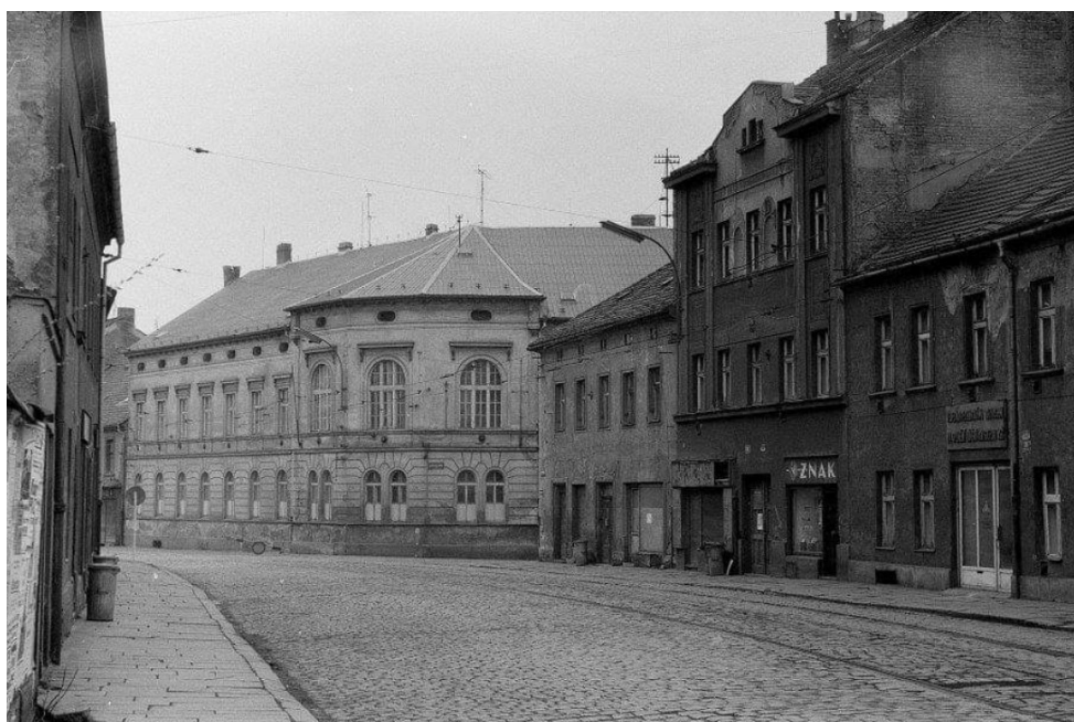
Příloha č. 6. Zaniklá Přemyslova třída, 8. dubna 1984, Plzeň. Dostupné 15. 1. 2020 online z: https://fotoalbum.plzen.eu/?cdm_page=media&id=1386.