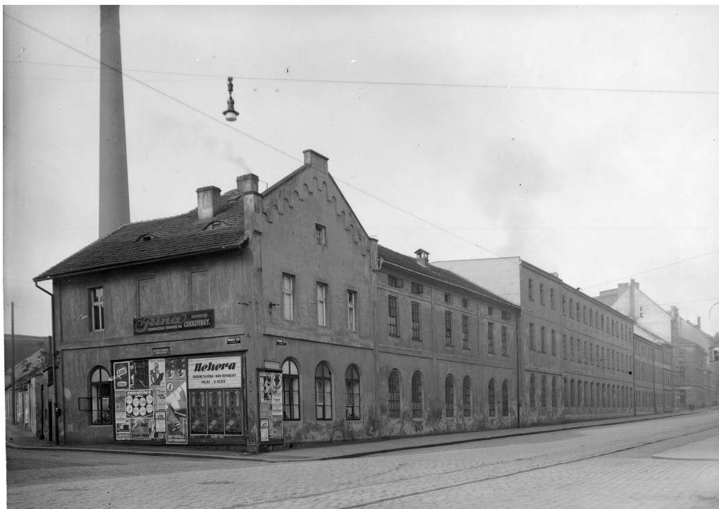
Příloha č. 13. Papírna Fürth a Gellert. Fotografie z roku 1933. Dostupné 2. 5. 2020 online z: https://plzen.rozhlas.cz/tajemstvi-stare-plzne-odkryvaji-sklenene-negativy-6737353.