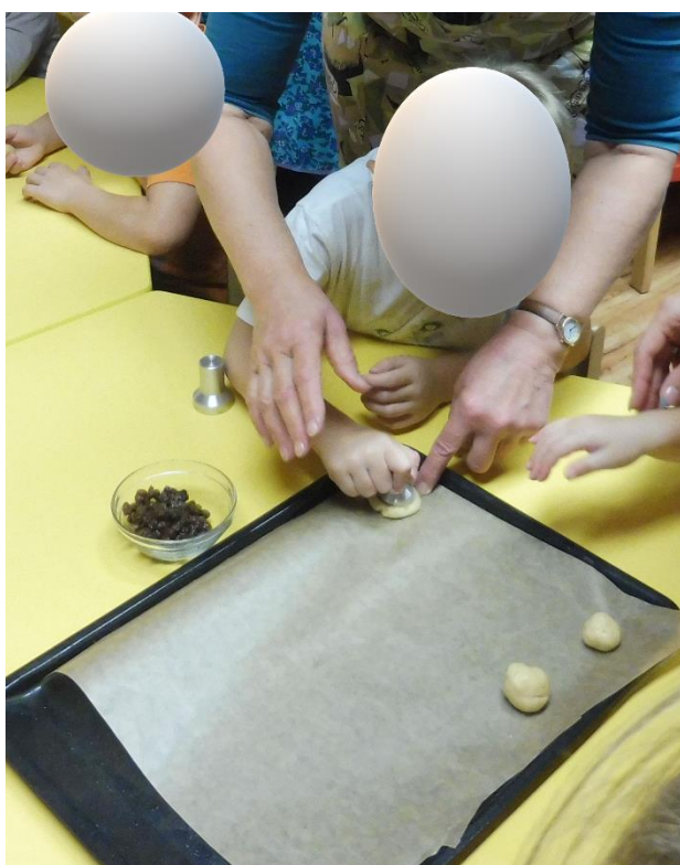
Příloha 2 – modelování koláčů pomocí razítka