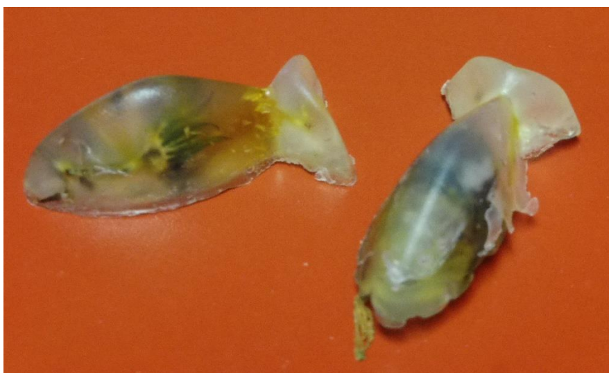
Příloha 8 – hotové mýdlo