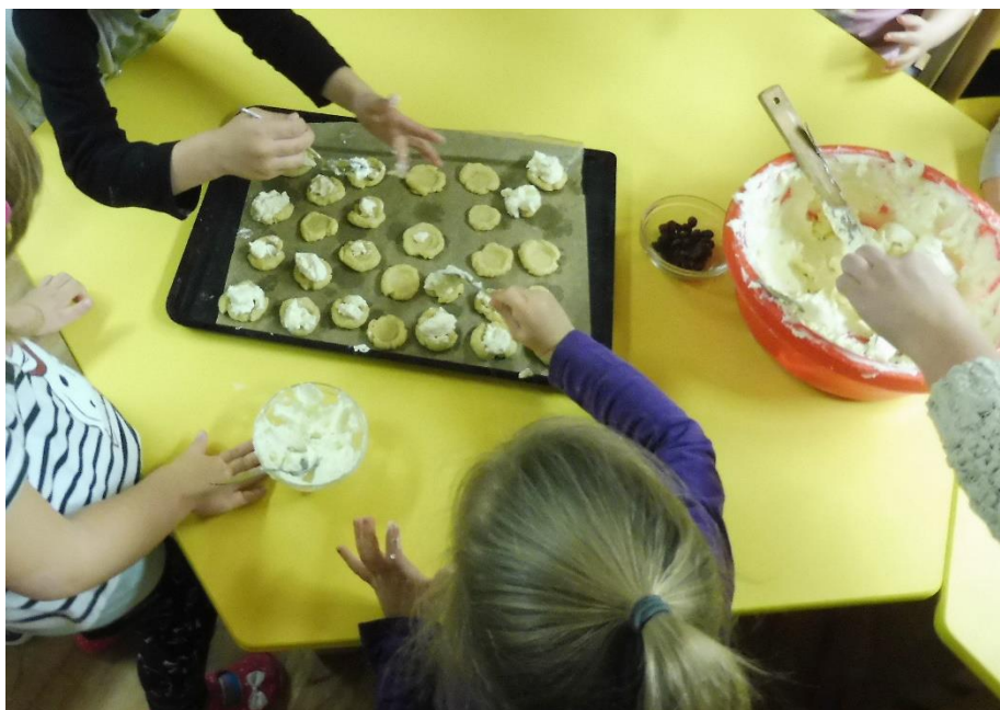
Příloha 3 – plnění koláčů tvarohovou náplní