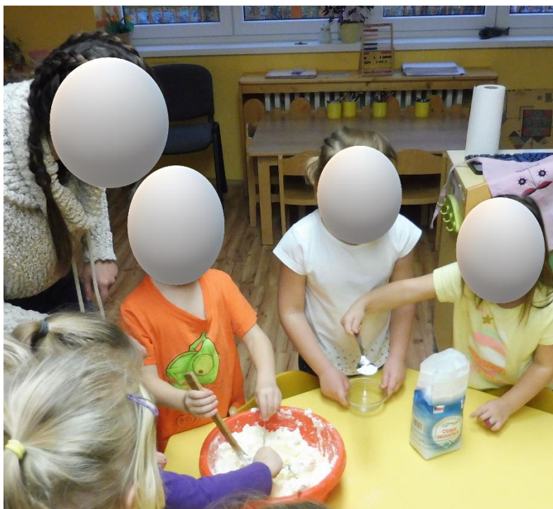
Příloha 1 - příprava náplně do koláčů