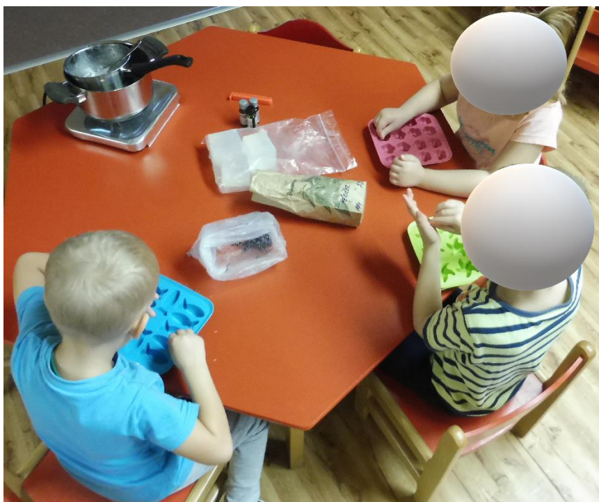
Příloha 6 – výroba mýdla se staršími dětmi