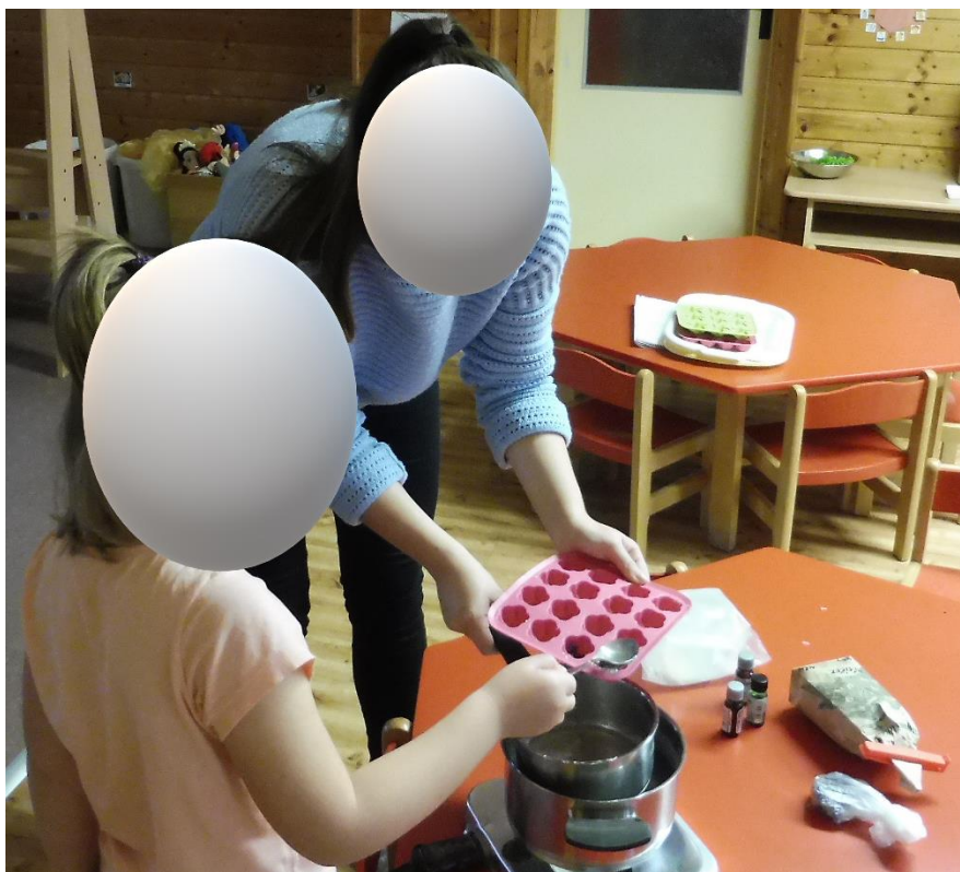
Příloha 7 – nalévání mýdlové hmoty do formiček