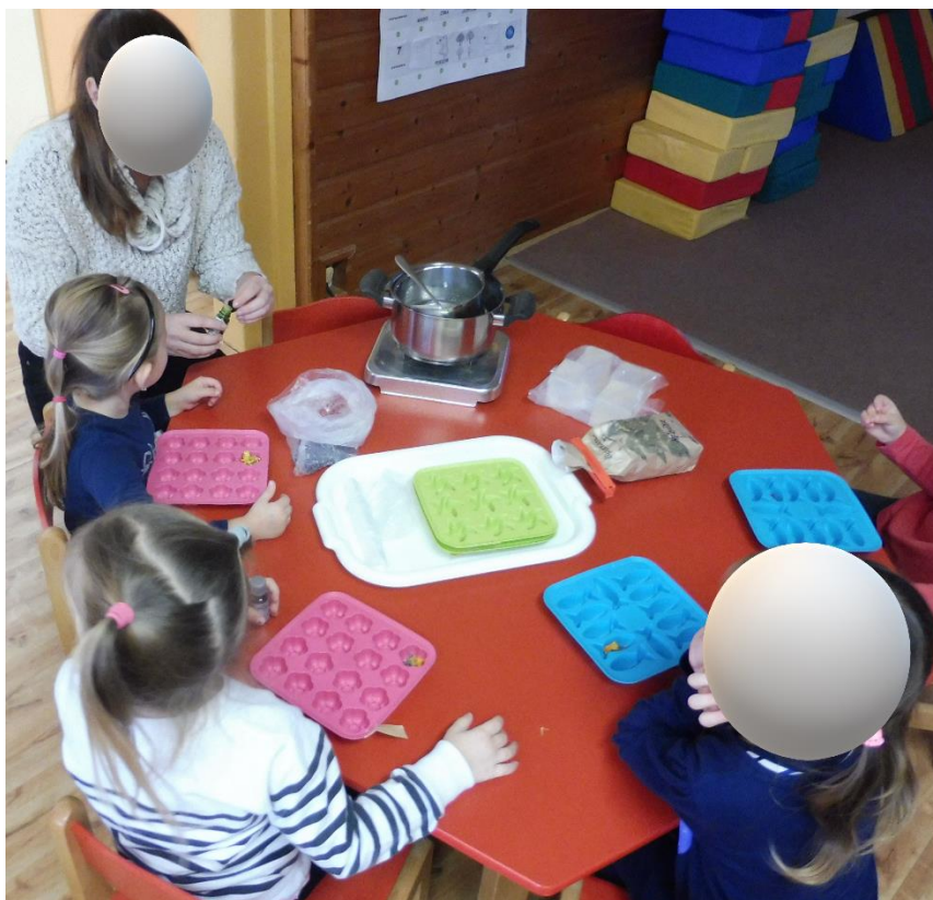
Příloha 5 – výroba mýdla s mladšími dětmi