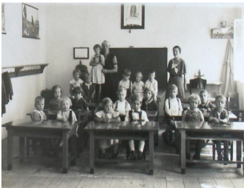
Příloha č. 24

Karlovy Vary, třída mateřské školy Stará Role