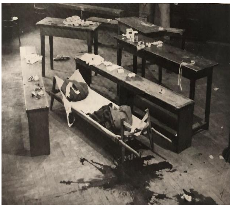
Nejdek, hostinec Střelnice 25. dubna 1935 po srážce henleinovců a antifašistů.