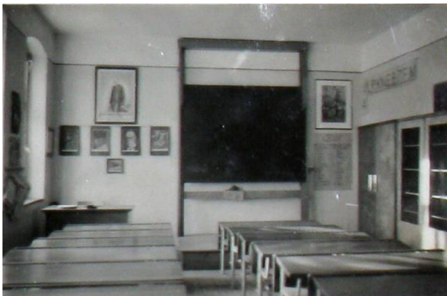
Příloha č. 26

Karlovy Vary, třída obecné školy Stará Role