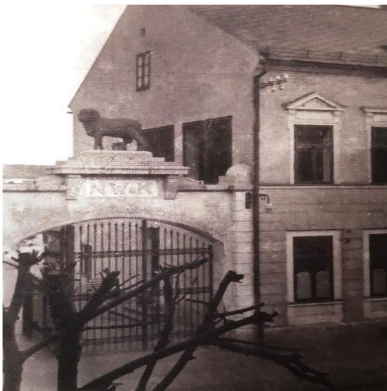
Příloha č. 16