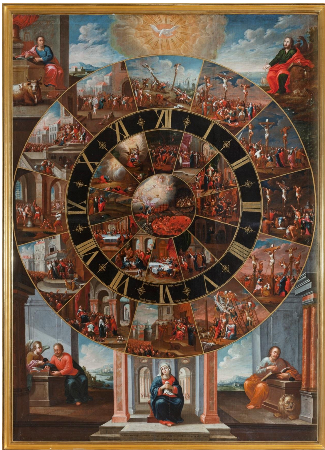
Příloha č. 1 – Eliáš Dollhopf, Pašijové hodiny 151