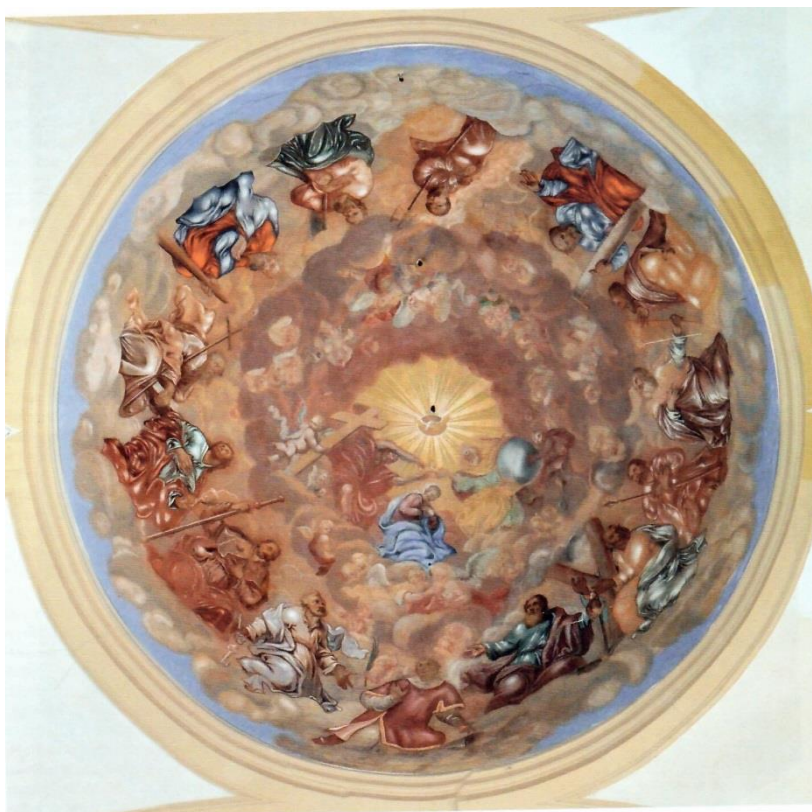
Příloha č. 4 – Korunování Panny Marie, kostel sv. Vavřince v Chodově, Eliáš Dollhopf 154