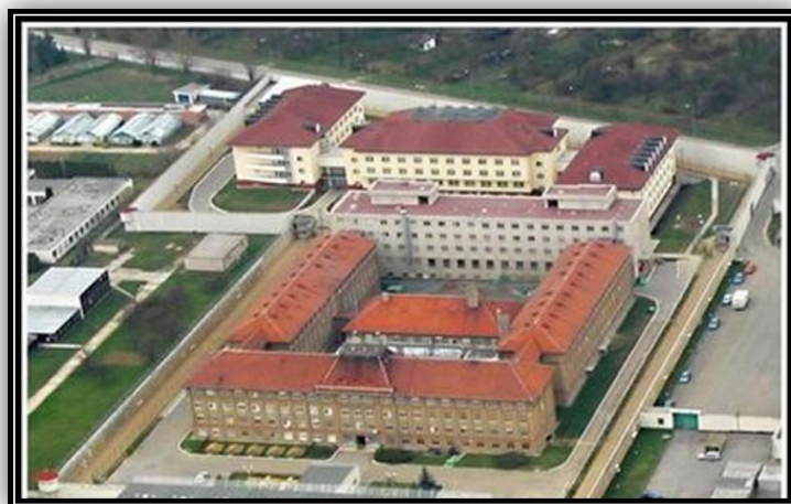
Obrázek 1: Vazební věznice a detenční ústav v Brně