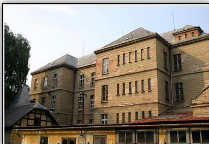
Obrázek 4: Detenční ústav Vidnava