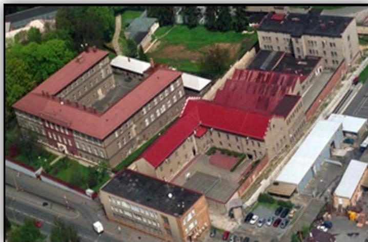
Obrázek 3: Věznice a detenční ústav v Opavě