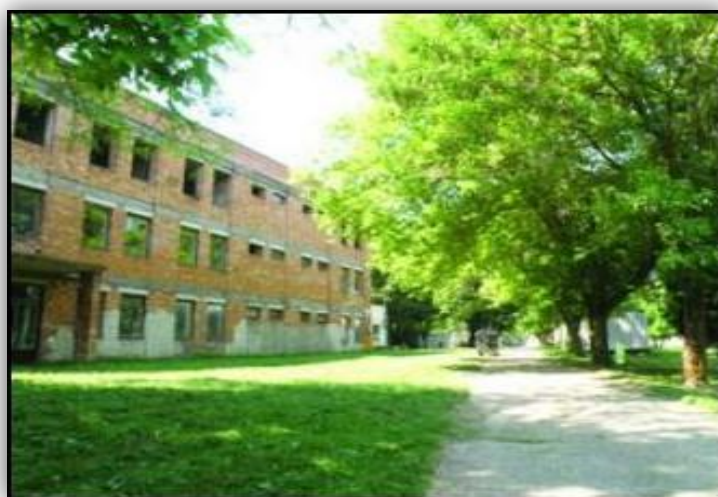
Obrázek 2: Detenční ústav Hronovce