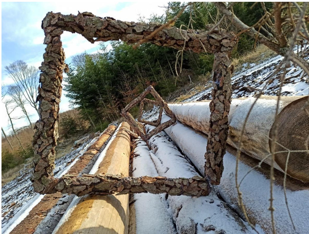
18) instalace leden