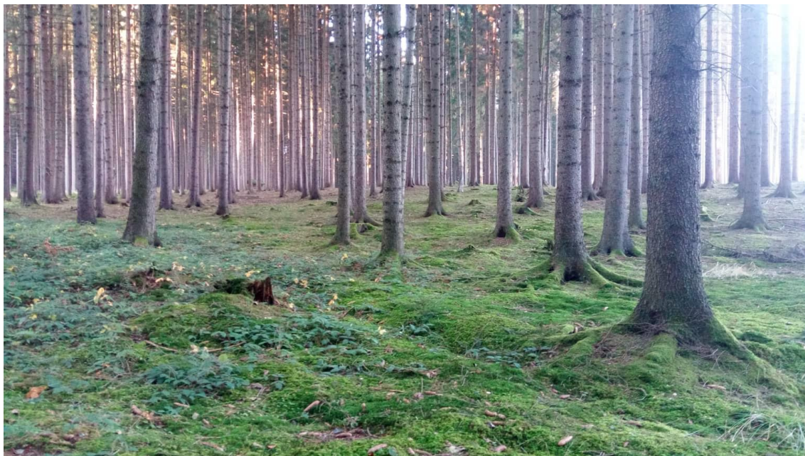
4) fotografie během kácení, leden 2020