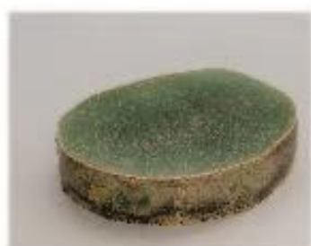
Plíseň pod mikroskopem