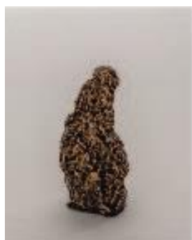
Kukurica v karameli