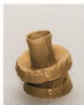
Stojánek na banány