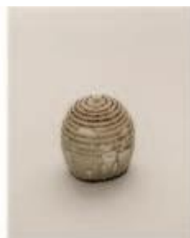
Zabijačka na vesnici