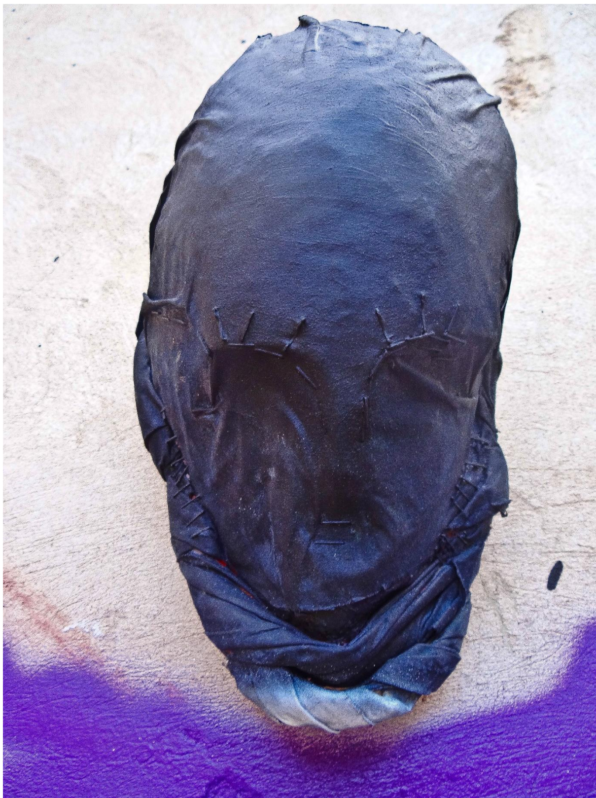
Příloha č. 14, detail busty