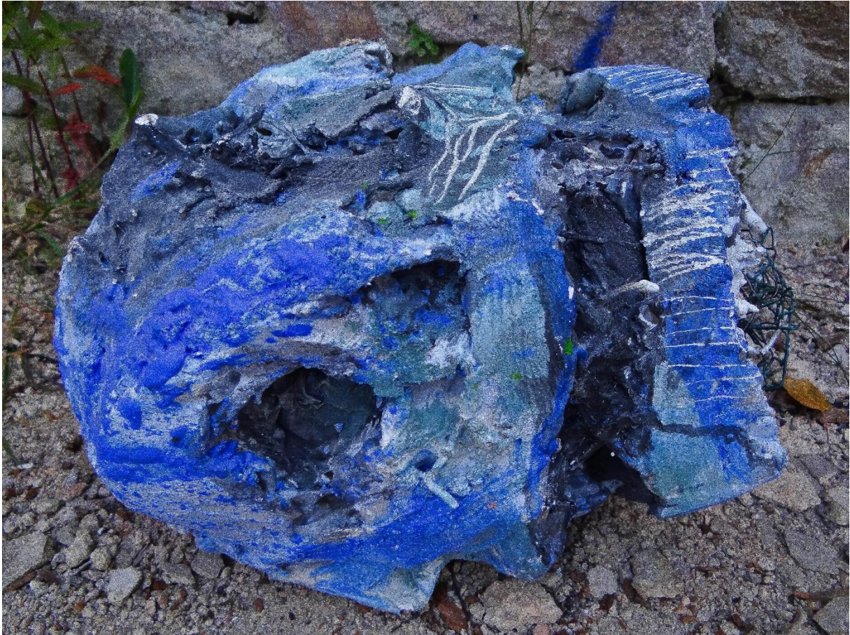
Příloha č. 20, detail busty