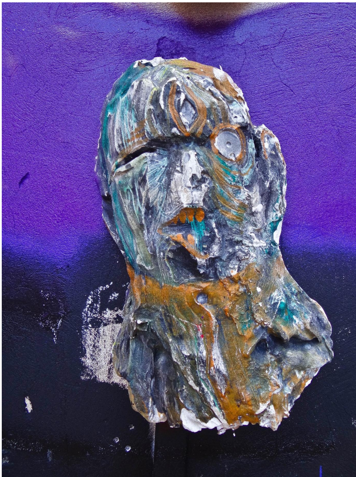
Příloha č. 13, detail busty