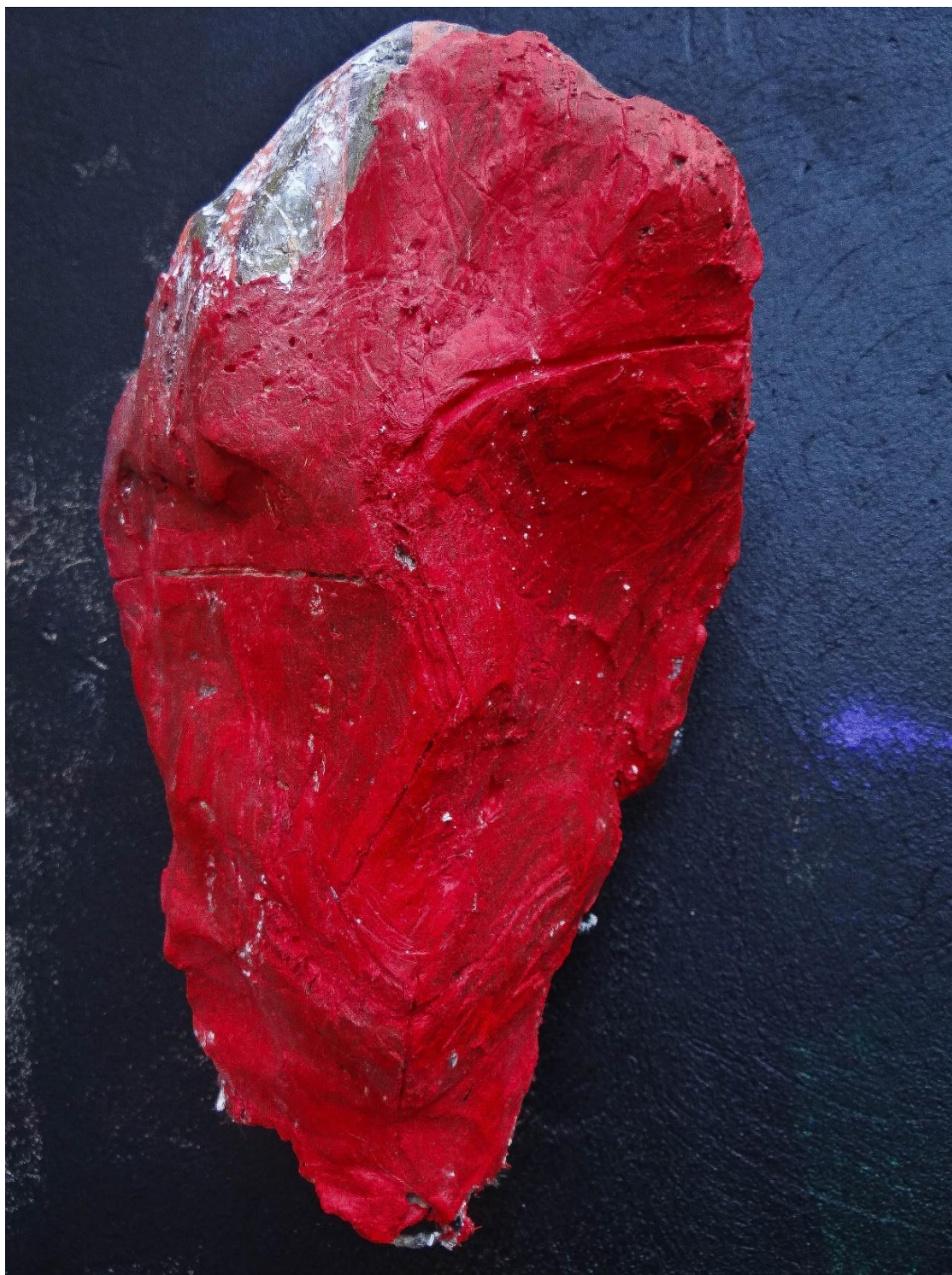
Příloha č. 17, detail busty