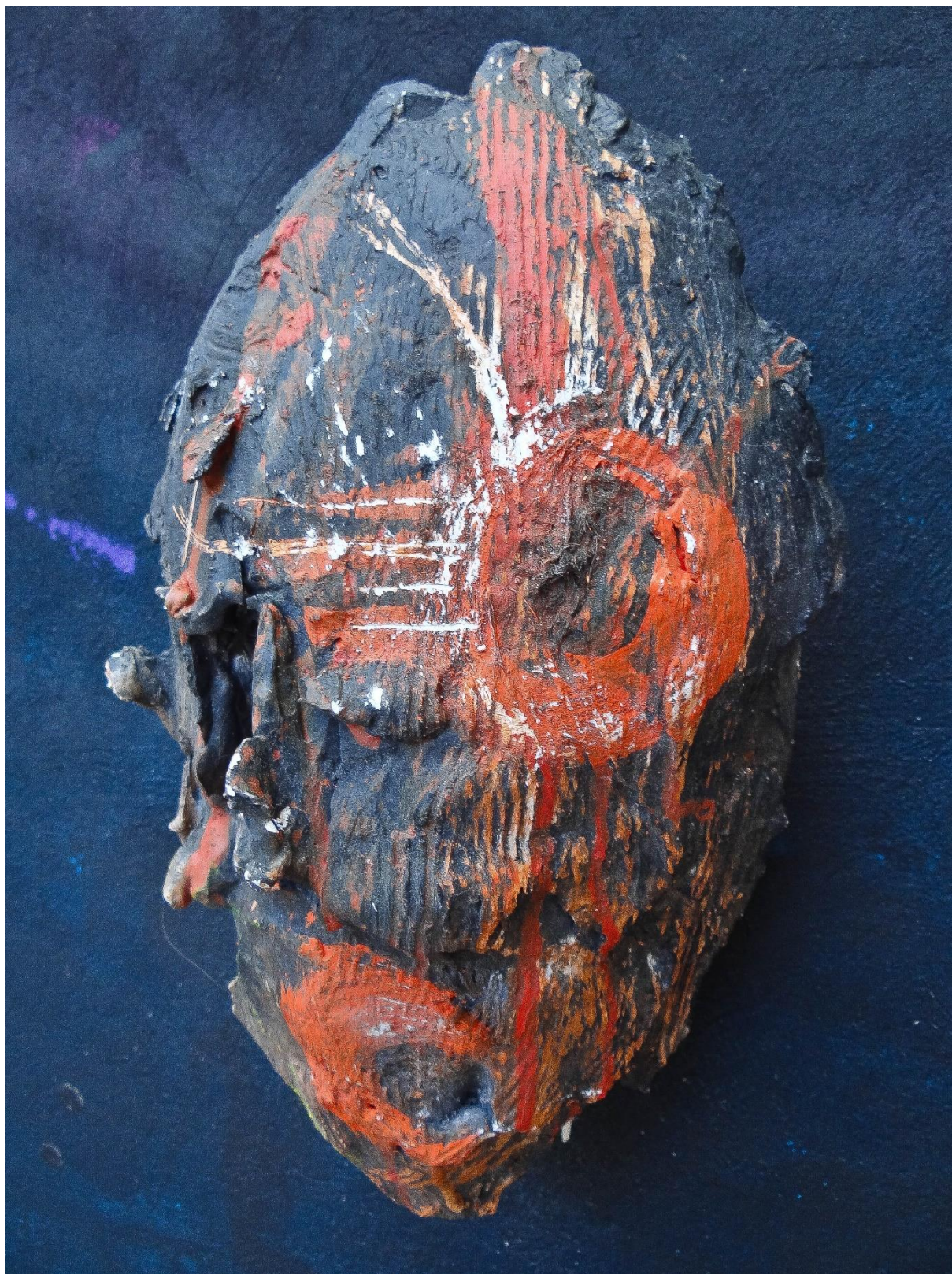
Příloha č. 16, detail busty