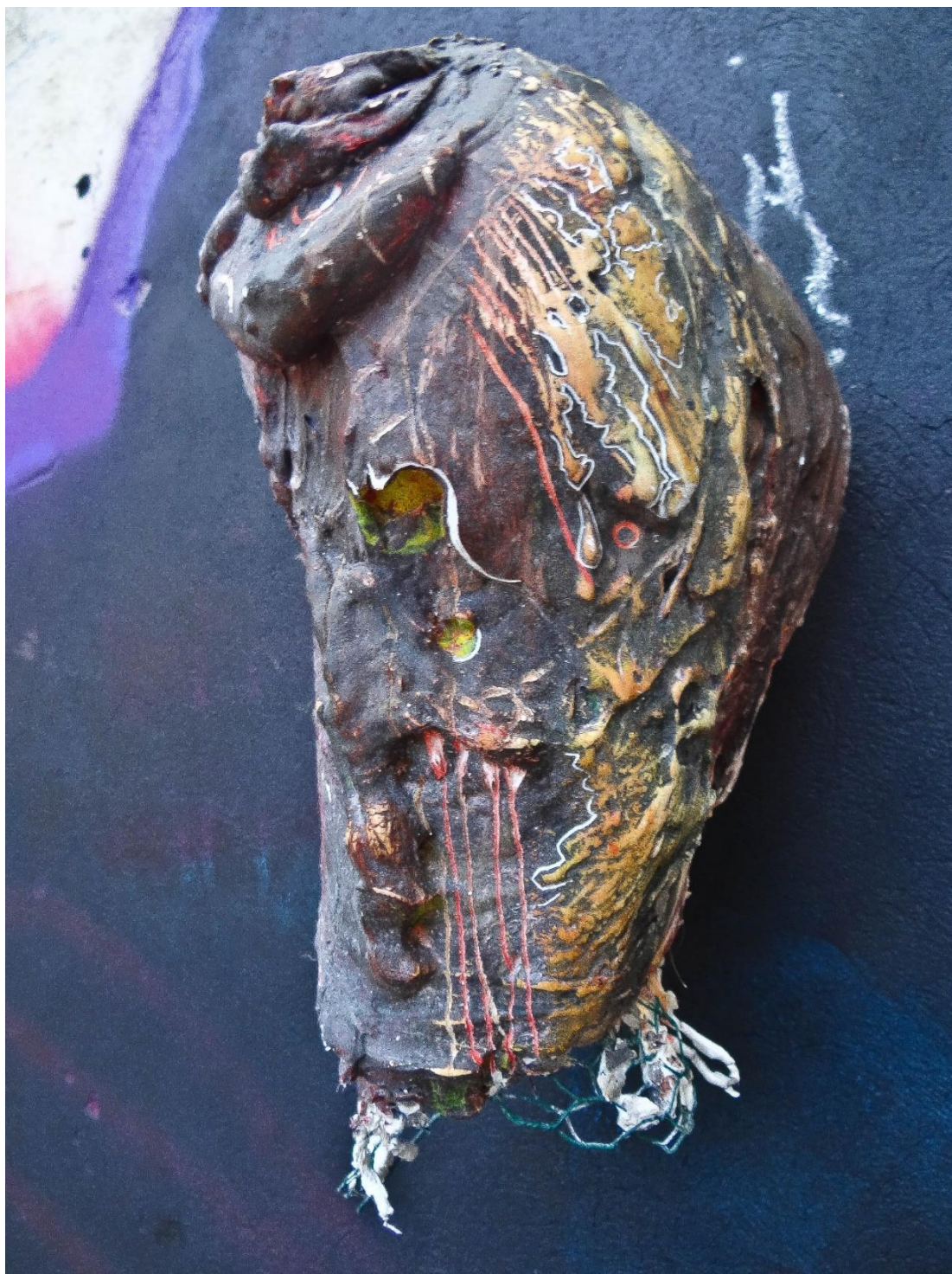
Příloha č. 15, detail busty