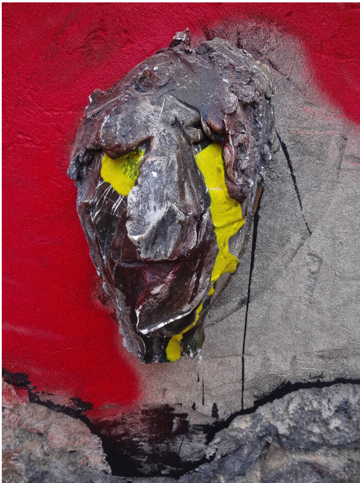
Příloha č. 12, detail busty