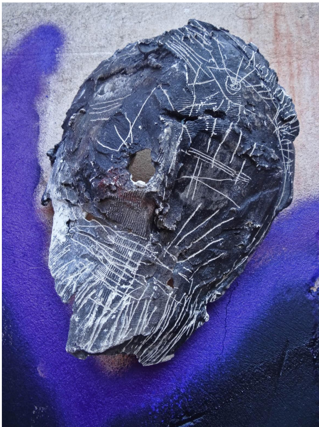
Příloha č. 19, detail busty