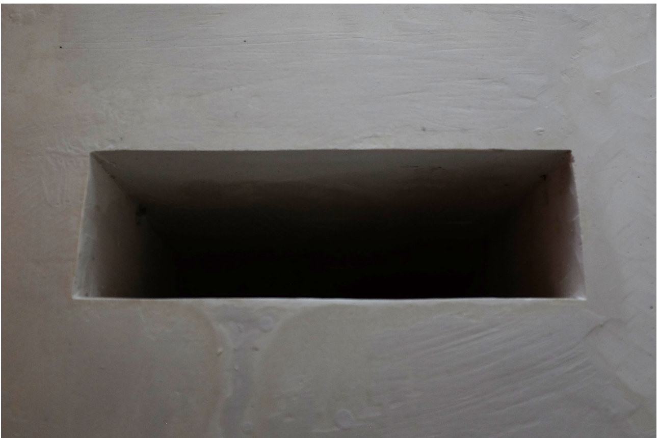
PŘÍLOHA15 (obr.1,obr.2) Sousoší rodina detail