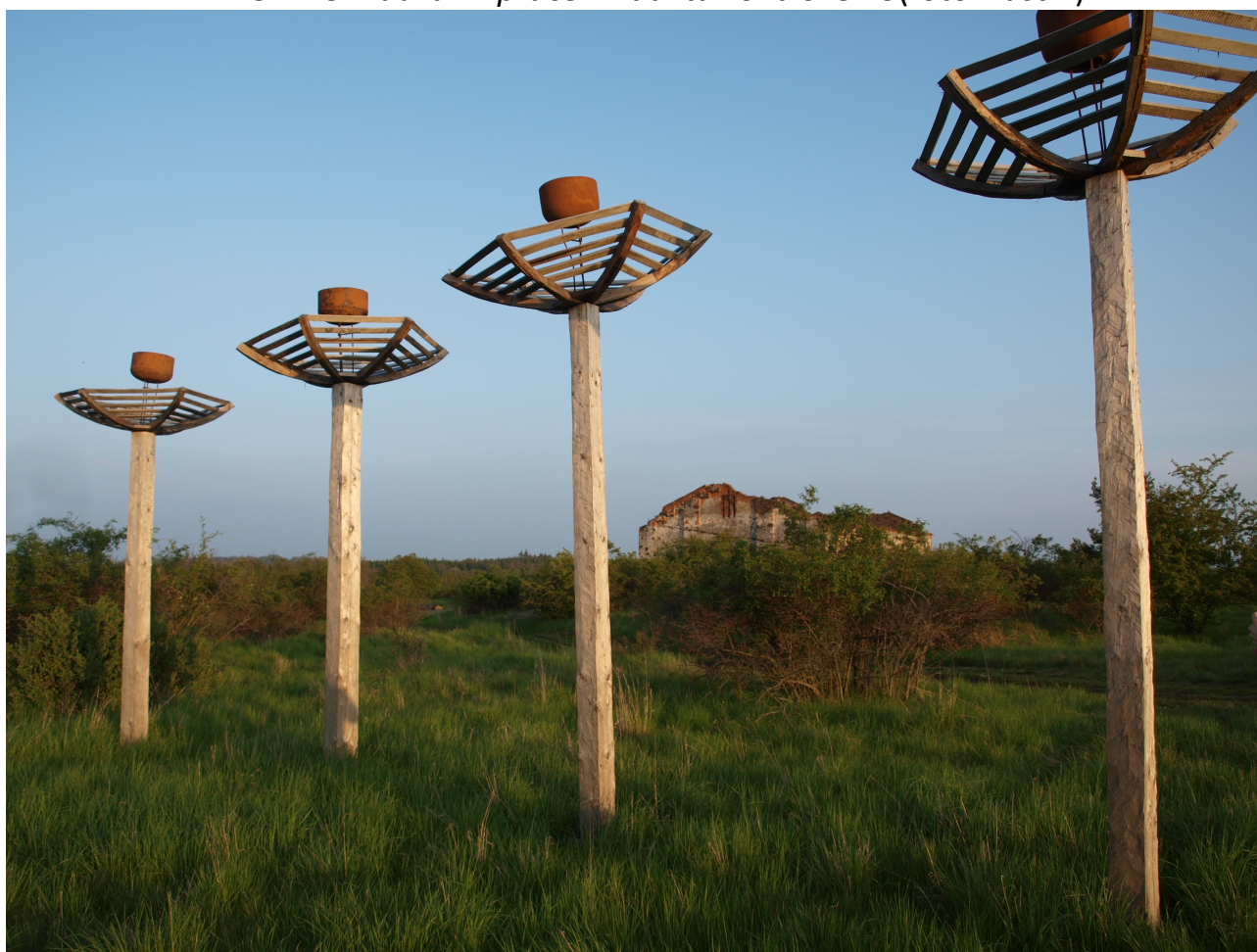
PŘÍLOHA 4 Klauzurní práce - Továrna na mraky