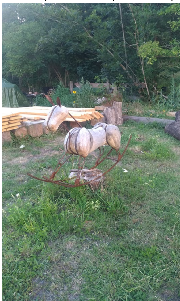
PŘÍLOHA 2 Klauzurní práce - Houpací kůň