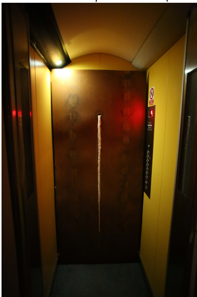
PŘÍLOHA 9 Výstava 7+3 – Společník