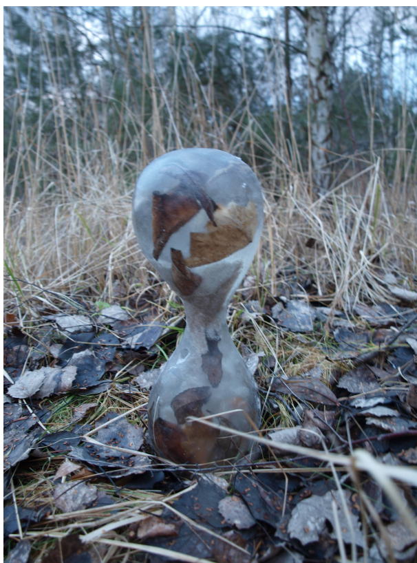
PŘÍLOHA1 Klauzurní práce - Modla přítomnosti