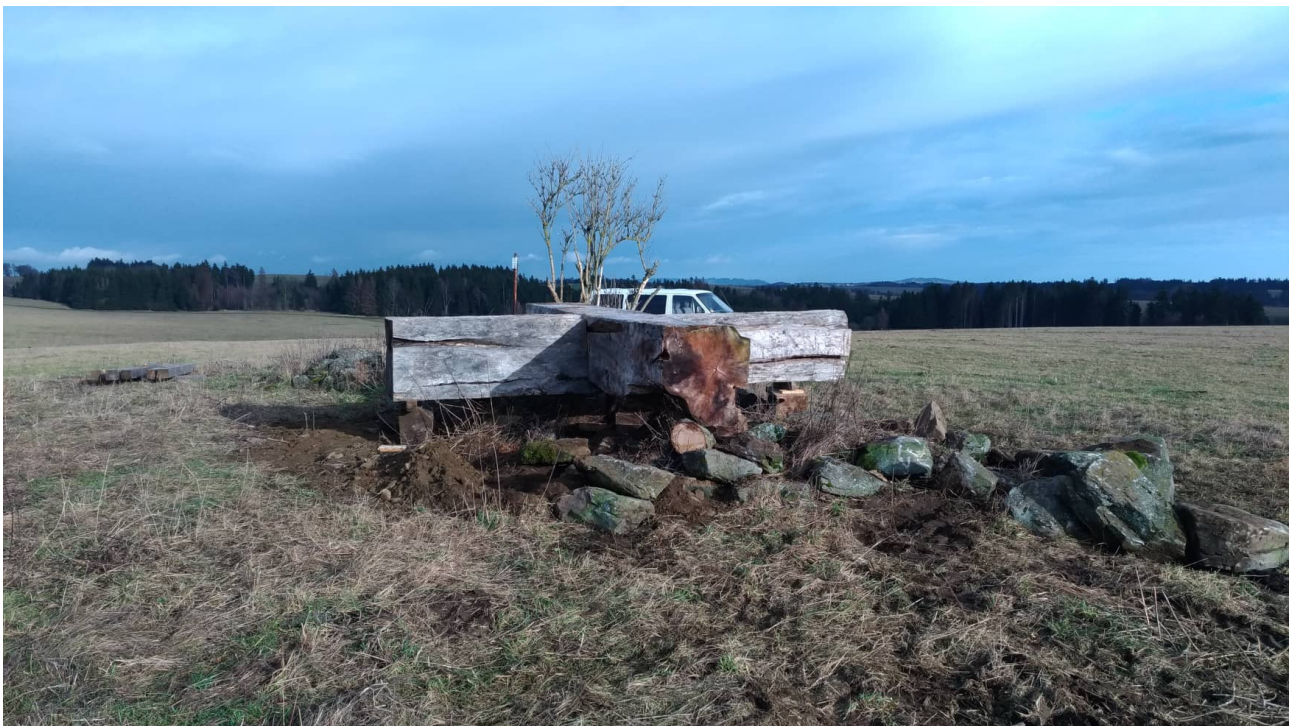
PŘÍLOHA 7 Semestrální práce - Atavismus