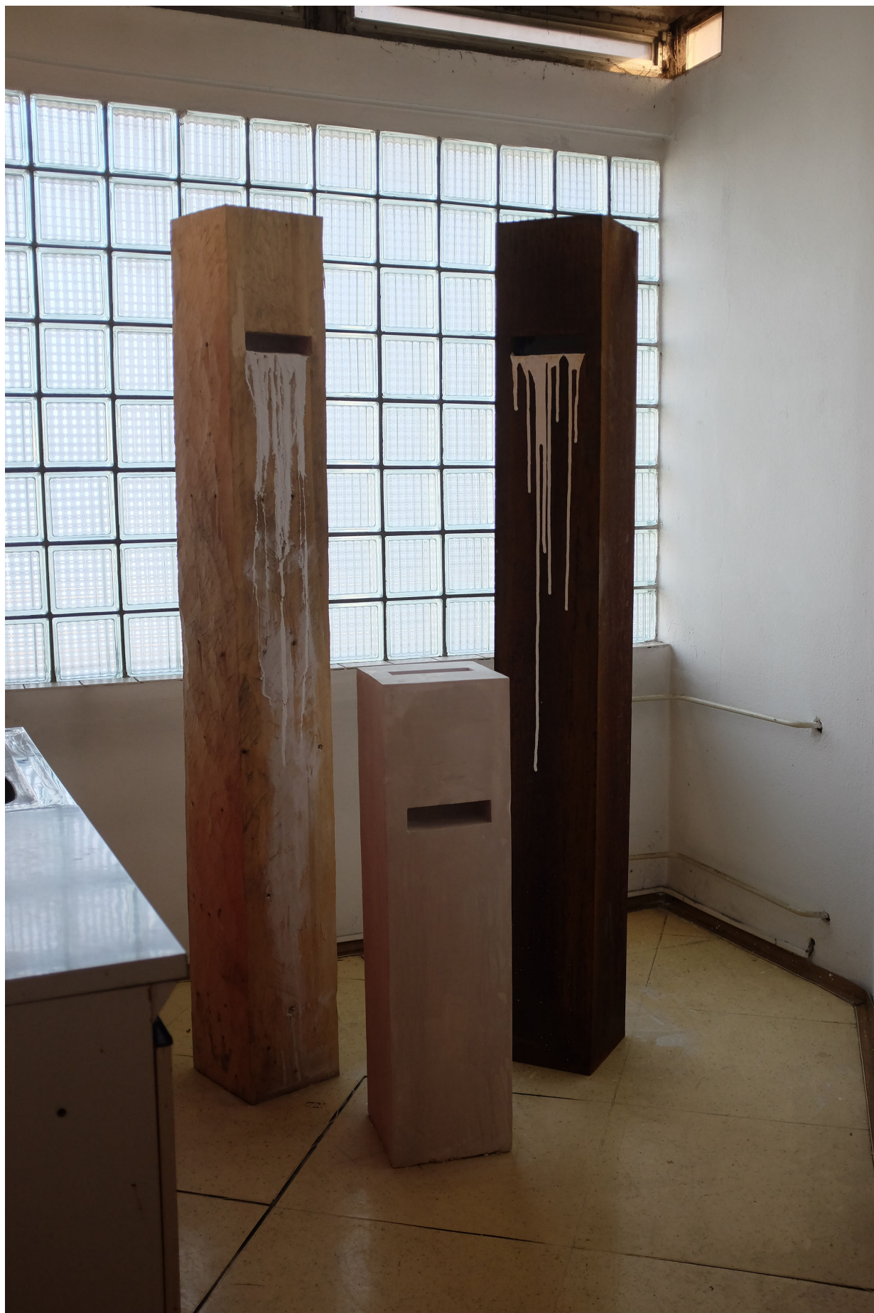
PŘÍLOHA14 Sousoší Rodina na výstavě