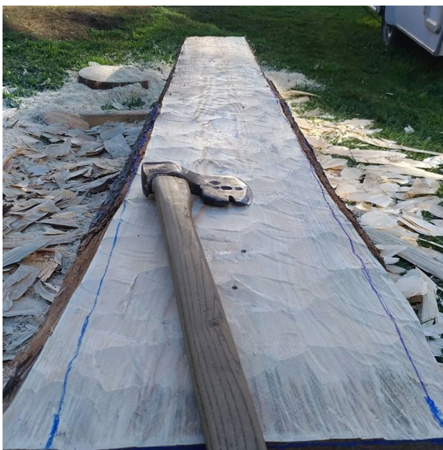
PŘÍLOHA 10 (obr.1,obr.2) V Mojí hlavě – proces tvorby