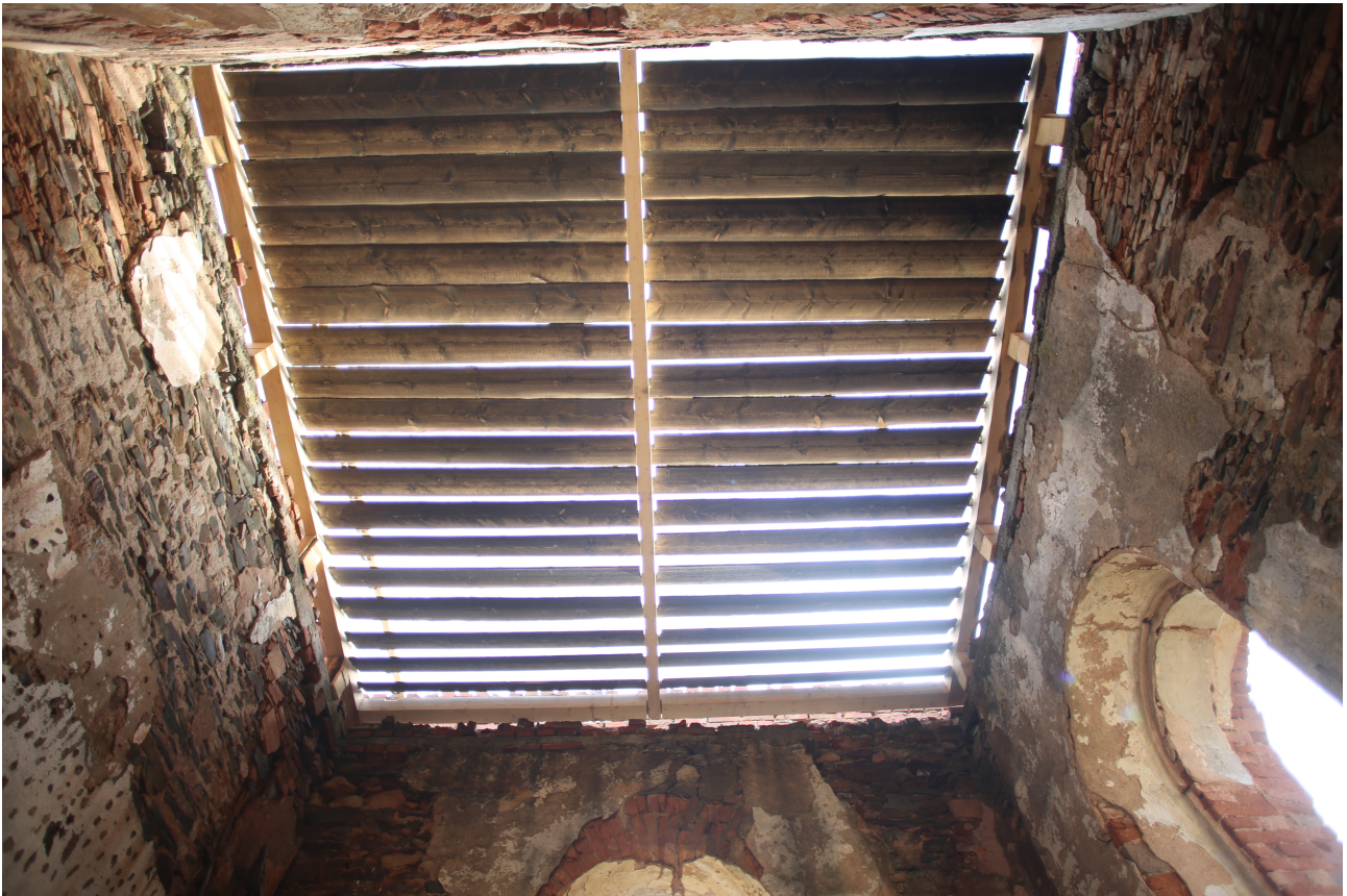
PŘÍLOHA 6 Semestrální práce – Dialog