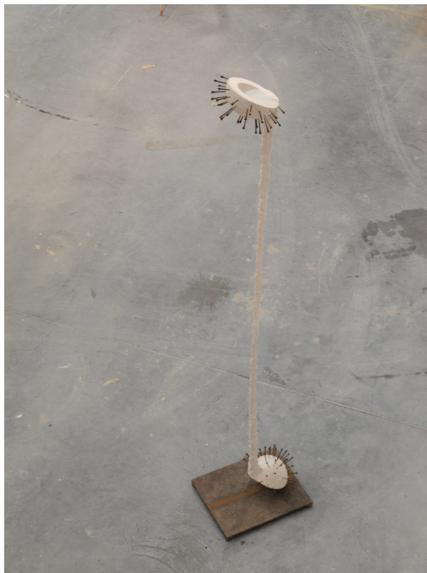
PŘÍLOHA 3 Klauzurní práce - Dualita kontroverze