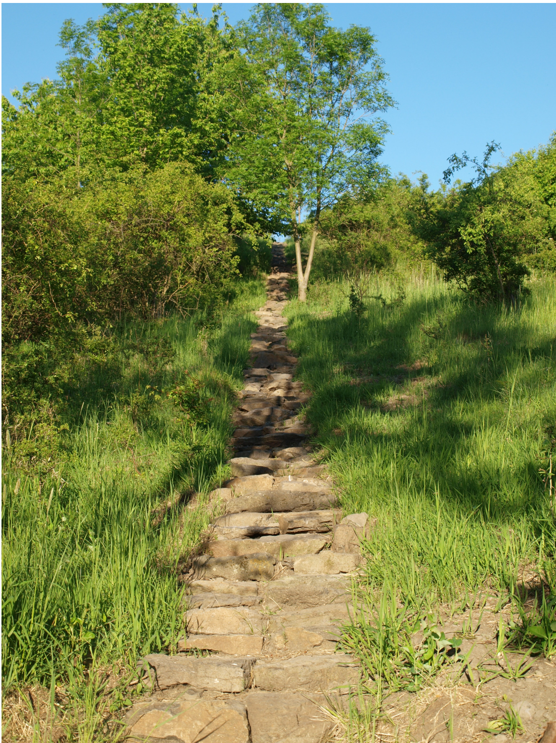
PŘÍLOHA 5 Bakalářská práce – Mé místo je tento svět