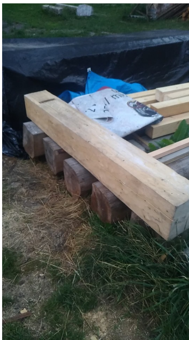
PŘÍLOHA13 (obr.1,obr.2) V Mojí hlavě – proces tvorby