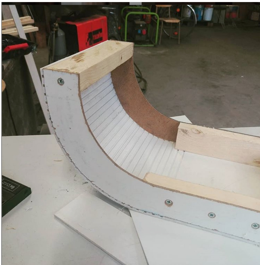
PŘÍLOHA 11 (obr.1,obr.2) V Mojí hlavě – proces tvorby