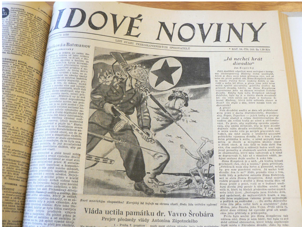
Obrázek 2 Severokorejský voják a čínský lidový dobrovolník vítězí nad malým MacArthurem.