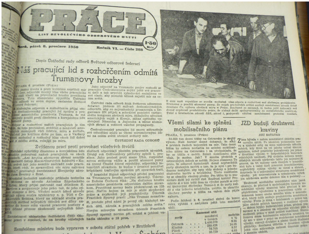
Obrázek 3 Deník Práce reaguje na hrozby použití atomových bomb proti Číně.