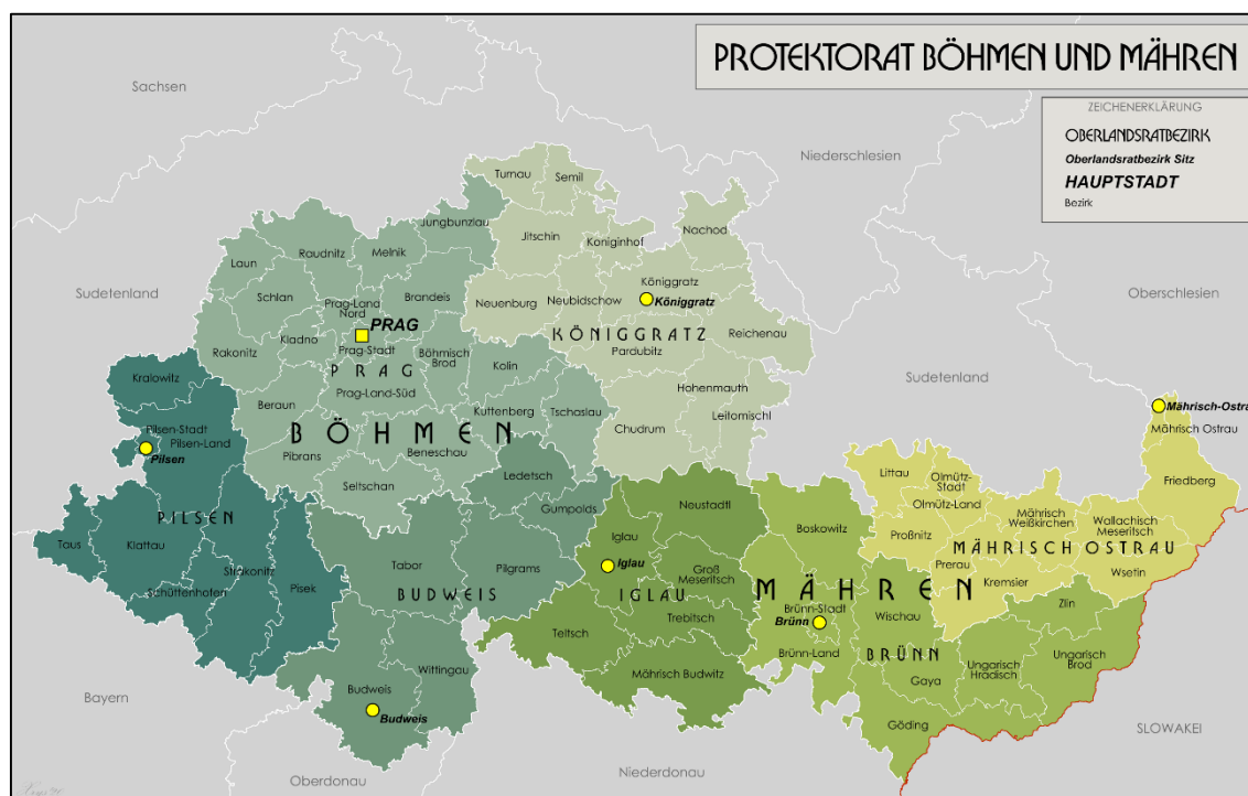
Mapa č. 1 – Územní členění Protektorátu Čechy a Morava v letech 1942 - 1944 251

Pro dokreslení administrativního uspořádání protektorátu autor přikládá mapu (mapa č. 1) členění oberlandrátů po správní reformě Reinharda Heydricha.