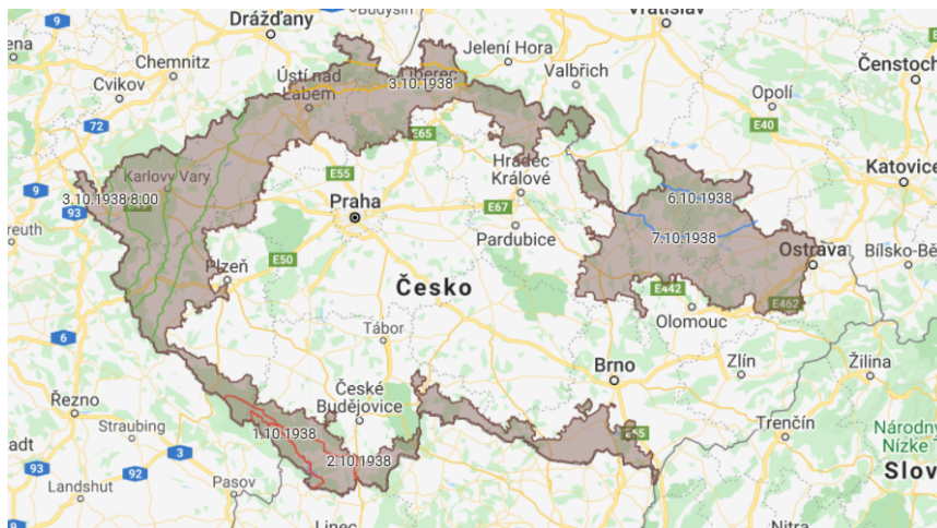
Obrázek č. 1: Mapa Sudet.

Jedná se především o znak přetržení kontinuity, vzniku nové společnosti a zániku obcí z důvodu vysídlení Němců po konci druhé světové války. 173