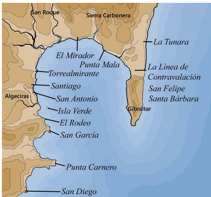
Obrázek 5 - Gibraltarská zátoka

Obléhání se protáhlo přes podzim a zimu, aniž by se posádka vzdala. Na Nový rok 1350 se v táboře objevila černá smrt, která v předchozích dvou letech řádila v západní Evropě. Epidemie vyvolala paniku, protože na mor začalo umírat stále více kastilských vojáků. Generálové, šlechtici a dámy z královského dvora prosili Alfonsa, aby obléhání odvolal, ale král odmítl; podle kastilských kronikářů tasil meč a prohlásil, že neodejde, dokud Gibraltar nebude opět pod křesťanskou vládou. 72