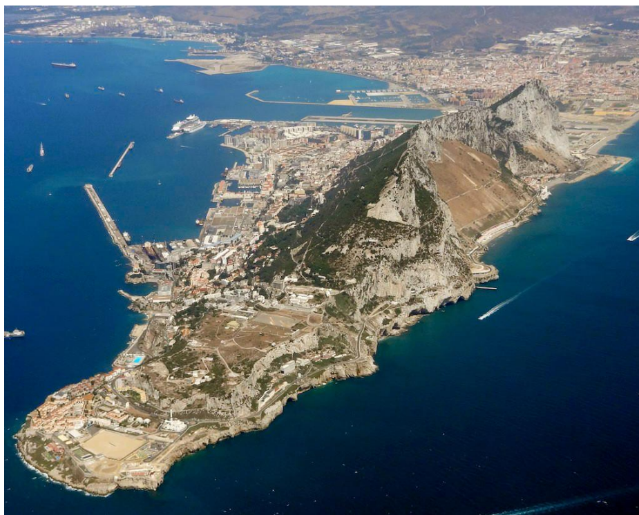
Obrázek 1 - Gibraltar

Skála Gibraltar nebo také hora, dominuje oblasti styku Atlantického oceánu a Středozemního moře od počátku věků. Jedná se o jakýsi pomyslný most a dělicí čáru mezi Evropou a Afrikou. Později, jak se civilizace vyvíjela, se tato „bezvýznamná“ skála stala jedním z nejdůležitějších míst v dané oblasti. Její význam ve světových dějinách byl později o dost větší než její samotná velikost. Přispělo tomu také její úžasné strategické umístění a dominantní výška, která lákala návštěvníky po tisíciletí. Ať už to byli neandrtálci 1 , féníčtí mořeplavci nebo nakonec Britové okolo 18. století. 2