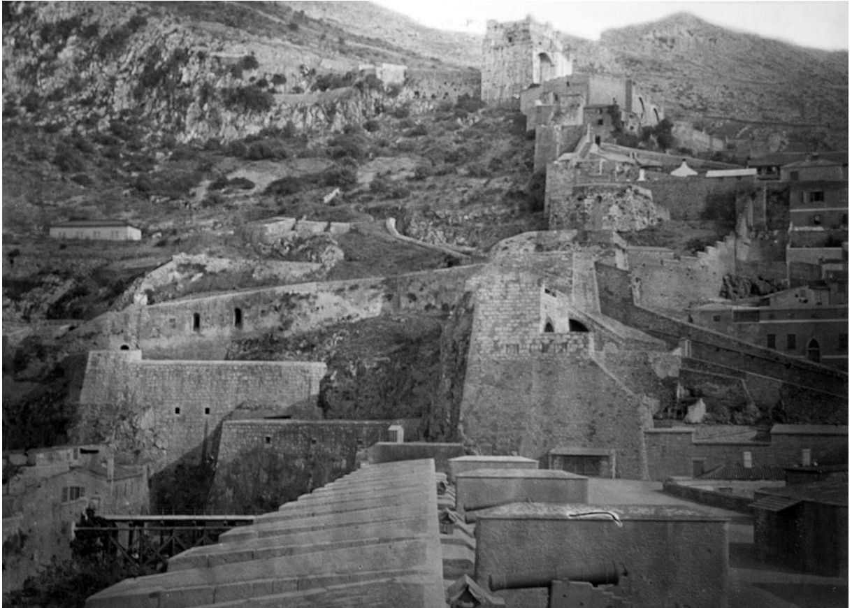
Obrázek 2 - Severní stěny Maurského hradu (1879)

Potom, co se dostali ke skále, přikázal svým mužům, aby zde zřídili základnu. Jednalo se hlavně o přístav pro pozdější operace na Pyrenejském poloostrově. Navíc to sloužilo jako obranná základ. V případě, že by Táriq musel ustupovat a jeho kampaň se mu nevydařila, sloužila by pevnost pod gibraltarskou skálou jako poslední záchrana. 7 Tím započalo de-facto první menší opevnění Gibraltar. Poté co Táríkovo vojsko zvítězilo nad vizigótským králem Roderikem 8 , se začalo danému místu říkat Džabal at-Tárik z arabského (جبل طارق) Hora Táriqa .