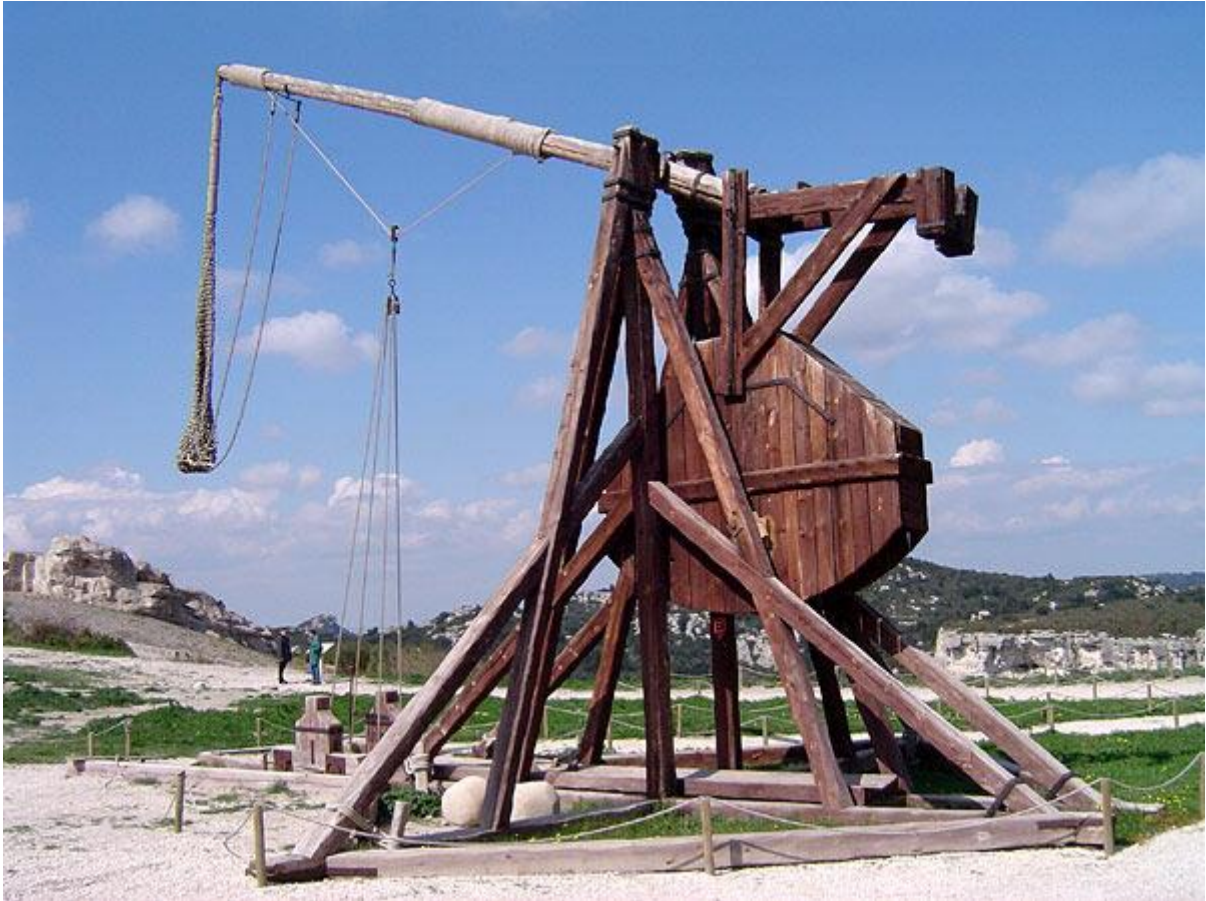
Obrázek 4 - Trebušet

Dané obléhací stroje bombardovali město pod nimi. Ničili domy, hradby, všechno, do čeho se trefili. Tehdejší obléhací stroje nebyli nejpřesnější. Hodně budov a hradeb bylo srovnáno se zemí. Přesto se obránci nevzdávali a odhodlaně bránili svoje pozice. Něco málo přes tisíc obránců roztažených po celé délce hradeb se odhodlaně bránili a opravovali poničené budovy. Nejdůležitější detail této strategie bylo obklíčení. Vzhledem k malému počtu obránců to dávalo obrovský smysl. Pokud totiž zaútočíte z více stran záraz, tak těžko pokryjete každý centimetr hradeb a opevnění. Bylo potřeba opravovat hradby. Střílet na obránce a také být připravený na nečekaný útok téměř z jakékoliv strany.