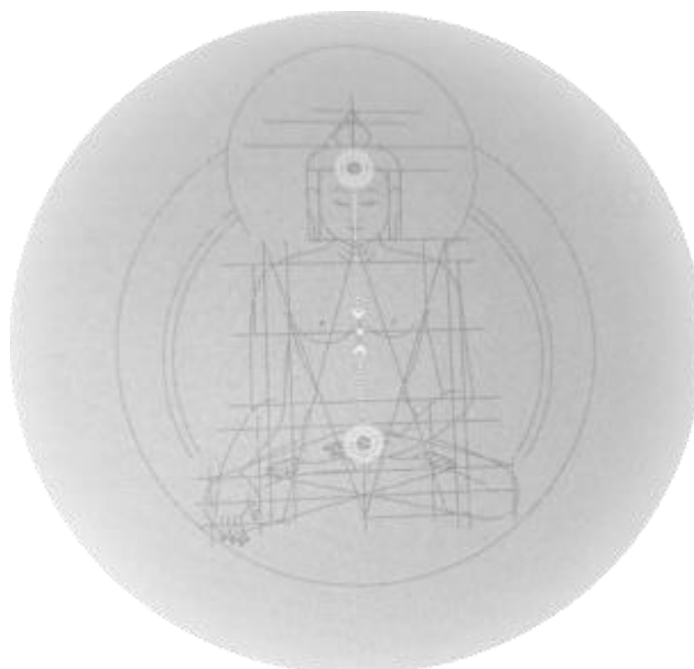
Obrázek 3 Objevení se, stoupání a dovršení 105