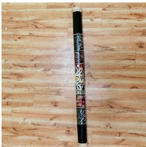
Obrázek 3 dešťová hůl

Středoamerickými původními obyvateli je používán jako rituální hudební nástroj pro „přivolávání“ i „odhánění“ deště. 40 Jedná se o dutou dřevěnou hůl, vyrobenou ze zdřevnatělého kaktusu nebo bambusu. Uvnitř má ve spirále zapařené kolíky a drobné kamínky nebo semena. Hůle mohou být různě dlouhé. Pomalým nakláněním a přesypáváním nástroj vyluzuje zvuk podobný dešti nebo šumění moře (viz obrázek 3).