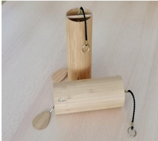
Obrázek 4 zvonkohra koshi

ošetřený přírodním olejem, což umožňuje také venkovní použití. Koshi zvonkohry přináší 4 tónové variace, které zastupují čtyři elementy: Země (zelený), Vody (modrý), Ohně (červený) a Vzduchu (žlutý) (viz obrázek 4). 41