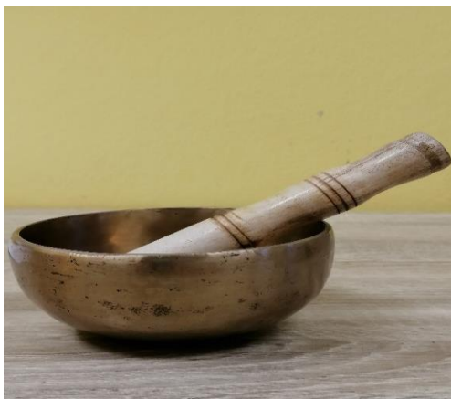
Obrázek 1 tibetská mísa

„Jedná se o ručně vyráběný, tepaný kovový nástroj ve tvaru kulaté mísy, vyrobený ze zvláštní slitiny sedmi až dvanácti kovů.“ 38 Mísy existují v nespočetném množství různých velikostí, tvarů, barev a výsledných zvuků. Hra na ně se uskutečňuje za pomoci paličky. Ty mohou být z tvrdého či měkkého dřeva, z filcu, korku, plsti, gumy nebo jiného materiálu. Zvuk vytváříme úderem paličky do okraje mísy, nebo točením paličkou na mísu okolo jejího okraje ve směru hodinových ručiček (viz obrázek 1).