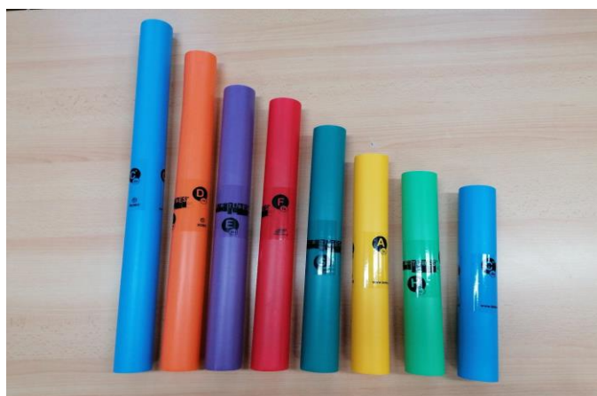
Obrázek 8 boomwhackers

Boomwhackers je poměrně nový hudební nástroj, který se dostává do povědomí veřejnosti a stává se čím dál oblíbenějším zejména pro svoji jednoduchost. Pokud se budeme řídit rozdělením hudebních nástrojů dle principů Orffovy školy na melodické a nemelodické, můžeme ho zařadit do nástrojů melodických. 43 Jedná se o sadu plastových, různě barevných trubek, přičemž každá barva odpovídá jednomu tónu ve stupnici. Každý jednotlivý tón má svou barvu, která se v různých oktávách mění jen nepatrně. Délka se napříč oktávami pochopitelně mění. Čím je roura delší, tím hlubší tón vydává. 44 Zvuk vyluzujeme úderem o předměty (zed', podlaha, židle...), hrou na tělo (úder o nohu), nebo údery trubic o sebe. Vzhledem k tomu, že v jedné sadě je 8 trubic, je možno nástroj využít pro skupinovou hru a rozvíjet tak kooperaci ve skupině. Hra na tento nástroj přispívá k rozvoji tvořivých činností a také k vytváření pozitivního sociálního klima. Boomwhackers jsou vhodné k tvoření jednotlivých tónů nebo jako doprovod písně. Lze je také využít při hudebně pohybových činnostech a zároveň tak rozvíjet hudební a motorické dovednosti dětí. V současné době vychází také zpěvníky pro děti, ve kterých jsou písně s barevně označenými notami (viz obrázek 8).