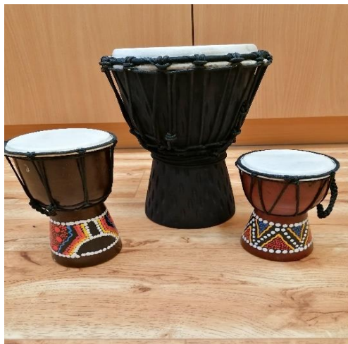
Obrázek 2 bubny djembe