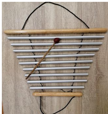
Obrázek 5 zvonkohra rotující zvukové vlny

Zvonkohra se prodává pod komerčním názvem rotující vlny. Je složená z trubicových kovových hracích kamenů, řadíme ji mezi idiofony. Hráť na nástroj můžeme dvojm způsobem. Zvonkohru lze zavěsit do prostoru a hráť na ni paličkou. Další možností je držet ji v ruce a prostřednictvím pohybu do stran nebo kroužením celé paže v prostoru rezonující trubice vyluzují zvuk. Rotující zvukové vlny mají dřevěný rám. Trubky mohou být vyrobené z hliníkových slitin, mosazi, oceli, mědi a jiných kovů (viz obrázek 5). 42