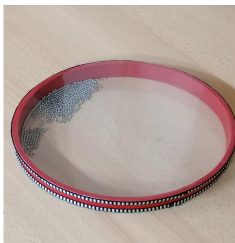
Obrázek 7 ocean drum

Uvnitř kulatého bubnu jsou malé ocelové kuličky, které se pohybují a vytváří tak zvuk, který věrně evokuje zvuk oceánu (viz obrázek 7).